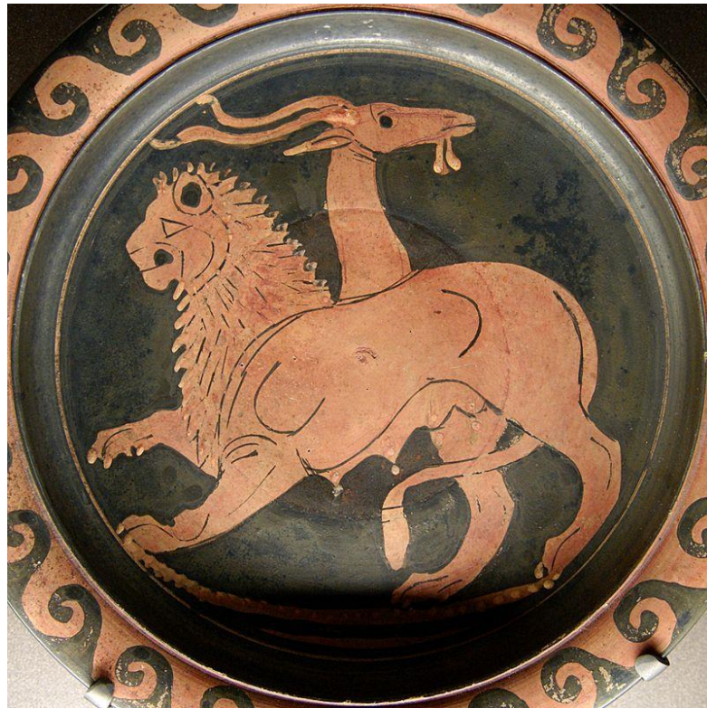
Slika 1. Prikaz kimere na apulijskom tanjuru, 350-340. pr. Kr.

Cilj ovog rada je objasniti mehanizme i posljedice pojave ljudskih kimera, ukazati na poteškoće u njihovoj detekciji i na kraju spomenuti neka od rješenja koja predstavljaju brže, efikasnije ili preciznije metode detekcije.