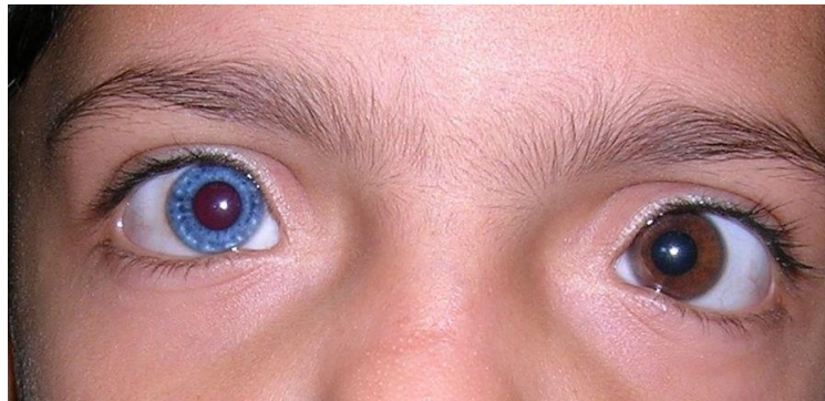
Slika 2. Heterokromija kod očiju djeteta, preuzeto sa https://howlingpixel.com/en/Heterochromia_iridum .

Prvi opisani slučajevi kimerizma otkriveni su zbog nedosljednosti pri određivanju krvne grupe (Dunsford i sur. 1953), a to je čak i danas najčešći način otkrivanja kimera. Vidljive asimetrije fizičkog fenotipa poput različite boje očiju (Slika 2), specifičnih uzoraka pigmentacije kože (Slika 3) i nejasnoće izgleda primarnih spolnih obilježja (Gartler, 1962) rijetki su vidljivi fizički simptomi prirodnog kimerizma. Ipak, ova obilježja ne moraju nužno biti definitivni pokazatelji kimerizma jer mogu nastati kao posljedica nekih drugih uzroka, poput različitih vrsta genetičkih mutacija (Gladstone, 1969; Thomas i sur. 1989; Yordam i sur. 2001).