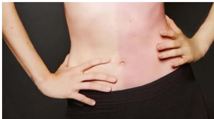
Slika 3. Neuobičajen uzrak pigmentacije kože abdomena tetragametne kimere.