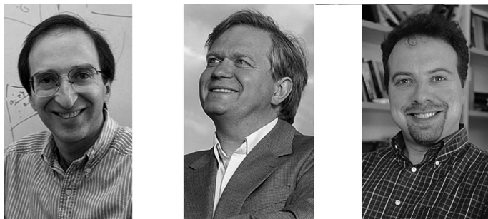
Slika 1. Dobitnici Nobelove nagrade iz fizike za 2011. godinu, Saul Perlmutter (lijevo), Brian P. Schmidt (u sredini) i Adam G. Riess (desno). Perlmutter (r. 1959. god.) je profesor astrofizike na University of California u Berkeleyu. Schmidt (r. 1967. god.) profesor je na Australian National University u Weston Creeku, a Riess (r. 1969. god.) je profesor astronomije i fizike na Johns Hopkins University i Space Telescope Science Institute u Baltimoreu.

Početak i kraj 20. stoljeća u kozmologiji je obilježen velikim otkrićima. Velika pak otkrića u početku najčešće još nemaju objašnjenje. Kada je Vesto Slipher 1913. godine objavio otkriće crvenog pomaka u spektrima spiralnih maglica, niti prava priroda spiralnih maglica još nije bila otkrivena. Na samom kraju stoljeća, a ujedno i milenija, 1998. godine, otkriće ubrzanog širenja Svemira promijenit će kozmološku paradigmu – umjesto gravitacijske sile Svemirom vlada tamna energija čije je porijeklo, unatoč intenzivnim istraživanjima proteklih desetak godina, još uvijek nepoznato.