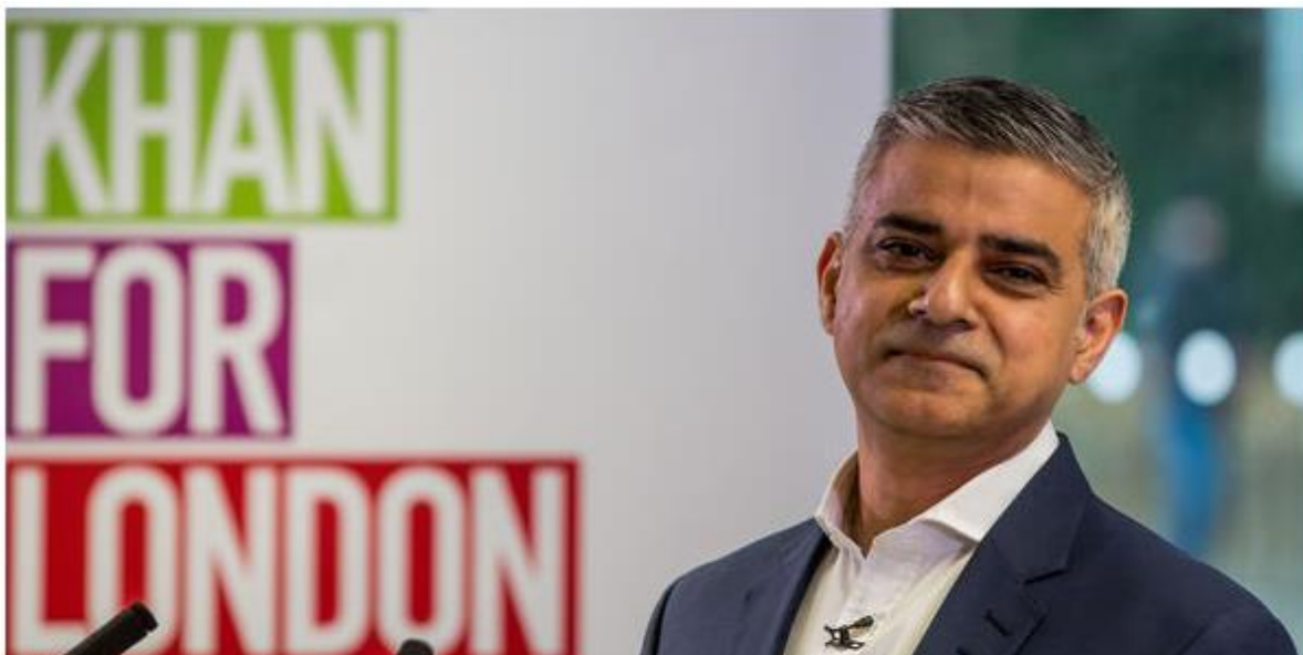
Sl.3. Gradonačelnik Londona od 2016. godine, Britanski Pakistanac Sadiq Khan

Definiranje etničke pripadnosti nosi sa sobom i pojmove jezika, kulture, religije, nacionalnosti i zajedničke baštine. Etnička pripadnost sve se više prepoznaje kao politički simbol koji ne isključuje samo grupe i pojedince iz redovnog društva, već i služi kao oblik identiteta – simbol pripadnosti i političke mobilizacije (Bagguley i Hussain, 2005). Identifikacija s etničkom pripadnošću nije jedinstvena kod svih generacija, dok se prve generacije vide samo kao „Pakistanci“, druge i sljedeće generacije vide se kao „Britanski Pakistanci“ ili kao „Britanci“. Bitna komponenta u razvijanju „britanskog“ identiteta novijih generacija bilo je i razvoj građanstva. Razvoj građanstva među pakistanskim zajednicama prošao je kroz niz transformacija koje su počele s nesukladnošću i izolacijom, a u kontekstu „outsajderstva“ (Geaves, 2005). No izolacionizam i outsajderstvo se mijenjalo te su s godinama Pakistanci zavrjedili svoj status u društvu i napredovali, a tome je i dokaz to što je trenutni gradonačelnik Londona upravo Britanski Pakistanac, Sadiq Khan (Sl.3.).