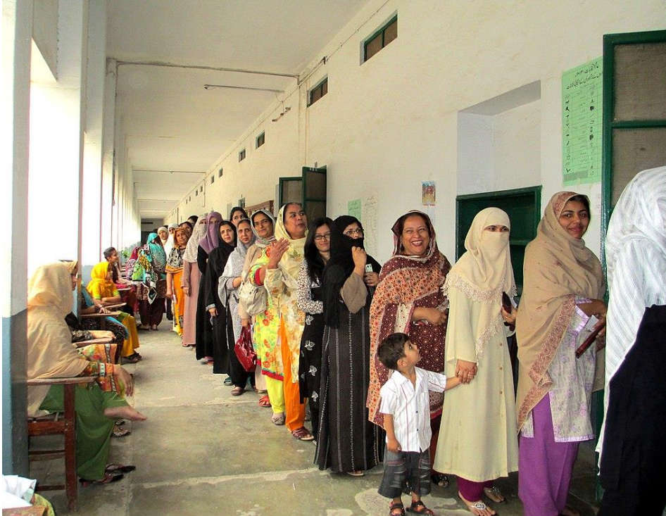
Sl.9. Pakistanske žene odjevene s različitim vrstama pokrivala čekaju u redu za glasanje na izborima u gradu Rawalpindi

Razdvajanje prostora prema rodu rezultiralo je stvaranjem prostornih i društvenih granica u skladu s rodnim normama. Ceste, bazeni, autobusne stanice i školska dvorišta kodirani su kao muški prostori, a djevojke se rijetko ohrabruju ići izvan područja kuće ili vrta (Halvorson, 2005). Danas je i dalje sporno pitanje prava i položaja djevojaka i žena unutar šireg društvenog poretka, a neki segmenti društva usvojili su strogu regulaciju tijela i života djevojaka. No ipak dolazi do nekih promjena unutar pakistanskog društva, uočava se veći stupanj formalnog obrazovanja djevojaka, a samim time i njihova povećana mobilnost. Danas se uz poslove u kući i oko kuće, žene angažiraju i u poslovima kojima ostvaruju prihod zbog povećane potrebe za novcem. Proces određenih religijskih promjena u Pakistanu poklapa se s integracijom određenih kapitalističkih procesa i odnosa (Halvorson, 2005). Vidljive su promjene u položaju žena prvenstveno zbog ženskog aktivizma i opiranja sistemu. Najbolji primjer tome jest djevojka Malala koja je aktivistica za obrazovanje djevojaka i dobitnica Nobelove nagrade za mir 2014. godine.