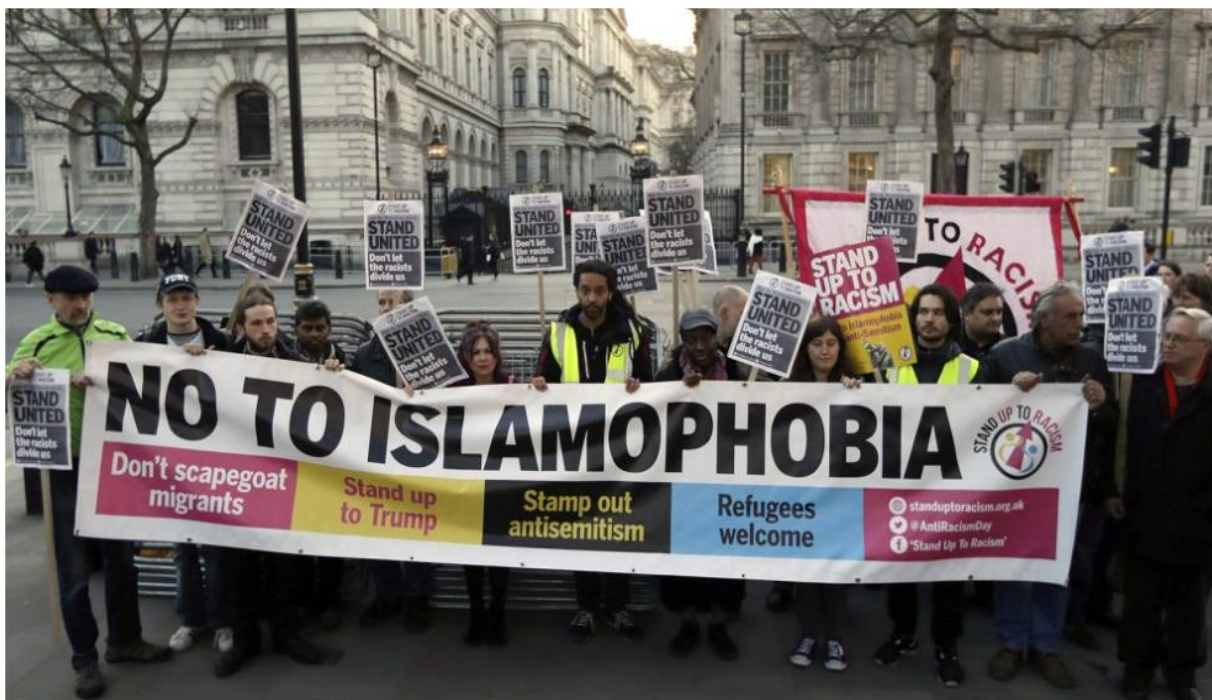
Sl.8. Ulični prosvjed protiv rasizma i islamofobije na ulicama Britanije

Pitanje identiteta Pakistanaca u Britaniji postalo je kritičnije za mlade nakon napada 9/11, a pogotovo nakon londonskih napada 7/7. Činjenica da su tri od četiri bombaša samoubojica bili rođeni u Britaniji, a pakistanskog podrijetla ostavila je cijelu Britaniju u šoku, ali i isto tako i Britance pakistanskog podrijetla. Masovni porast islamofobije, negativni publicitet i opća percepcija o muslimanima uzrokuju osjećaje odbačenosti kod pakistanskih zajednica. Pakistanski doseljenici, ali najviše mlade generacije Pakistanca rođenih u Britaniji počinju se osjećati strancima u onome što smatraju svojim domom. Mladi se Britanski Pakistanci kreću svojim putem kroz više paradigmi identiteta – etnički i vjerski, povezani s povijesnom prošlošću i kulturnom sadašnjošću (Department for Communities and Local Government, 2009). No i britansko se društvo mijenja i sve se više opire rasizmu i islamofobiji, prihvaćajući različitosti unutar britanskog društva. To je vidljivo kroz mnoge ulične prosvjede Britanaca kojima zagovaraju zaustavljanje diskriminacija i na kulturološkoj i na vjerskoj bazi (Sl.8.).