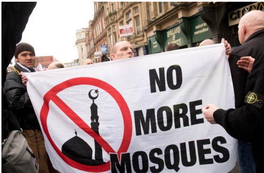
Sl.5. Islamofobni prosvjedi na ulicama Londona s natpisima “Ne više džamija”

Reakcije na 9/11 bile su brze, povezivanje Islama i terorizma te suprotstavljanje Islama i Kršćanstva poticali su dodatno antiislamsko raspoloženje i razne prosvjede protiv muslimana na britanskim ulicama (Sl.5.).