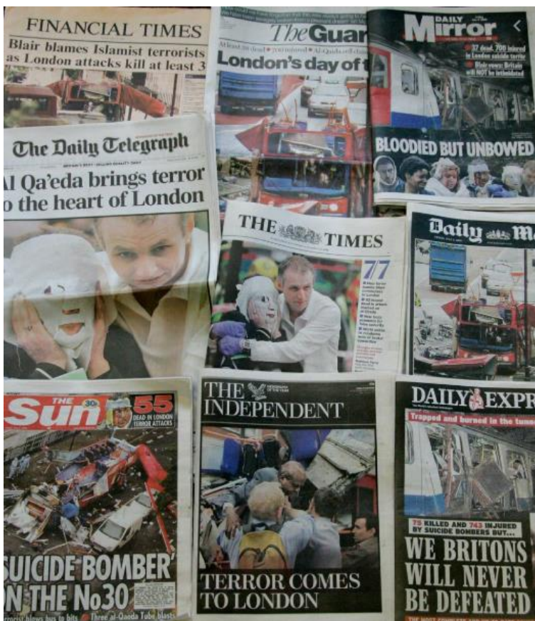
Sl.7. Britanske novine prikazuju posljedice napada 7/7

7. srpnja 2005. godine u središtu Londona četiri su bombaša samoubojica ubila 56 i ranila oko 700 ljudi. Bombaši su ciljano izveli napade u sustavima javnog prijevoza kako bi bilo što više žrtava i kako bi šteta bila veća. To su bili prvi samoubilački bombaški napadi u zapadnoj Europi, a Al-Qaeda je preuzela odgovornost. Tri od četiri bombaša rođeni su Britanci pakistanskog podrijetla (BBC News, 2019). Šok je odjeknuo širom Britanije – da bi Britanski Pakistanci mogli počinuti takav čin. To je rezultiralo povećanjem napetosti između bijelaca/Engleza i Pakistanaca/muslimana u Ujedinjenom Kraljevstvu (Din, 2006). Ponovno je uslijedila velika pokrivenost medija događajima koji su se zbili i reakcijama Britanskog društva na njih (Sl.7.)