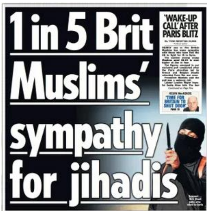
Sl.6. Isječak naslova iz britanskih novina s negativnim konotacijama prema muslimanima

Važnu ulogu u stvaranju percepcije kulture i religije imali su i mediji. Nakon napada 9/11 u medijima se uočava velik opseg pokrivenosti raznim člancima i prilozima o „ekstremističkim skupinama“ te „islamskom terorizmu“, a jezik kojim se opisuju muslimani često konotira nasilje (Sl.6.).