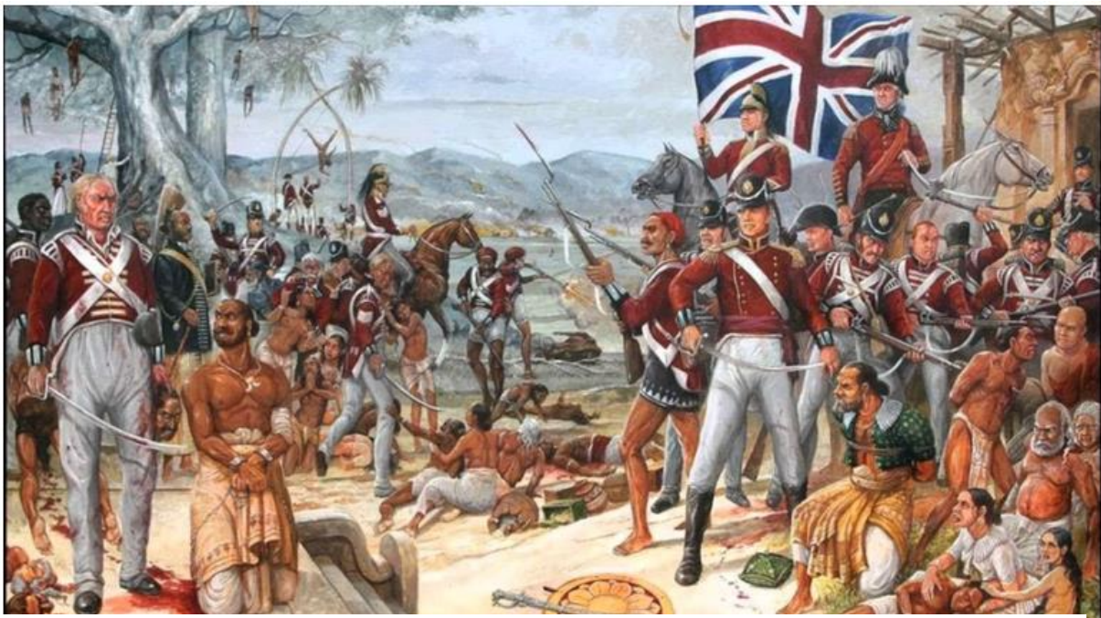
Sl.1. Ilustracija vremena dolaska “civilizacije” na Indijski potkontinent

Kako bi razjasnili migracije iz prostora Pakistana u Ujedinjeno Kraljevstvo treba se vratiti na sam početak britanskog prisustva na Indijskom potkontinentu. Britanci su došli početkom 17. stoljeća kao pomorci i trgovci u potrazi za robom, no to se pretvorilo u osvajanje i uspostavljanje vlasti koja je potrajala dugi niz godina. Kao što to biva u kolonijama, važno je bilo provoditi politiku koja bi doprinosila ekonomiji imperijalne sile tj. temeljni odnos bio je eksploatacijski. Ekonomska eksploatacija s vremenom je sve više rasla, ali i određeni rasistički elementi koji su postavili kulturu domaćeg stanovništva u inferiorni položaj. Ono što se isticalo kao strukturalna karakteristika kolonijalnog društvenog poretka jest kulturni antagonizam (Čičak-Chand, 1996). Godinama je stvarana slika da sve što je britansko jest „ono pravilno“ i „civilizacijsko“, a pakistansko stanovništvo i njihove vrijednosti stavljene u podaničku poziciju. Tako su tijekom nekoliko stoljeća stvarane zapadne predodžbe (složen spoj znanja i vlasti) o Istoku (orijentalizam) i reproducirane unutar europske tradicije (Šakaja, 2015). Takvi stavovi i razmišljanja bili su prikazani u knjigama te raznim ilustracijama (Sl.1.).