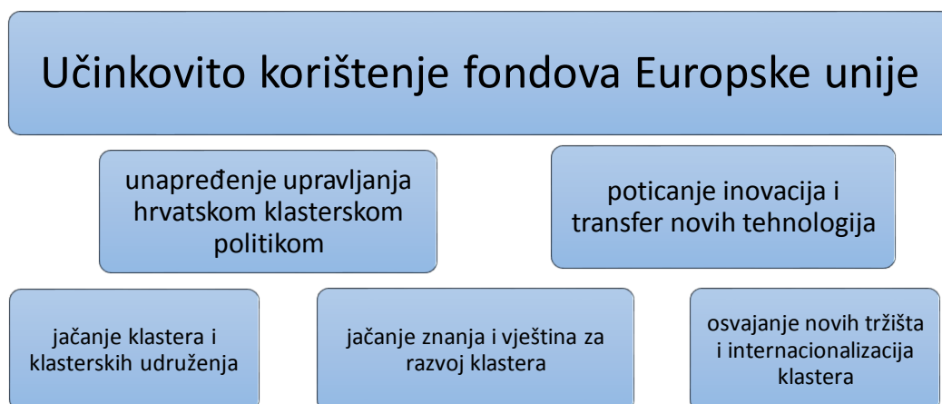
Sl.1. Glavni ciljevi Strategije razvoja klastera u Republici Hrvatskoj 2011-2020.

Suradnja s klusterskom politikom EU– Strategija razvoja klastera nastoji produbiti i osnažiti odnose s nositeljima politike klastera u EU. Posebice se ohrabruju one institucije koje teže postati partner europskoj klusterskoj zajednici. Pomoć takvim institucijama odvija se u obliku konzultacija te financiranja. Suradnja s klusterskom politikom EU znači aktivno sudjelovanje u programima EU.