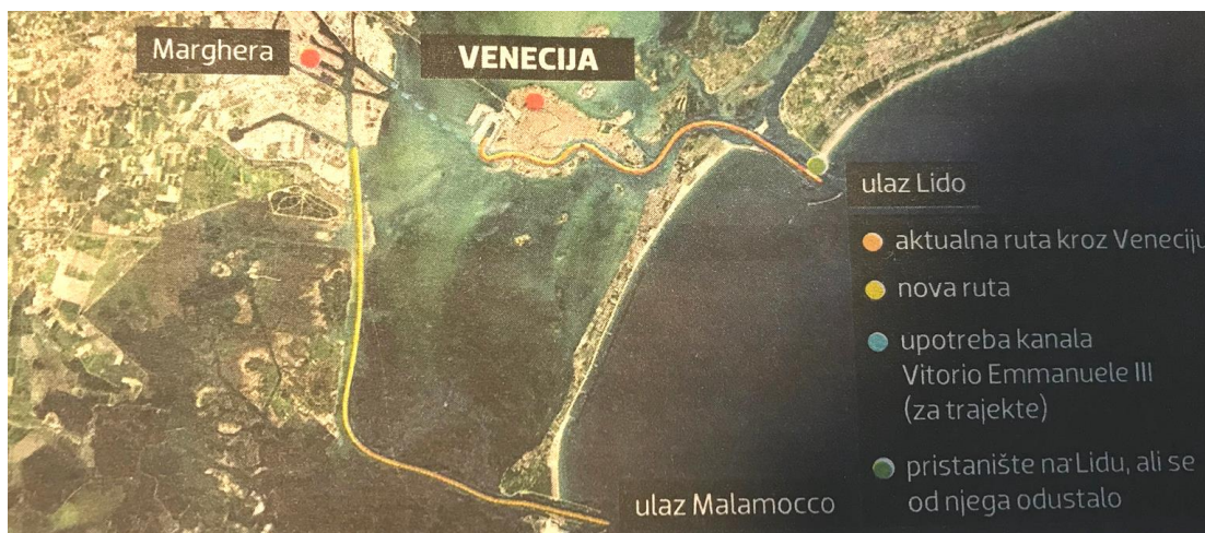
Slika 4. Prikaz alternativnog puta plovidbe kruzera u Veneciji

jedan. Naime, 2. lipnja 2019. godine, megakruzer MSC Opera naletio je na manji turistički brod kod venecijanskog bazena San Marco. Nasreću nitko nije poginuo, ali ranjeno je petero ljudi. Zbog čega se to dogodilo? Kanal Guidecca preuzak je da bi megakruzeri kroz njega mogli ploviti i vijugati vlastitim porivnim strojevima i kormilom, pa ih pokreću tegljači. Njihovo vučenje megakruzera, između desetke manjih brodova i brodića nije bilo uspješno. Stručno povjerenstvo grada predložilo je vladi Italije da brodovima ukupne težine stotinu i više tona, zabrani plovidbu kanalom Giudecca ispred Trga Sv. Marka i napravi alternativni put. Alternativni put je uplovljavanje kroz Vrata Malamocco, zatim plovidba Petrolejskim kanalom, desetak kilometara južno od Venecije. Kruzeri će pristai u industrijsku luku Marghere, a putnici će do grada morati malim brodovima posve nezanimljivim kanalom Vittorio Emmanuele III. (Slika 4.). Također je bilo prijedloga o potpunom ukidanju dolaska kruzera u Veneciju, ali to bi ostavilo posljedice za poslovanje. Potpuna zabrana ulaska brodova za krstarenje imala bi za grad i cijelu regiju teške gospodarske posljedice. Venecijanski terminal za kruzere lokalno zapošljava između četiri i pet tisuća ljudi ili 4% zaposlenih Venecijanaca (Večernji list). Također Venecija bi izgubila i prihode od turista koji troše novac u gradu. Međutim, teško je pokušati pronaći ravnotežu u gradu u kojem ga turizam oživljava dok ga istovremeno umrtvljuje.