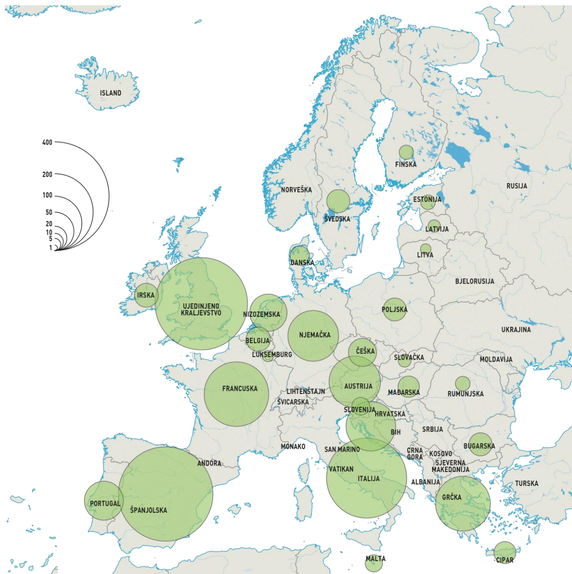
Karta 1. Prostorni raspored broja noćenja turista (u milijunima) u zemljama Europske unije 2018. godine

noćenja na tisuću stanovnika (Tablica 4.).