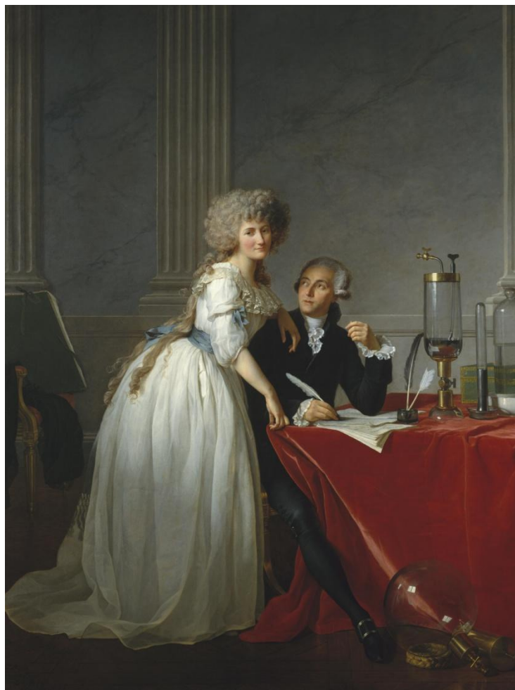
Slika 1. Lavoisier sa suprugom. 9

Prvi je, u procesu redukcije metala ugljenom, dokazao da nastali plin jest jednak fiksiranom zraku. Priestleyevo otkriće kisika vjerojatno ga je inspiriralo na provjeru pokusa te je godinu dana kasnije, A.D. 1775., ustanovio da je upravo to plin koji uzrokuje oksidaciju metala. 1