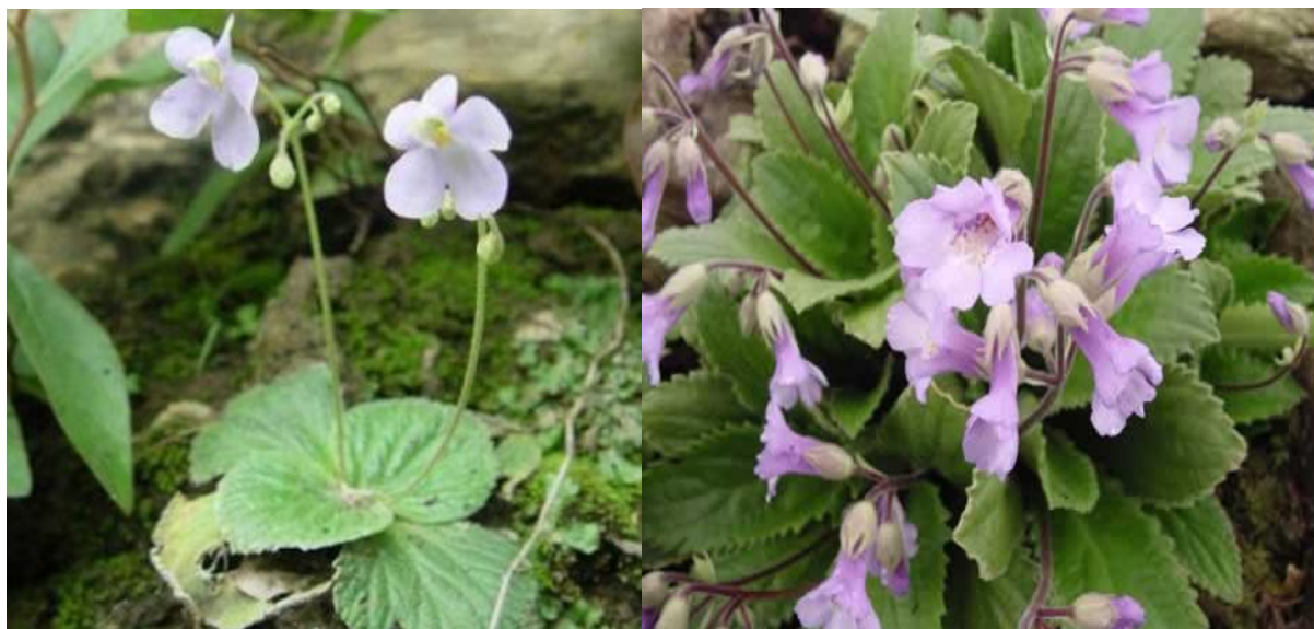
Slika 1. Biljke Boea hygrometrica i Haberlea rhodopensis u prirodnom staništu

Biljke otporne na isušivanje nalaze se u ekološkim nišama s ograničenom dostupnošću vode i nejednolikom raspodjelom padalina tijekom sezone rasta te u tlu sa minimalnom sposobnošću zadržavanja vode. Nalaze se na svim kontinentima preferencijalno na kamenitim ležištima s visokom koncentracijom kalcija na umjerenim nadmorskim visinama u tropskim ili subtropskim zonama (Porembski i Barthlott, 2000).