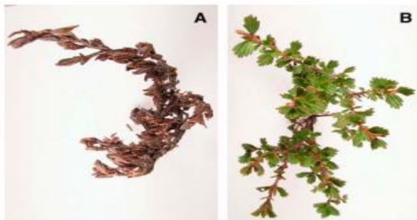
Slika 2. Uskrsnula biljka Myrothamnus flabellifolius u uvjetima nedostatka vode (A) i u uvjetima dovoljne količine vode (B). Slika je preuzeta iz Moore et al. (2006).