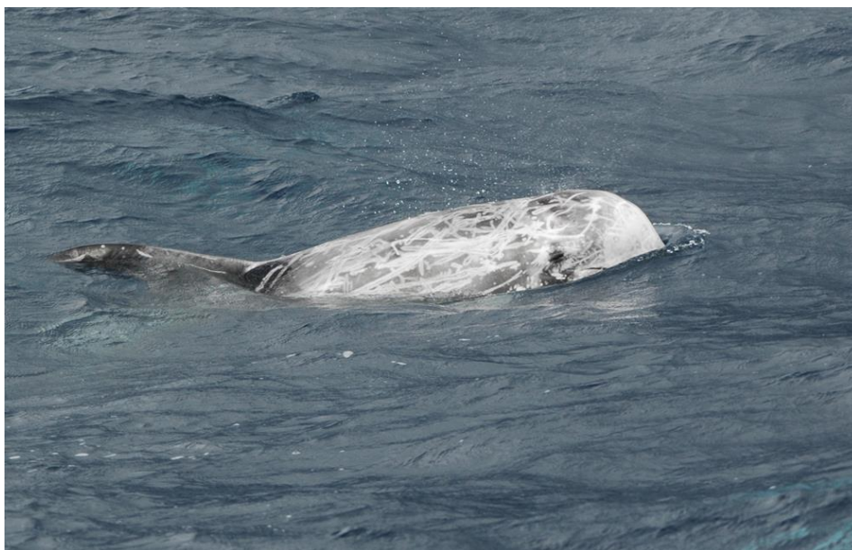
Slika 8. Glavati dupin ( Grampus griseus ).

Glavati dupin ( Grampus griseus ), vrsta kod koje jedinke oba spola narastu do oko 4 m u duljinu, je peti najveći član porodice Delphinidae. Naziva se još i Rissov dupin prema imenu prve osobe (M. Risso) koja ga je opisala francuskom prirodoslovcu Georges Cuvieru 1812. Glavati dupin neobično izgleda iz više razloga. Anteriorni dio tijela im je znatno kršan i sužava se prema repu, a uzimajući u obzir duljinu tijela, imaju jednu od najvećih repnih peraja od svih kitova. Njihova loptasta glava ima uočljiv vertikalni žlijeb ili nabor duž anteriorne površine melona (organ građen od masnog tkiva). Uzorci boje im se mijenjaju s godinama.