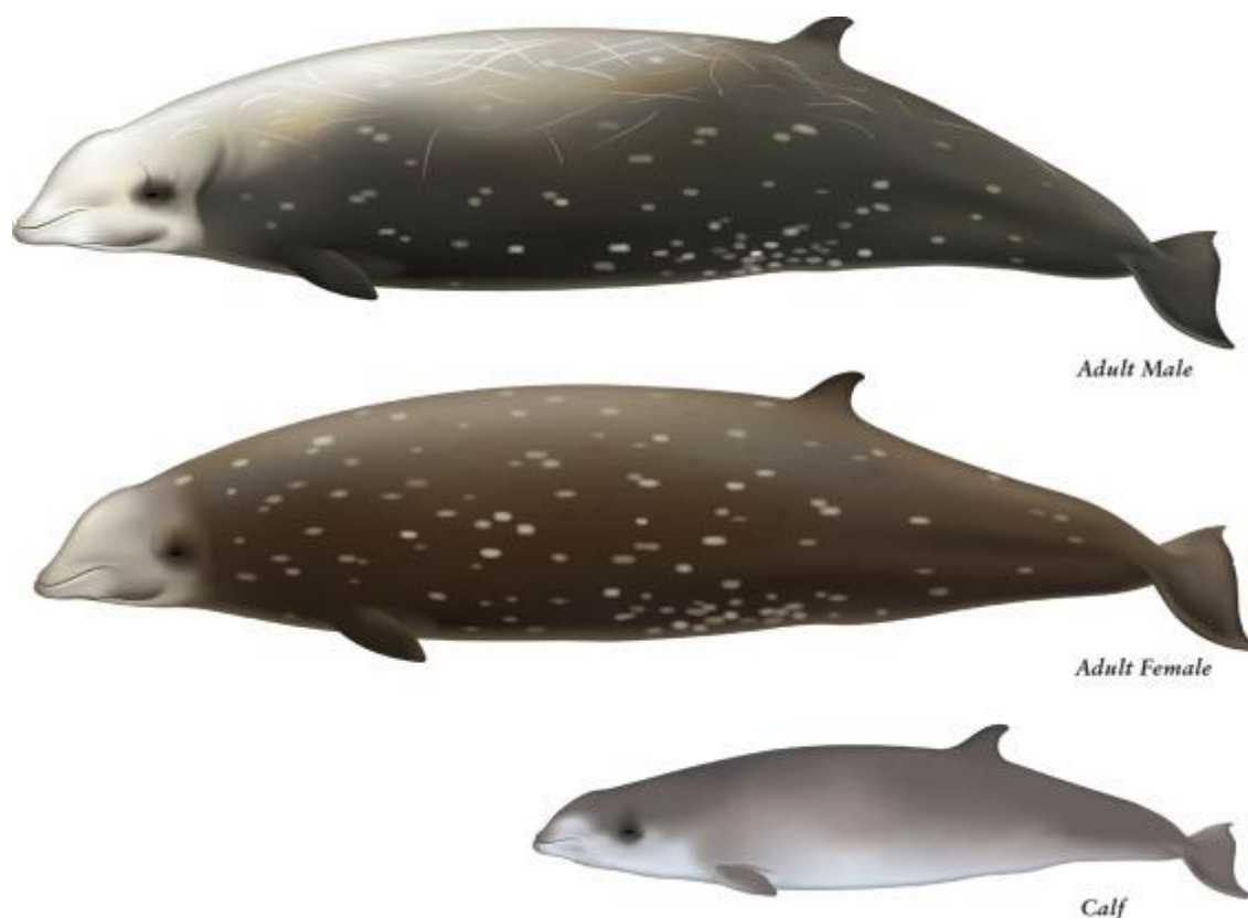
Slika 9. Cuvierov kljunasti kit ( Ziphius cavirostris ).