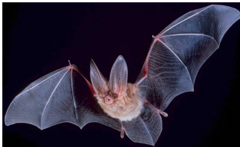
Slika 2. Prikaz predstavnika šišmiša iz podreda Microchiroptera , vrste Corynorhinus townsendii .