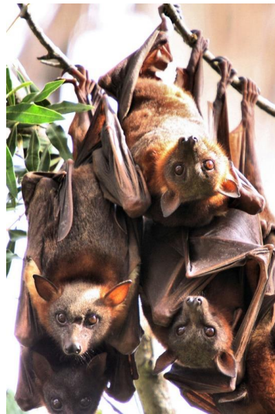
Slika 1. Prikaz kolonije šišmiša, predstavnika podreda Megachiroptera , vrste Pteropus scalatus .

Još nisu promatrane socijalne interakcije kod starijih šišmiša, ali poznato je da se segregiraju na temelju spola. Trudne ženke mogu okupirati specijalna gnijezda unutar kojih hrane mlade i čekaju da se osamostale (Wilson, 2020).