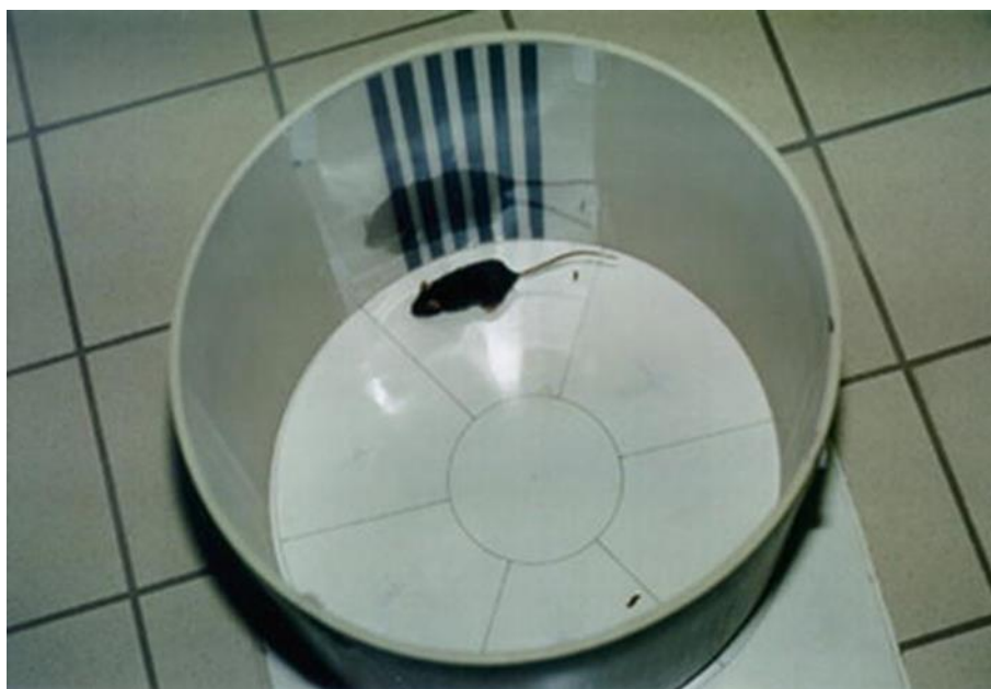
Slika 2. Primjer OF-a okruglog oblika koja se koristi u testu otvorenog polja. Preuzeto iz Belzung (2014).

U drugom primjeru OFT se provodio u OF-u kružnog oblika, a miš je bio životinja čije se ponašanje istraživalo (Slika 2). Dimenzije OF-a su 40 cm u promjeru te 30 cm visine. Pod je podijeljen na središnji kružni dio koji predstavlja centralni dio OF-a te na 6, radijalnim linijama podijeljenih, polja koja čine njegov periferni dio (Belzung 2014).