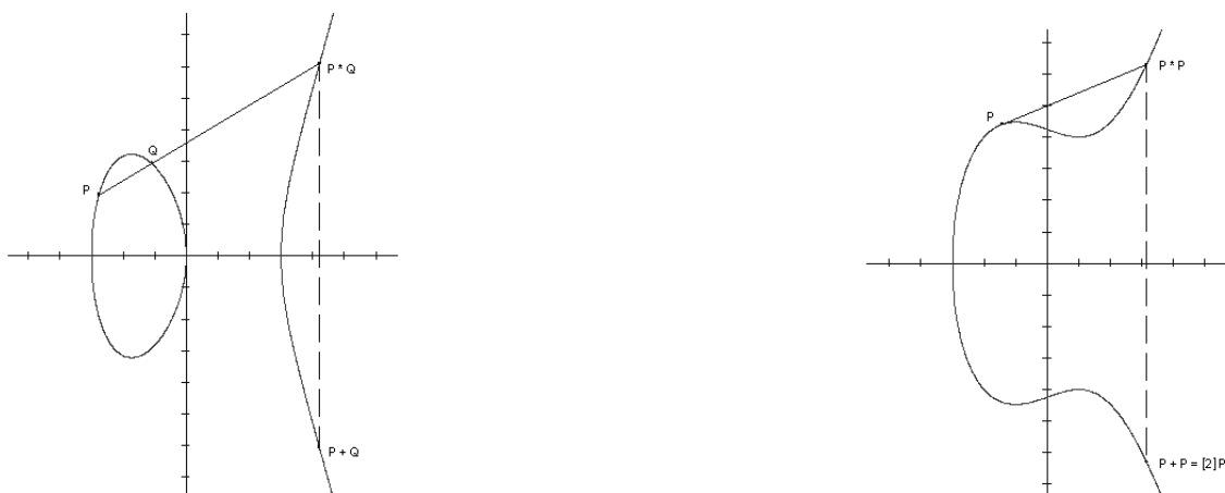
(a) Zbrajanje točaka P, Q na eliptičkoj krivulji