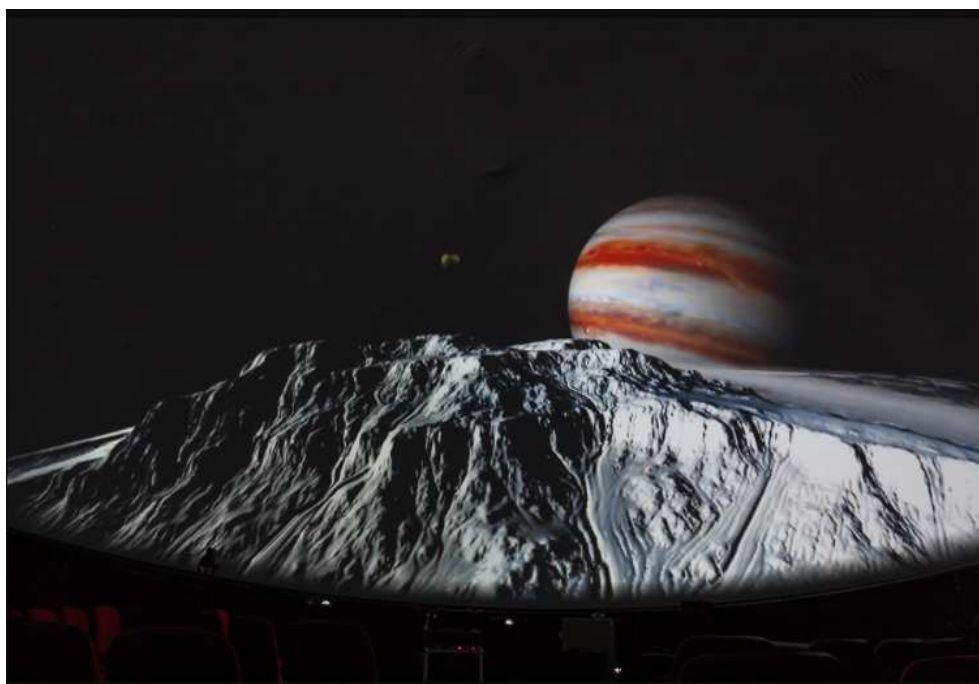
Slika 2.11: Pogled s Europe