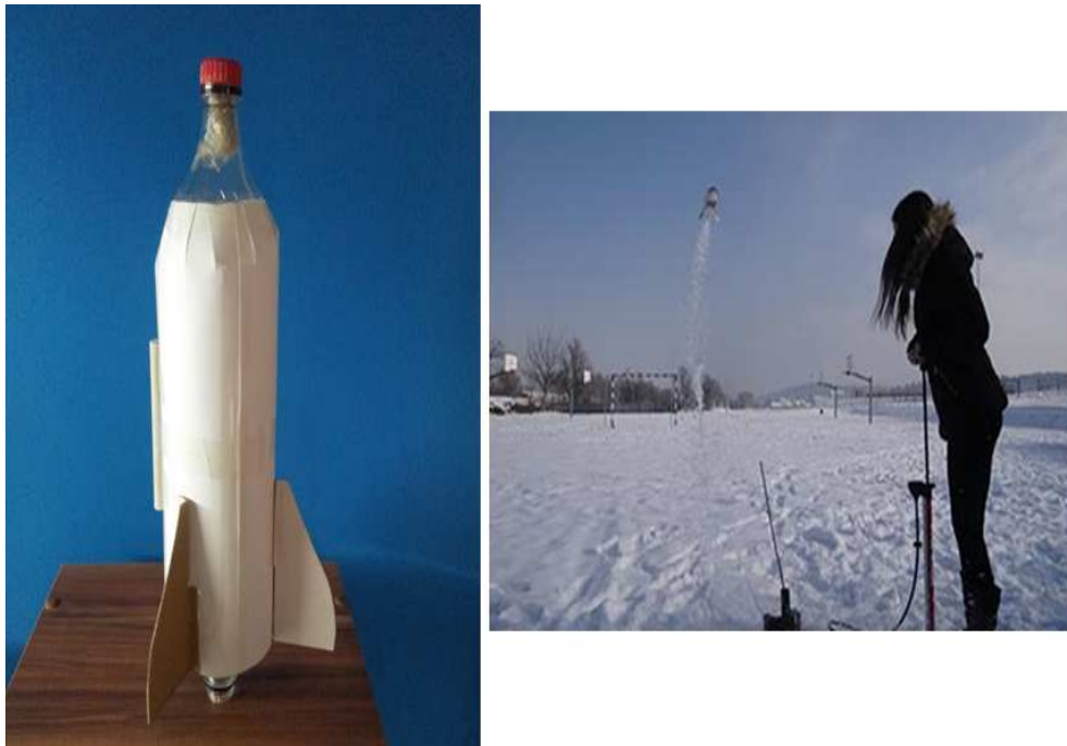
Slika 2.14: Raketa na vodu

za izradu. Za izradu rakete potrebne su dvije plastične boce, karton, ljepljiva traka, kamen i vodilica. Učenici mogu koristiti i drvene bojice te flomastere kako bi ukasili raketu.