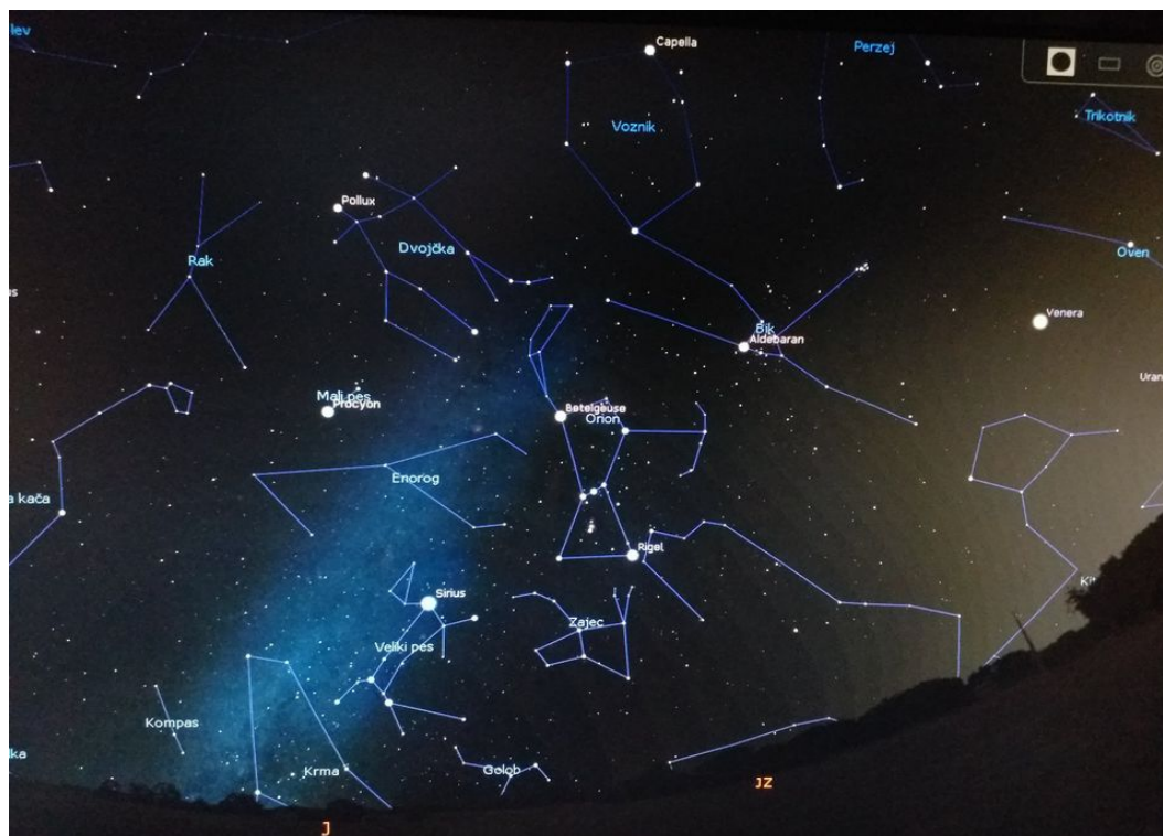
Slika 2.7: Zviježđa

Osim dnevnog, u planetariju je moguće promatrati noćno nebo. Na noćnom nebu vidljive su zvijezde, planeti i galaksije. Zvijezde se mogu povezati u zviježđa. Uz svako zviježđe prikazano je ime zviježđa i slika zviježđa (Slika 2.7). Zviježđa su posebno zanimljiva učenicima prvog i drugog razreda osnovne škole jer se mogu povezati s nekom legendom i zanimljivom pričom iz koje učenici mogu izvući pouku. Također učenici mogu uočiti da se zvijezde unutar zviježđa ne pomiču, odnosno da zviježđa pomicanjem u vremenu zadržavaju svoj oblik, no također mogu uočiti da tijekom godine vidimo različita zviježđa pa se tako mogu promatrati zviježđa zimskog i ljetnog neba. Zbog mogućnosti promijene geografske širine mogu se promatrati južna i sjeverna zviježđa. Svako zviježđe moguće je promatrati posebno.