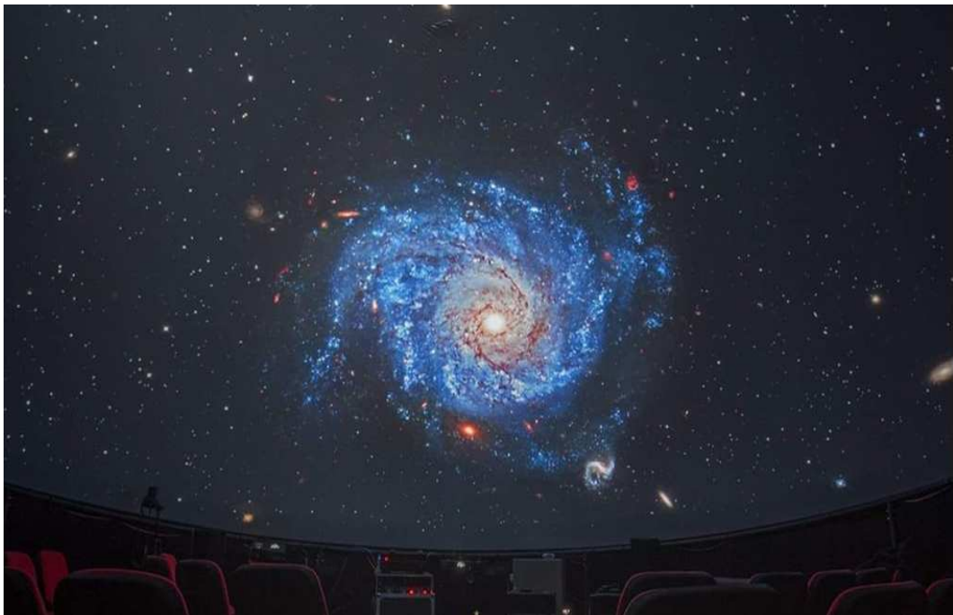
Slika 2.10: Galaksija