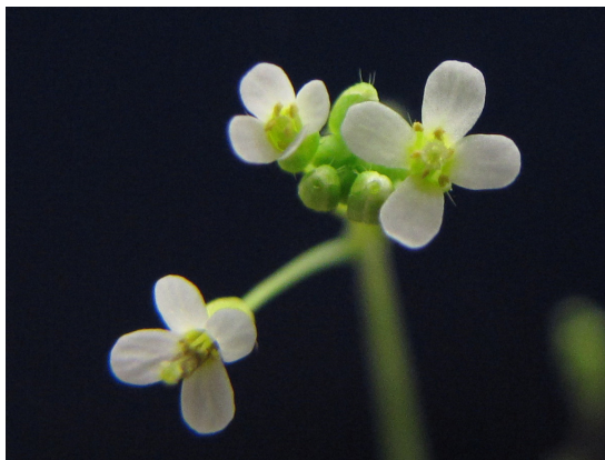
Slika 4.1: Arabidopsis thaliana

Kod svih proteoma korišten je upit FVFGDSLSDA za iterativno pretraživanje proteoma. Taj upit sadrži niz aminokiselina GDSL, koji je tipičan za GDSL lipaze. Smisao