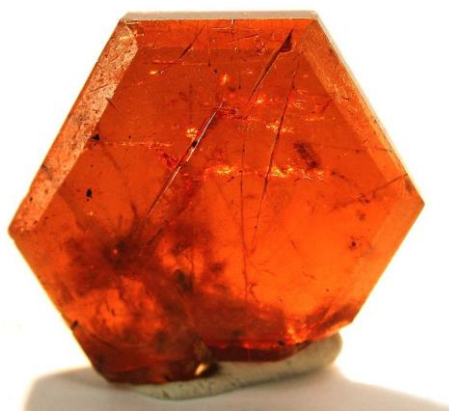
Slika 2. Kristal bastnäsit veličine oko 1,5 cm.

Bastnäsit je mineral koji kristalizira u heksagonskom kristalnom sustavu, voštanožute do crvenkastosmeđe boje, staklastog do masnog sjaja i tvrdoće 4 – 4 ½ (slika 2). Ime je dobio prema tipskom lokalitetu u Švedskoj, rudniku Bastnäs. Spada u nesilikate, razred karbonata, u karbonate s dodatnim anionima (Bermanec, 1999). U kemijskom sastavu mogu dominirati cerij, lantan ili itrij, pa se prema tome razlikuju bastnäsit-(Ce) ((\text{Ce,La})(\text{CO}_3)\text{F}) , bastnäsit-(La) ((\text{La,Ce})(\text{CO}_3)\text{F}) i bastnäsit-(Y) ((\text{Y,Ce})(\text{CO}_3)\text{F}) , što ukazuje da je bastnäsit nositelj lakih elemenata rijetkih zemalja (LREE), umjesto teških elemenata rijetkih zemalja (HREE). Smatra se najvažnijom rudom REE jer je primarni rudni mineral dvaju najvećih svjetskih ležišta REE – karbonatitno ležište Mountain Pass u Kaliforniji i Fe-karbonatitno ležište Bayan Obo u Kini (Walters i sur., 2015).