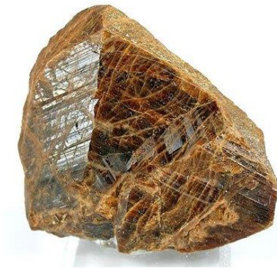
Slika 3. Kristal monacita veličine oko 5 cm.

Monacit je mineral koji kristalizira u monoklinskom kristalnom sustavu, žućkasto, crvenkasto i zelenkasto smeđe boje, dijamantnog do voštanog sjaja (Slika 3). Spada u nesilikate, razred fosfata, u fosfate tipa A(XO 4 ), u grupu monacita (Bermanec, 1999.). Najrašireniji je mineral elemenata rijetkih zemalja. Tvrdoće je 5 – 5 ½ i dosta otporan na trošenje pa ga se zbog toga vrlo često može naći u nanosima rijeka i u pijescima koji su nastali mehaničkim trošenjem granitskih i sijenitskih pegmatita i gnajseva. Najčešće je izvor lakih elemenata rijetkih zemalja (LREE) i važno je naglasiti da u svom sastavu ima i torij (Th) (Walters i sur., 2015). Ovisno o tome koji REE je najzastupljeniji u sastavu, kemijska formula monacita se mijenja: (Ce,La,Nd,Th)PO 4 ako je dominantan cerij (monacit-(Ce)), (La,Ce,Nd)PO 4 ako je dominantan lantan (monacit-(La)) i (Nd,La,Ce)PO 4 ako je dominantan neodimij (monacit-(Nd)). Najveću ekonomsku važnost ima monacit-(Ce).