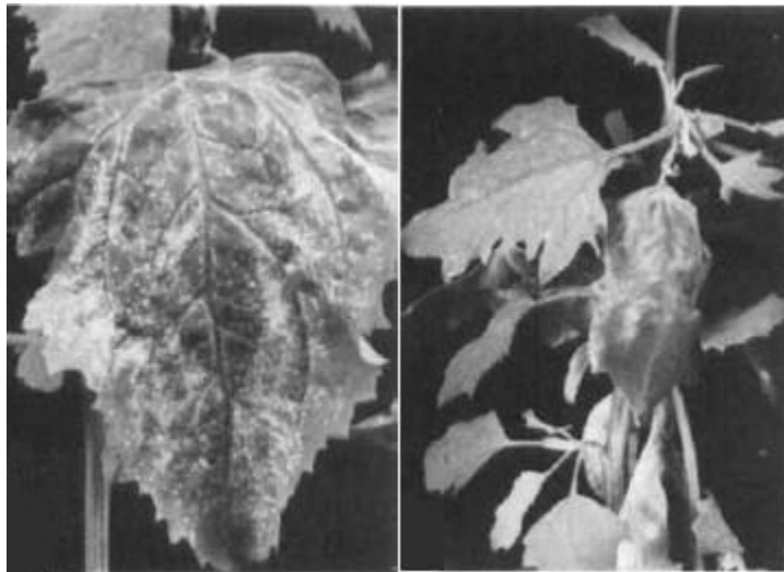
Slika 1. Lokalne lezije prouzročene virusom grmolike kržljavosti rajčice (TBSV, Tomato bushy stunt virus) na Chenopodium amaranticolor (lijevo) i sistemična infekcija na Ch. quinoa (desno). Preuzeto iz Tomlinson i Faithful, 1984.

Na temelju reakcija koje nastanu na pokusnim biljkama (Slika 1.), nastanka i tipa virusnih kristala u stanicama inokuliranih biljaka, elektronsko mikroskopskih i imunoelektronsko mikroskopskih istraživanja ili seroloških pokusa koji slijede, zaključuje se koji su virusi bili prisutni u sakupljenim uzorcima.