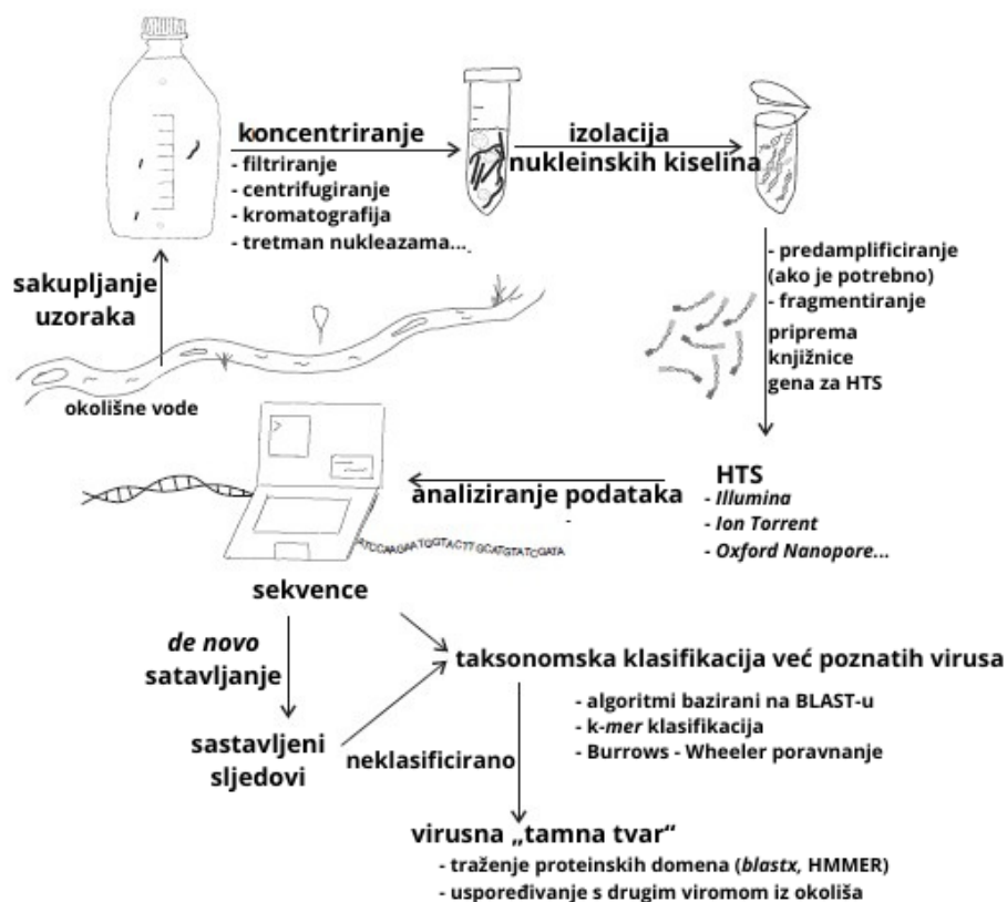
Slika 4. Prikaz slijeda korištenja današnjih metoda u istraživanju virusa u vodenim uzorcima. Prilagođeno iz Mehle i sur., 2018.

Iako su opisane „nove“ metode općeprihvaćene metode za detekciju virusa u uzorcima vode, one „stare“ nisu pale u zaborav. Bačnik i suradnici (2020) su sve uzorke otpadnih voda podvrgnuli elektronskoj mikroskopiji. Osim toga, inokulirali su odabrane biljke nasumičnim uzorcima otpadnih voda pa su i one listove koji su razvile određene simptome iskoristili za pripremu uzoraka koje su promatrali pod elektronskim mikroskopom. Ovo pokazuje kako metode kojima su se koristili znanstvenici u prvim istraživanjima biljnih virusa u vodenim okruženjima nisu danas zaboravljene ni beskorisne, već se koriste kao komplementarne, odnosno kao dodatan korak provjere rezultata.