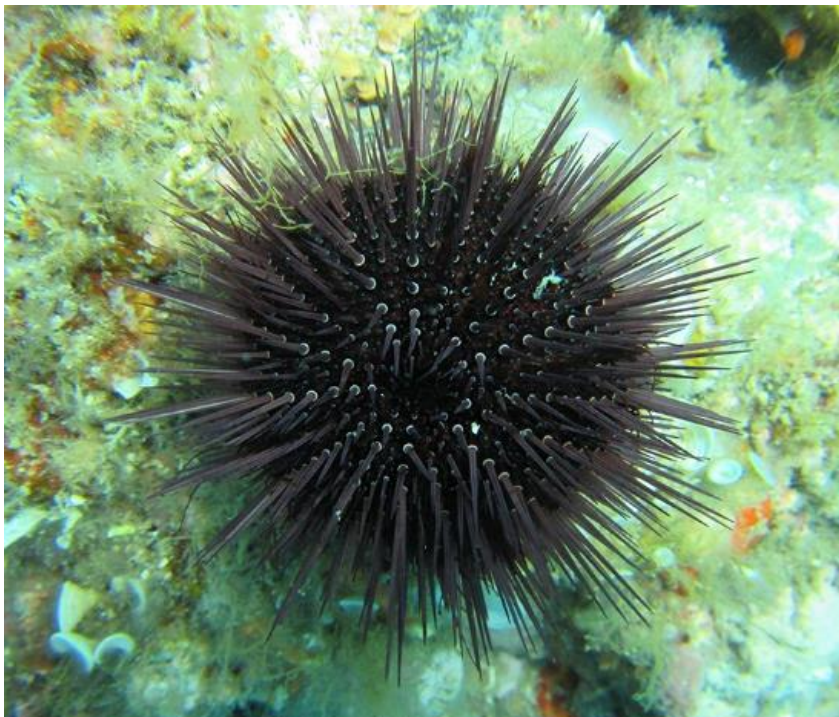
Slika 3. Paracentrotus lividus

Hridinski morski ježinac Paracentrotus lividus uglavnom se javlja na čvrstim stijenama ili u livadama morske trave Posidonia oceanica i Zostera marina . Raspon boja je varijabilan, od crno-ljubičaste, ljubičaste, crveno-smeđe, tamno smeđe, žuto-smeđe do maslinasto zelene boje, te nije povezan s dubinom ili veličinom jedinke. Ova vrsta često obitava na obalnim zidovima gdje pronalazi udubine u koje se može sakriti, te koje pomoću svojih zubića dodatno oblikuje. Velika dostupnost skloništa za mlade jedinke može im omogućiti da pobjegnu predatorima. Do denudacije podloge može doći kao posljedica ljudske aktivnosti, kada krivolovci lome kamenje kako bi ilegalno sakupljali prstace Lithophaga lithophaga . Hridinski morski ježinci uglavnom su aktivni noću kako bi izbjegli veći pritisak predatora. U Mediteranu im glavne predatore čine ribe šarag Diplodus sargus , fratar Diplodus vulgaris , rakovi Maja crispata i puž Hexaplex trunculus . (Boudouresque i Verlaque, 2013).