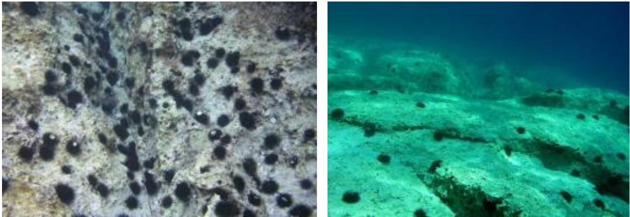
Slika 1. i 2. Primjeri golobrsta uzrokovanog hranjenjem ježinaca

Ježinci stvaraju velike probleme šumama kelpa, podvodnom sustavu algi koji se smatra najdinamičnijim primjerom biološke raznolikosti i svrstava se među najproduktivnije zajednice umjerenih mora na svijetu. Visoka produktivnost i velika biomasa kelpa i drugih makro algi podržavaju velik broj riba i beskralježnjaka, koji alge koriste kao izvor hrane i kao stanište. (Scheibling i sur., 1999).