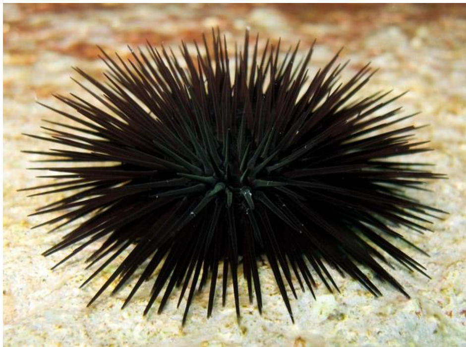
Slika 4. Arbacia lixula

Crni morski ježinac mrijesti se tijekom cijele godine, ali doseže vrhunac u ljetnim mjesecima. Spolnu zrelost doseže kada promjer jedinke dosegne raspon od 9 i 14 mm. (Gianguzza i Bonaviri, 2013)