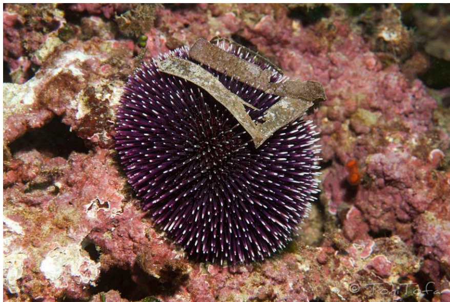
Slika 5. Sphaerechinus granularis

Pjegavi morski ježinac ( Sphaerechinus granularis ) karakterističnog je izgleda te se razlikuje od prethodne dvije vrste nešto većom čahurom, koja može doseći i do 12 cm. Bodlje su mu kratke, jednake dužine i tupe. Mogu biti ljubičaste kao i ostatak ježinca, a vrlo često imaju bijele vrhove ili su čak potpuno bijele. [L3]