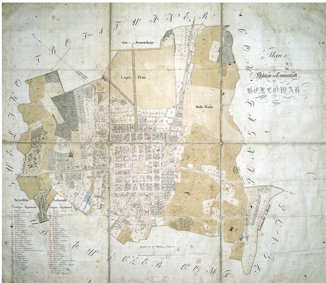
Sl. 2. Plan grada iz 1828. godine

blokovskih jedinica i očituje se povećanjem gustoće i usitnjavanjem parcela. Zbog potrebe za javnim i stambenim objektima, prostori koji su do tada bili isključivo vojne funkcije se napuštaju i sele na periferiju grada, a svoje mjesto ustupaju za gradnju stambenih i javnih objekata. Izgrađena je gradska vijećnica pored crkve sv. Terezije, dok su gradska čitaonica i bolnica građene izvan same jezgre grada što upućuje na buduće smjerove širenja (Drveni, 2014.). Izgrađuju se sjeverni i južni dijelovi grada te se uređuju šetnice sadnjom drveća. Osnivaju se novi predjeli u udaljenijim zonama grada kao što su Švajcarija te naselje Čeha koje je kasnije bilo poznato po imenu Mlinovec. Stanovništvo se počinje baviti agrarnom proizvodnjom koja se odvijala na svim većim površinama koje nisu bile vojne (Slukan – Altić, 2007.).