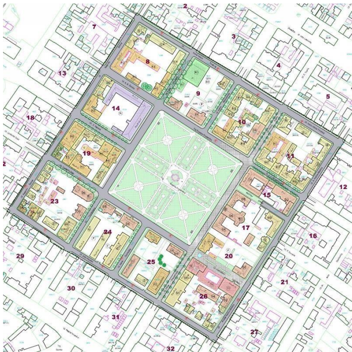
Sl.3. Urbanistički plan grada Bjelovara