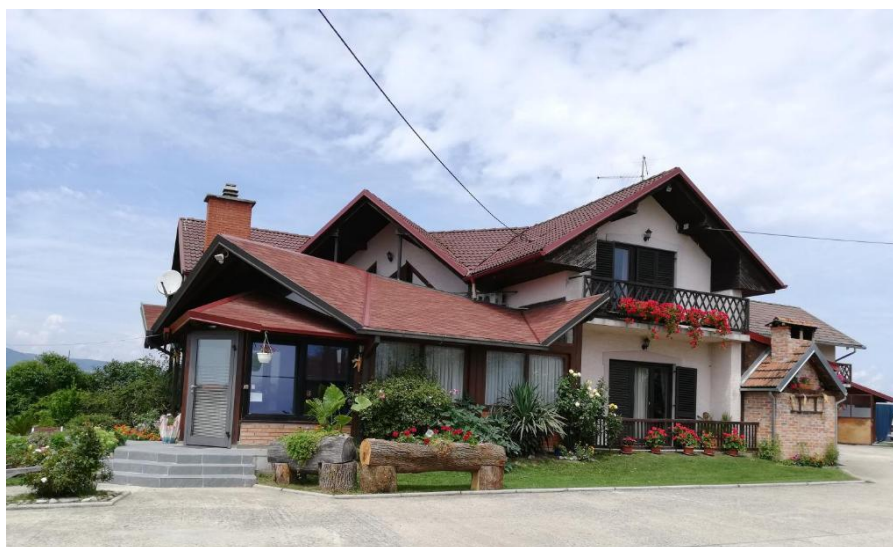
Sl. 7. Primjer objekta u ruralnom turizmu u Središnjoj Hrvatskoj - TSG Šimanović u Klinča Selima

Čipke, Mlin na Muri i Mlinarov poučni put u Žabniku, Etnografsku zbirku Bakina hiža i dedekov dvor u Ludbregu, Žumberački uskočki muzej, Kuriju Medven iz 1868. i mlin u Krašiću te velik broj vinskih cesta (HGK, 2015). Prema nacionalnom katalogu Ruralni turizam Hrvatske (2015), na području središnje Hrvatske nalazi se 114 objekata ruralnog turizma. Njih 60 pripada kategoriji objekti sa smještajnim kapacitetom i prehranom, dok ostatak, njih 54 pripada kategoriji objekti izletišta, kušaonice, vinotočja za jednodnevni i poludnevni boravak. Premda su objekti relativno ravnomjerno raspoređeni po regiji, primjetna je neznatno veća gustoća na samom sjeveru, u Međimurju te u zapadnom dijelu regije podno Žumberačkog gorja. Velik broj objekata može se pohvaliti bogatim sadržajem. Jedan od takvih je i Turističko seljačko gospodarstvo Šimanović u Klinča Selima (sl. 7.). Sadržaj Turističkog seljačkog gospodarstva Šimanović uključuje vinogradarstvo, proizvodnju domaćih likera i marmelada, proizvodnju suhomesnatih proizvoda, aktivan stari zanat, etnografsku zbirku, kulinarske prezentacije i radionice, prezentaciju starih običaja i vještina, lov i ribolov, vožnju kočijom/zapregom, planinarenje, promatranje ptica, igralište/sportski teren i ostalo (HGK, 2015).