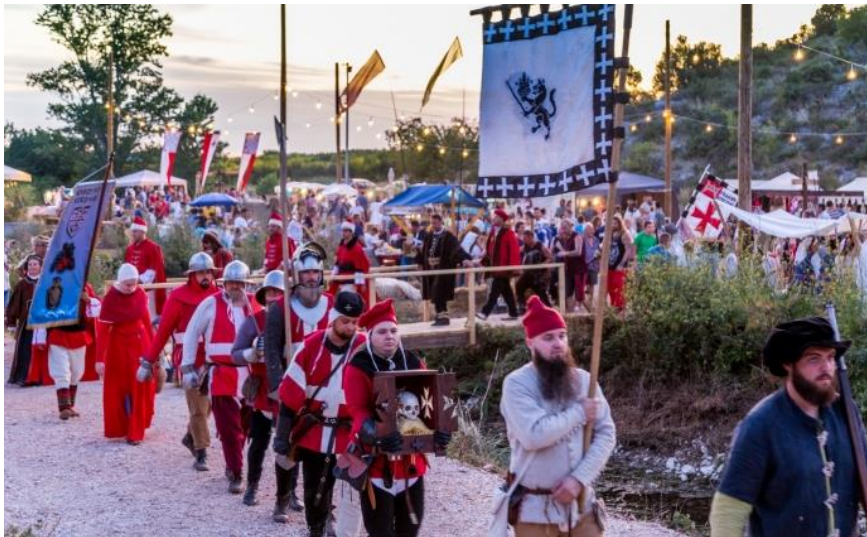
Sl. 5. Primjer kulturne manifestacije u Južnom hrvatskom primorju – Dani Vitezova vranskih u Vrani

Etnozanimljivosti koje nudi zadarska regija su Manastir Krupa kod izvora rijeke Krupe u okolici Obrovca, Kula Jankovića obitelji Desnica u Islamu Grčkom, Ranč magaraca Dar-mar kod Nina, Priča o paškom siru – kušaonica sira sirane Gligora te Etnografska zbirka Kolan na Pagu i ostale (HGK, 2015). Na području zadarske regije se prema nacionalnom katalogu Ruralni turizam Hrvatske (2015) nalazi 7 objekata seoskog turizma, od čega je 5 objekata sa smještajnim kapacitetom. Svaki od njih obiluje raznolikim sadržajem, a po najvećem broju se izdvaja Seosko gospodarstvo Mićanovi dvori u okolici Obrovca. Mićanovi dvori pored smještaja i prehrane u svojoj ponudi sadrže poljoprivredne aktivnosti na gospodarstvu, lov, ribolov, pješčenje/trekking i planinarenje, promatranje ptica, vožnju terenskim vozilima, vožnju plovilima, boćanje, kupanje u bazenu, korištenje sportskih terena i ostalo (HGK, 2015).