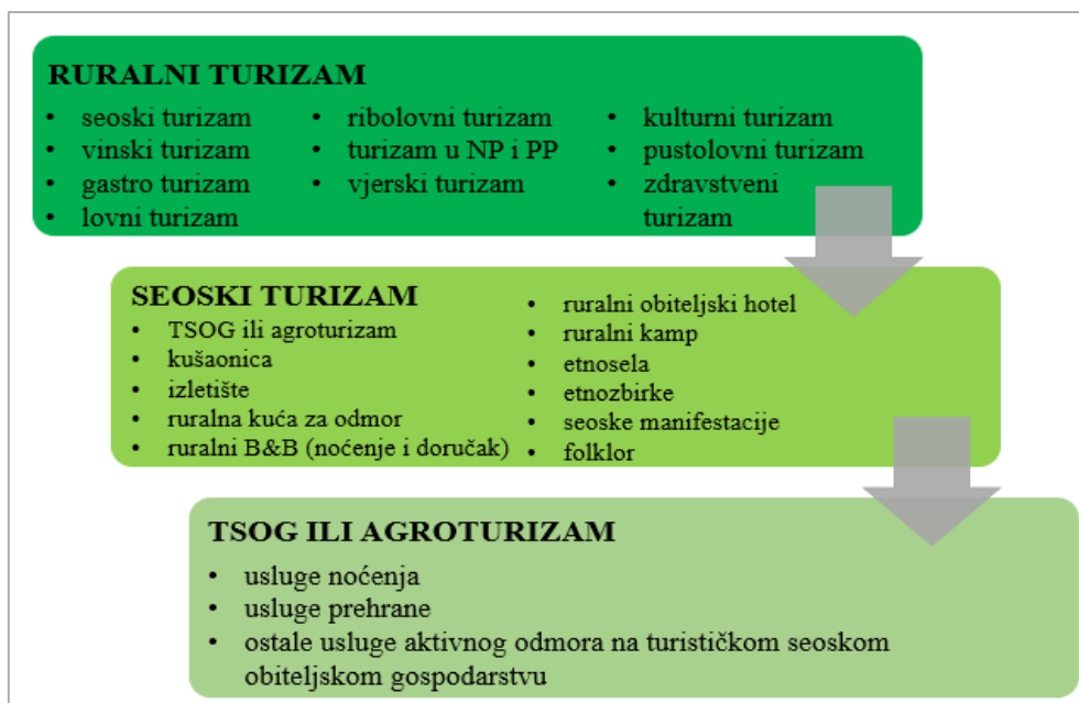
Sl. 1. Shematski prikaz međuodnosa ruralnog, seoskog i agroturizma