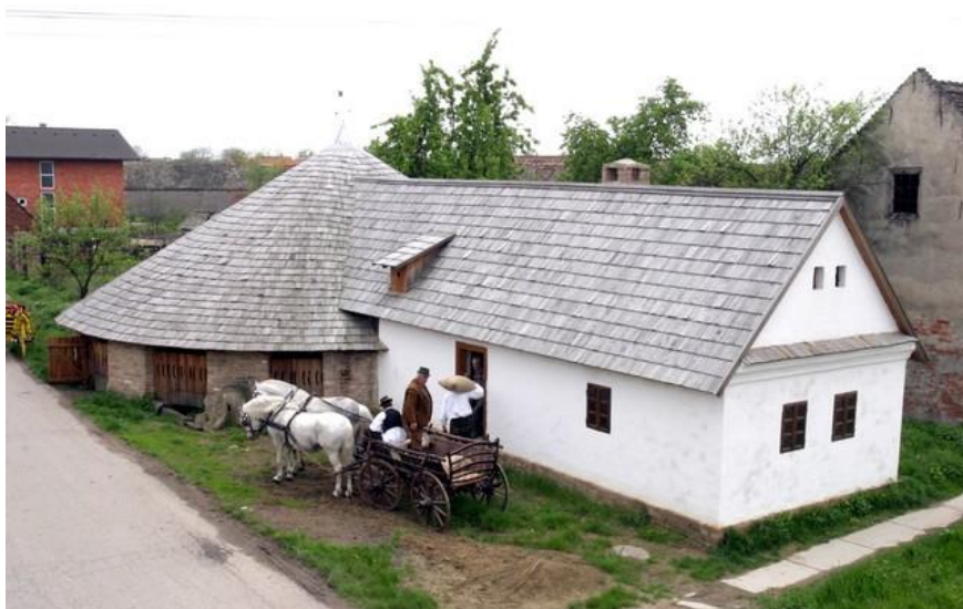
Sl. 8. Primjer etnozanimljivosti u Istočnoj Hrvatskoj – Suvara u Otoku