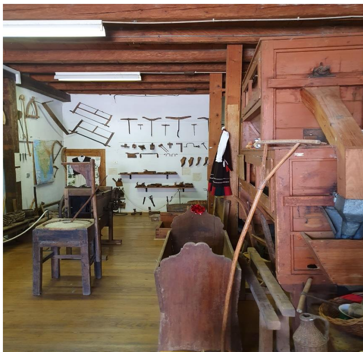
Sl. 4. Primjer etnozanimljivosti u Sjevernom hrvatskom primorju – Etno muzej Vittorio Rossoni u Kašteliru