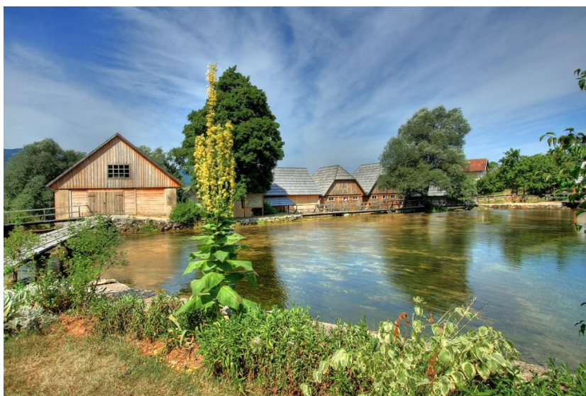
Sl. 6. Primjer etnozanimljivosti u Gorskoj Hrvatskoj – Mlinice na rijeci Gackoj

Korana u Plitvičkim jezerima, Mlinice na rijeci Gackoj kraj Majerova Vrila (sl. 6.), Etnografski postav Muzeja Gacke u Otočcu, Rodna kuća dr. Ante Starčevića u okolici Gospića i mnoge druge. Od kulturnih manifestacija izdvajaju se Jesen u Lici – festival običaja i hrane, Antonja u Krasnu, Lička olimpijada, Biciklijada Uspon na Zavižan i druge (HGK, 2015). U nacionalnom katalogu Ruralni turizam Hrvatske (2015) za područje Like predstavljena su 3 objekta sa smještajnim kapacitetom i prehranom. Po sadržajnosti se izdvaja Izletišta Butina u Kuterevu čija ponuda uključuje proizvodnju sira, uzgoj domaćih životinja, aktivni stari zanat, poljoprivredne aktivnosti na gospodarstvu, prezentaciju starih običaja i vještina, branje gljiva i drugih šumskih plodova, biciklizam, planinarenje, pješaćenje/trekking i ostalo (HGK, 2015).