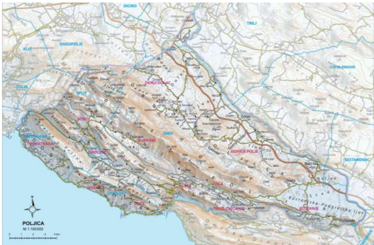
Sl. 7. Geografska karta Poljica

hidroelektrana na rijeci Cetini. Pad broja stanovnika zabilježen je na sljedećem popisu stanovništva iz 1971. godine kada je popisano oko 14 200 stanovnika na ovom prostoru, manje u odnosu na 1961., ali ipak značajno više nego 1953. godine. Od 1991. godine pa sve do danas prisutan je pozitivan demografski trend na području Poljica, odnosno rast stanovništva usprkos stradanjima u Domovinskom ratu (tab. 1). No, važno je napomenuti da je taj rast u većini dijelova Poljica neravnomjeran. Prema popisu stanovništva iz 2011. godine na prostoru Poljica živi oko 22 000 ljudi od kojih 2/3 stanovnika živi na prostoru Donjih Poljica koja su se ubrzano izgradila zbog bolje prometne povezanosti s gradskim središtima te zbog apartmanizacije i turističke privlačnosti. Podstrana, naselje u Donjim Poljicima, 2011. godine je naselje s najviše stanovnika na istraživanom prostoru. Područja Gornjih Poljica zahvatili su procesi deruralizacije, depopulacije te je gospodarski zanemareno, s izrazito starim stanovništvom. Prostor Srednjih Poljica brojem stanovnika stagnira već od kraja Drugog svjetskog rata te u posljednje vrijeme postaje bitan prostor u turističkim i gospodarskim djelatnostima zbog čega bi u budućnosti mogao bilježiti pozitivne demografske trendove.