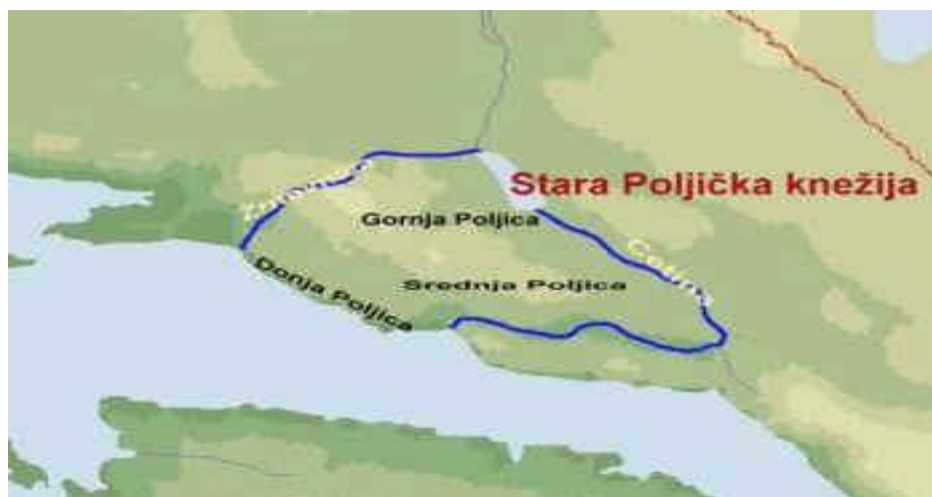
Sl. 2. Prostorna polarizacija Poljica

Donja ili Primorska Poljica smjestila su se u obalnom pojas između ušća dviju rijeka, Žrnovnice i Cetine, te su od ostatka Poljica odvojene dvjema liticama, Perun i Mošnjica. Kroz povijest stanovnici tog prostora gravitirali su prema Srednjim Poljicima, a iako su imali pristup moru, zbog potencijalnih opasnosti s mora, stanovnici tog prostora nisu razvijali skoro nikakve pomorske djelatnosti. U suvremenom razdoblju zbog razvoja turizma i pomorskih djelatnosti tu se razvijaju najveća naselja u Poljicima poput naselja Dugi Rat (3439 stan.), Jesenice (2082 stan.), Duće (1563 stan.).