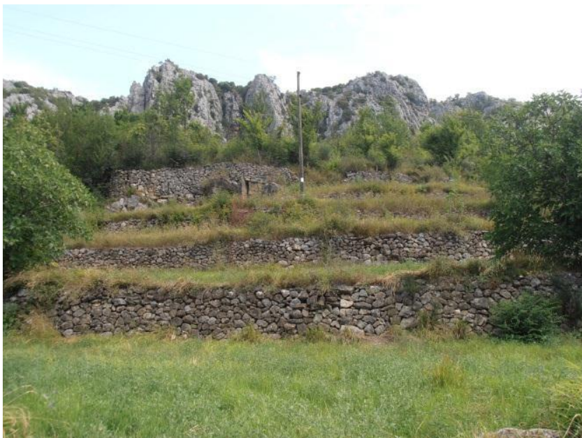
Sl. 9. Zapuštene poljoprivredne površine u Srijanima (Gornja Poljica)