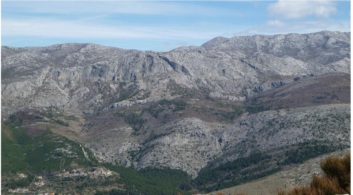
Sl. 4. Degradirana vegetacija i kamenjar na planini Mosor