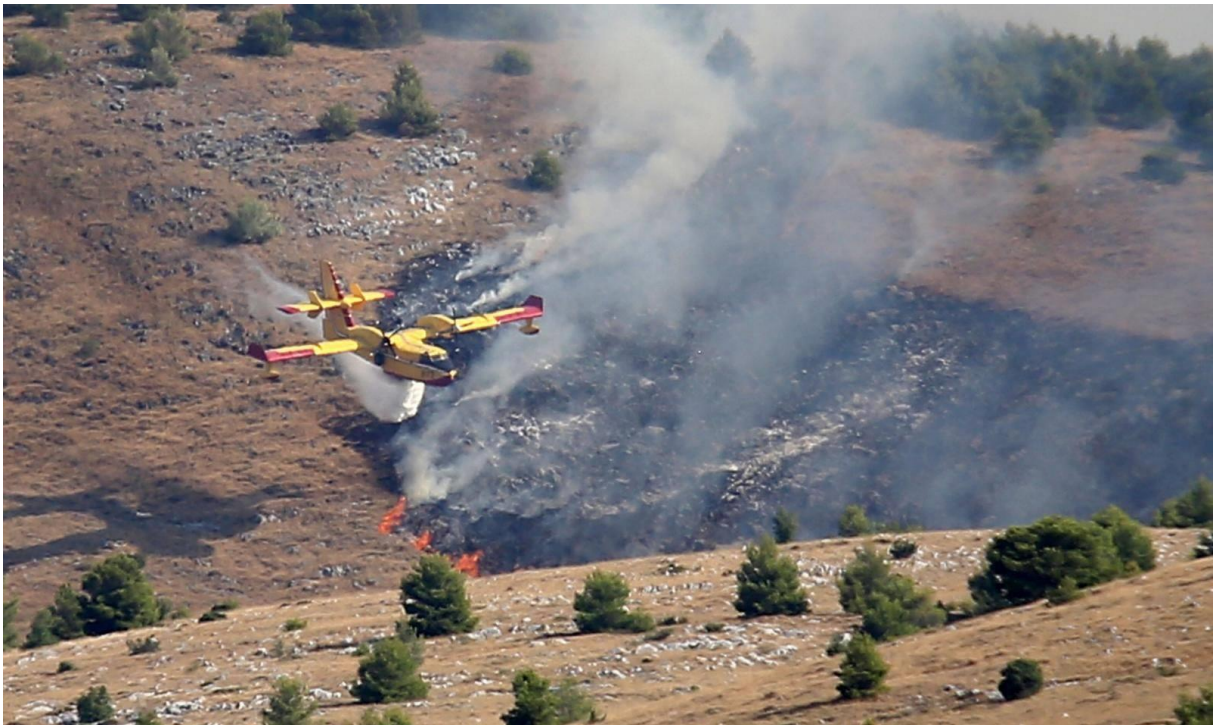
Sl. 3. Gašenje požara na nepristupačnom terenu u Poljicima

U obalnim i zamosorskim područjima raširena je karakteristična mediteranska flora koja je prilagođena čestim sušnim razdobljima u godini. Vrsta biljnog pokrova ovisi o nadmorskoj visini određenog područja. Na nižim područjima Poljica i obroncima planine Mosor rasprostranjeno je nisko grmoliko bilje poput brniste te vazdazelenog alepskog bora. Rastom nadmorske visine nailazimo na područja bjelogorice i hrasta medunca koji se zbog stoljeća eksploatacija posebice za izgradnju i ogrjev degradirao u karakteristična područja makije ili šikare te dalje u jedinke graba ili gariga. U posljednje vrijeme polagano se obnavlja flora na obroncima Mosora ponajprije zbog manje eksploatacije i znatno slabije ispaše stoke u odnosu na prethodna stoljeća. Područja s većom nadmorskom visinom pokrivena su hrastom meduncom, grabom i crnim jasenom. Iako to područje zbog nepristupačnosti terena nije bilo znatno eksploatirano kroz povijest, zbog učestalih požara u posljednjih nekoliko desetljeća dodatno je reducirano te praktički u većini dijelova Poljica čini kamenjar (sl. 4 i 5).