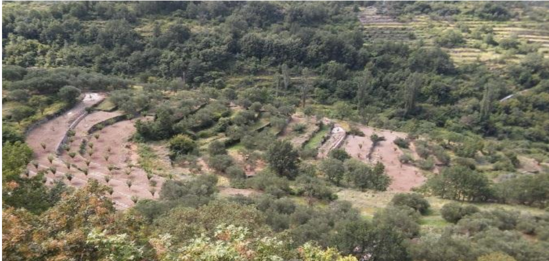
Sl. 8. Terasna polja tzv. meja na području Podgrađa (Srednja Poljica)