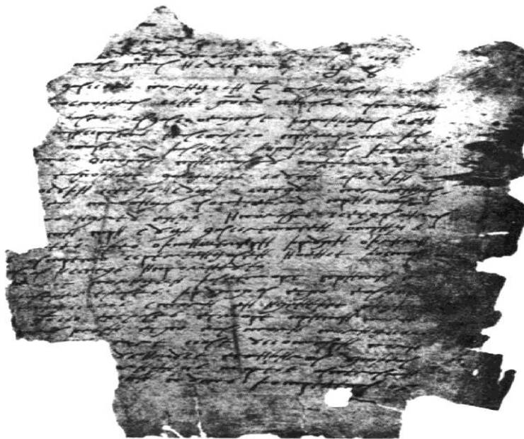
Prva stranica Poljičkog statuta iz 1440.

veze sa domaćinstvima te se na njih često s prijezirom gledalo. Prema F. Ivaniševiću (2006), Poljica su imala šesnaest sela s obzirom na broj župnika, a dvadeset s obzirom na broj seoskih starješina, jer su neke župe imale dva i tri seoska glavara. Danas imaju dvadeset i jedno naselje. Teritorijalno su Poljica sačinjavala jedinstveno područje u gospodarskom i političkom pogledu, podijeljeno na dvanaest naselja zvanih katuni. Svaki „katun“ je imao svog starješinu (kneza) koji je tijekom godine bio izabran od strane plemstva u pojedinom katunu. Tih dvanaest starješina je na dan sv. Jure (23. travnja) na tzv. „zboru“ između sebe biralo vrhovnog poljičkog kneza (Erber, 2010). Zbor se sastojao od starješina, svih plemićkih obitelji u Poljicima te običnog puka koji je imao ulogu svjedoka. Od ostalih starješina birani su vojvoda, suci i prokurator. Oni su činili svojevrsnu vladu Poljica, poznatu pod nazivom „Stol“. Poljički knez imao je diktatorske ovlasti koje su mu bile na raspolaganju samo godinu dana te je na kraju godine morao odgovarati ispred poljičkih sudaca za moguća zlodjela ili korištenja vlasti za osobnu korist. Jedna osoba mogla je više puta biti knez te nije postojao limit na broj mandata. Povijest Poljičke kneževine počinje sastavljanjem pravno-zakonskog akta Poljičkog statuta 1440. godine (sl. 6) u kojem su po prvi puta određene granice Poljica kao i oblik uprave Poljica prema kojemu su uređena kao kneževina.