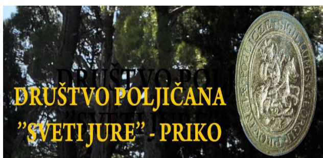
Sl. 17. Udruga sv. Jure Priko