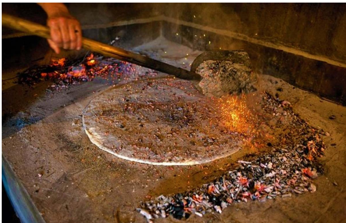
Sl. 13. Tradicionalan način pečenja soparnika lugom i sitnim žarom (vinove loze)

beskvasnog tijesta s blitvom, bijelim lukom, maslinovim uljem i češnjakom. Te namirnice su i kroz 20. stoljeće bile najzastupljenije u trgovini Poljičana upravo zbog klimatskih faktora koji im je omogućavao po nekoliko berbi godišnje tih namirnica, poglavito češnjaka po kojem su Poljica posebno Gornja bila poznata po velikoj i kvalitetnoj proizvodnji. Danas je to vrsta jela koja se „probila na šire domaće tržište te danas to jelo možete naručiti u većini restorana na obalnom pojasu smještenom između Omiša i Makarske. Zašto je to jelo važno za identitet Poljica? Iz istog razloga zašto je sir parmezan važan za grad Parmu. A to je način izrade koji je ostao više-manje isti kroz stoljeća njegovog postojanja, upotreba lokalnih namirnica koji pomažu domaćim proizvođačima te prestiž jer navodno jedino dobar soparnik je onaj kojeg napravi Poljičanin ili netko porijeklom iz Poljica. Također je to jelo svojevrsni sinonim mlađim generacijama za prostor Poljica i njenu povijest. Iako možda ne znaju za Poljica, sigurno su jeli ili čuli za poljički soparnik.