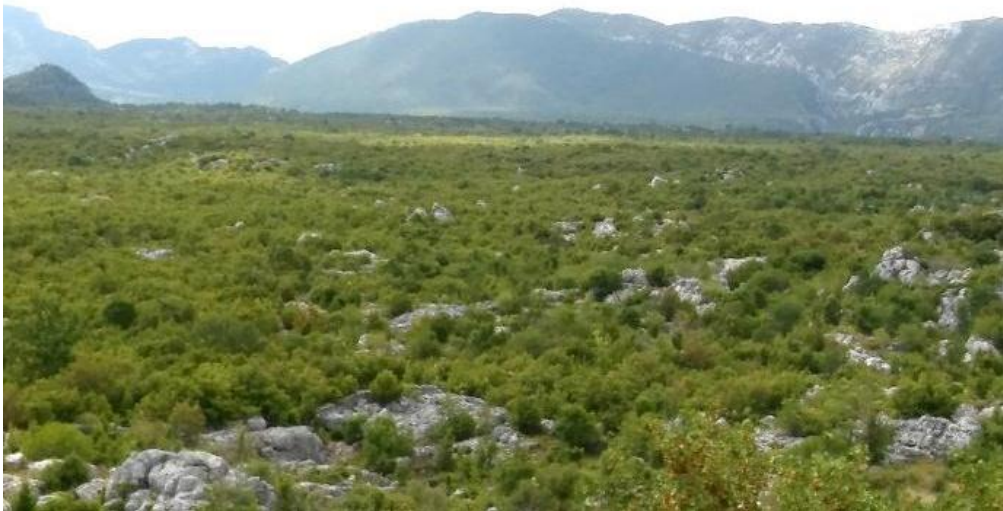
Sl. 5. Kamenjar i nisko raslinje u Kostanjama (Srednja Poljica)