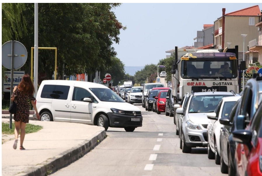
Sl. 12. Prometna gužva u oba smjera u Dućama (Donja Poljica)