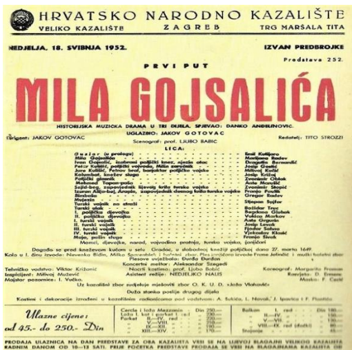
Sl. 15. Plakat za povijesno-glazbenu dramu „Mila Gojsalić“ Jakova Gotovca

Osim poljičkog statuta i drugih pravnih dokumenata Poljičani nisu imali razvijenu tradiciju zapisivanja legendi, mitova i priča. Svaka legenda očuvana je od zaborava usmenom predajom.