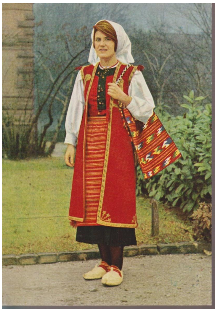
Sl. 16. Narodna nošnja iz Poljica

Na taj način svakom novom generacijom Poljičana priče su dodatno nadopunjivane, po potrebi u manjoj mjeri mijenjane kako bi poslužile potrebnom narativu. Kroz ljudsku povijest, pa tako i povijest Poljica postojali su razni procesi što prirodni što antropogeni koje nije bilo moguće u to vrijeme jednostavno objasniti što je rezultiralo da ljudi tome pridaju neke nadnaravne sklonosti. Mitologija, junaštvo, gastronomija te privrženost geografskom prostoru i njegovanje tradicija i običaja koji su usko povezani s prirodnom osnovom kao i određen oblik državnosti Poljica za rezultat su imali stvaranje posebnog oblika identiteta domaćeg stanovništva. U širem geografskom i priobalnom području ne možemo naići ni na jednu takvu kompaktnu cjelinu koja je barem u nematerijalnom smislu preživjela dugi niz stoljeća.