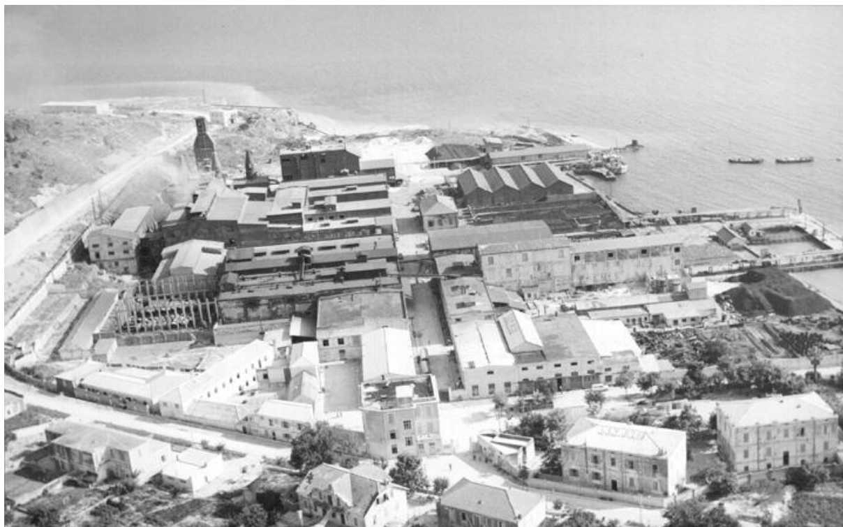
Sl. 10. Tvornica karbida i ferolegura Dalmacija – Dugi Rat (Donja Poljica 1908.-1998.)

Sredinom 1990-ih godina prošlog stoljeća dolazi do ubrzanog propadanja industrije na području Donjih Poljica (sl. 10). Uzroci su brojni i kompleksni. Jedan od uzroka su ratna zbivanja zbog kojih tvornice nisu mogle na vrijeme dobiti potrebnu sirovinu za preradu, drugi koruptivne djelatnosti koje su se događale prilikom privatizacije pojedinih industrijskih kompleksa, a treći uzrok je predratna nerentabilnost tvornica koje su zapošljavale puno veći broj radnika nego što je bilo potrebno. Razvojem turizma na području Donjih Poljica dolazi do ubrzane apartmanizacije ovog područja (sl. 11). Turizam je ekološki prihvatljivija i mnogo profitabilnija ekonomska aktivnost od industrije.