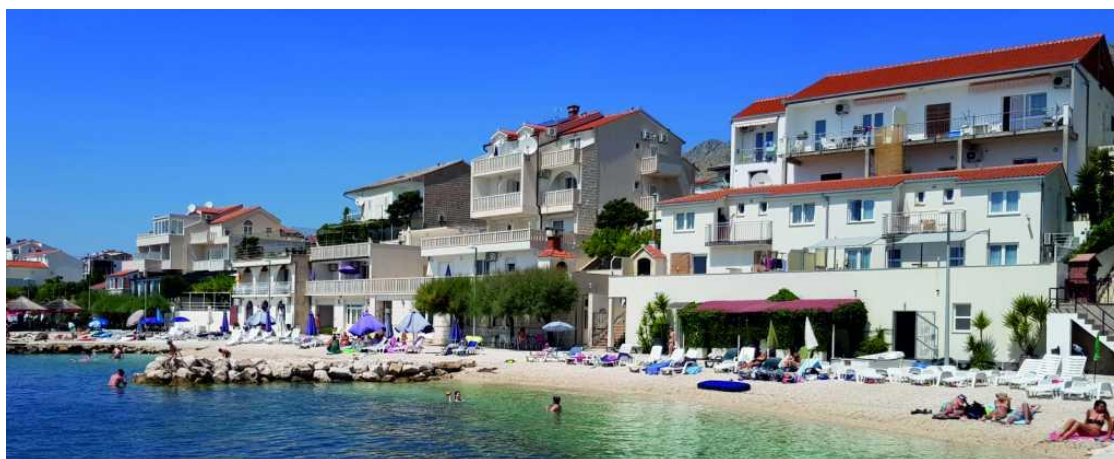
Sl. 11. Primjer apartmanizacije u Podstrani (Donja Poljica)

Ubrzanim razvojem turizma u Donjim Poljicima događa se svojevrsni „boom“ u izgradnji smještajnih kapaciteta, često neplanskih i bez uključenosti lokalnih vlasti što je dovelo do nepravilne i estetski nehomogene izgradnje pojedinih objekata. Zbog takvih procesa Jadranska magistrala postala je prometno prezasićena posebice za vrijeme ljetne turističke sezone (sl. 12). Po gužvama se izdvajao potez od Splita prema Omišu i obrnuto.