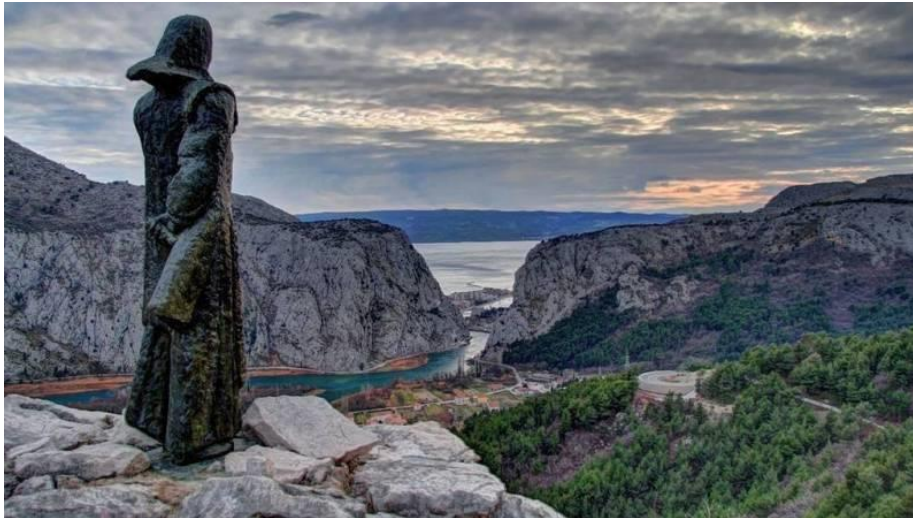
Sl. 14. Statua Mile Gojsalić kod Gata (Srednja Poljica) koju je napravio poznati hrvatski kipar Ivan Meštrović

može ostaviti neizbrisiv dug svojim sumještanima. Kako bi se sačuvala priča o njoj i bolje upoznala njena važnost 2006. godine u selu Kostanje, zaseoku Gojsalići, osnovana je kulturno-povijesna udruga "Poljička junakinja Mila Gojsalić" koja je obnovila rodnu kuću Mile Gojsalić i od nje napravila muzej koji se također bavi prikupljanjem povijesne građe i dokumenata o poljičkoj heroini Mili Gojsalić.