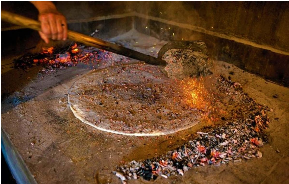
Sl. 13. Tradicionalan način pečenja soparnika lugom i sitnim žarom (vinove loze)

beskvasnog tijesta s blitvom, bijelim lukom, maslinovim uljem i češnjakom. Te namirnice su i kroz 20. stoljeće bile najzastupljenije u trgovini Poljičana upravo zbog klimatskih faktora koji im je omogućavao po nekoliko berbi godišnje tih namirnica, poglavito češnjaka po kojem su Poljica posebno Gornja bila poznata po velikoj i kvalitetnoj proizvodnji. Danas je to vrsta jela koja se „probila na šire domaće tržište te danas to jelo možete naručiti u većini restorana na obalnom pojasu smještenom između Omiša i Makarske. Zašto je to jelo važno za identitet Poljica? Iz istog razloga zašto je sir parmezan važan za grad Parmu. A to je način izrade koji je ostao više-manje isti kroz stoljeća njegovog postojanja, upotreba lokalnih namirnica koji pomažu domaćim proizvođačima te prestiž jer navodno jedino dobar soparnik je onaj kojeg napravi Poljičanin ili netko porijeklom iz Poljica. Također je to jelo svojevrsni sinonim mlađim generacijama za prostor Poljica i njenu povijest. Iako možda ne znaju za Poljica, sigurno su jeli ili čuli za poljički soparnik.