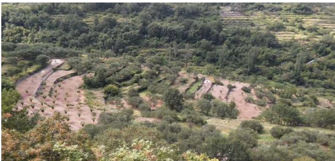
Sl. 8. Terasna polja tzv. meja na području Podgrađa (Srednja Poljica)