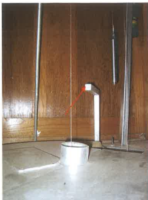
Oznaka na mareografu d