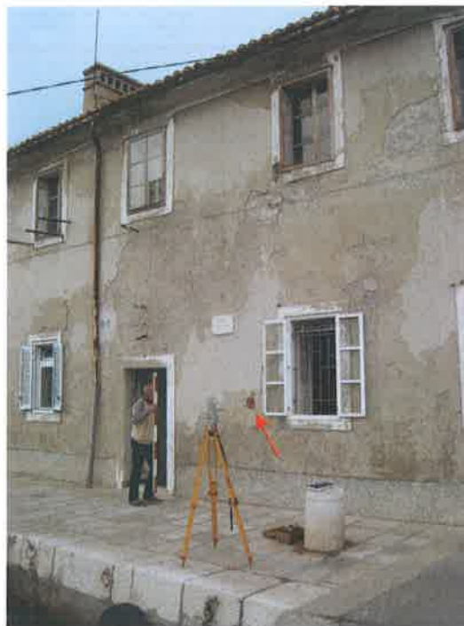
Reper B.V. 15663