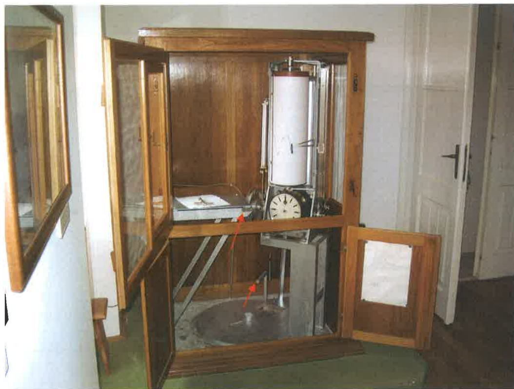
Mareograf u Bakru s oznakama c i d