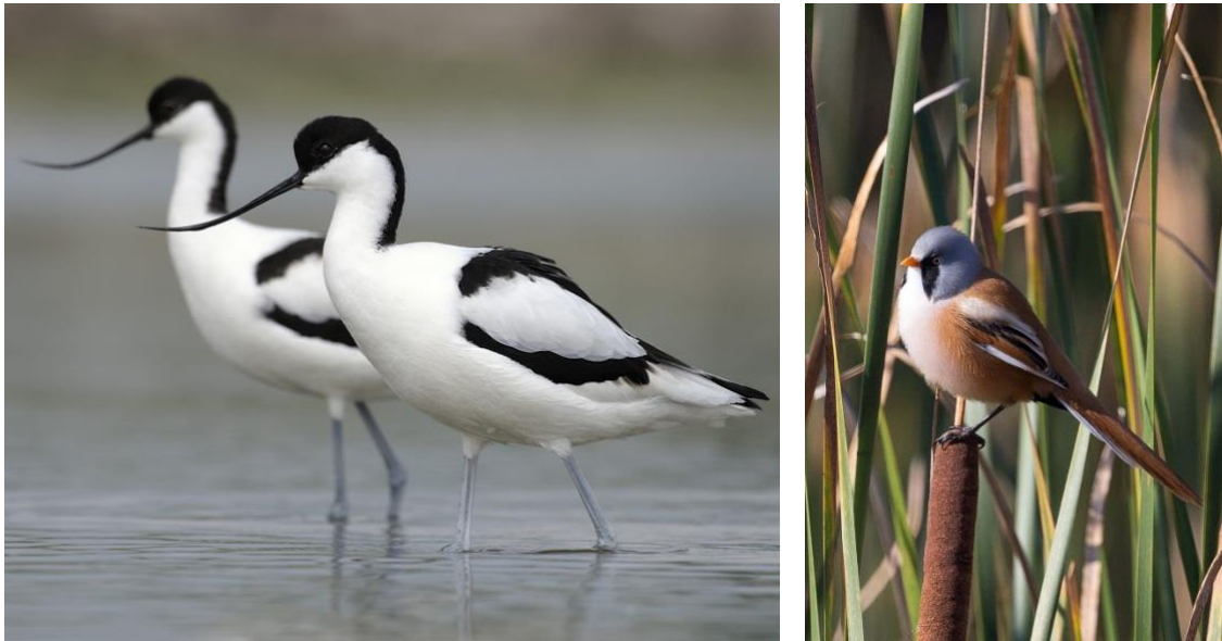
Slika 10. A) Modronoga sabljarka ( Recurvirostra avosetta ) je jedna od mnogobrojnih ptica močvarica iz Kopačkog rita, pripada preletničkoj populaciji Kopačkog rita i strogo je zaštićena vrsta (NN 99/2009) ( https://priodahrvatske.com/2019/05/21/ptice-mocvarice/ ) B) Panurus biarmicus je preletna i strogo zaštićena vrsta ptice Kopačkog rita (NN 99/2009) ( https://en.wikipedia.org/wiki/Bearded_reedling ).