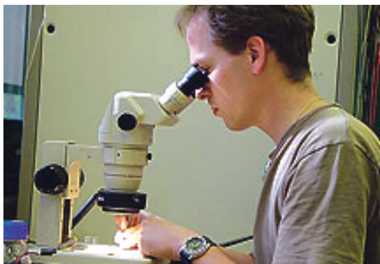
Slika 1a). 2003.–2004. Lausanne, Laboratorij Lászla Forra.

Nakon završenog studija proveo sam godinu dana na odsluženju vojnog roka, koji mi je ostao u razmjerno dragom sjećanju. Tu sam godinu iskoristio i kako bih odlučio kamo dalje. Otac i brat također su fizičari pa bi bilo nepraktično da sam ostao pripremati doktorat u Zagrebu. Kao i moja nešto mlađa sestra (također fizičarka), znao sam da trebam spakirati kofere i dokazati se prvo na internacionalnoj sceni, prije nego što mogu pomisliti vratiti se kući. Lomio sam se između nekoliko opcija i na kraju sam svoj put nastavio na École Polytechnique Fédérale de Lausanne (EPFL) u Švicarskoj (slika 1). I taj je odabir bio pun pogodak. Imao sam sreću raditi s prof. Lászlóm Forró [3], tada mentorom, a kasnije dragim prijateljem.