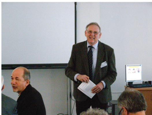
Slika 3. Pozvano predavanje J. R. Coopera na međunarodnoj konferenciji “Physic of low dimensional conductors: Problems and perspective” Institut za fiziku, Zagreb, 2012. godine.

sam kraće ili duže boraviti u laboratorijima u inozemstvu, što mi je bilo od znanstvene i financijske pomoći. Kod tih znanstvenoistraživačkih boravaka, na odabir istraživačkih projekta utjecao je i moj domaćin. U Interdisciplinarnom istraživačkom centru za upravljivost (IRCS) u Cambridgeu, kojim je upravljao profesor Yao Liang, a kasnije profesor Archie Campbell, od znanstvenika poput mene očekivalo se da će potrošiti oko 50 % svog vremena na “kolektivne” projekte. Tako su na znanstveni program utjecali direktori i pet kodirektora IRCS-a s odsjeka za fiziku, kemiju, znanost o materijalima, znanost o Zemlji i inženjering. U tom sam razdoblju uživao u dugoj i plodnoj suradnji s dr. Johnom Loramom i profesorom Jefferyom Tallonom, a također sam radio i s nekim izvanrednim studentima doktorskih studija i postdoktorskim istraživačima.