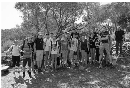
Učenici na izletu.