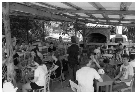
Izlet u miomirisni vrt.

Tema ovogodišnje škole bila je veze s idejom da se naglasi povezanost raznih područja fizike, ali ujedno i fizike i drugih znanstvenih i društvenih disciplina. Predavanja na školi bila su iz svih područja fizike, no ujedno fokusirana na veze fizike i informatike. Na primjer, jedna od tema bila je uloga strojnog učenja u istraživanjima u fizici. Predavači su bili znanstvenici i doktorandi Sveučilišta u Zagrebu, no ujedno i zaposlenici vodećih hrvatskih IT tvrtki s pozadinom u znanosti. Uz predavanja u jutarnjim satima za sudionike su organizirane znanstvene igre, radionice i izleti u popodnevni satima.