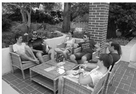
Predavači se odmaraju u omladinskom hostelu.