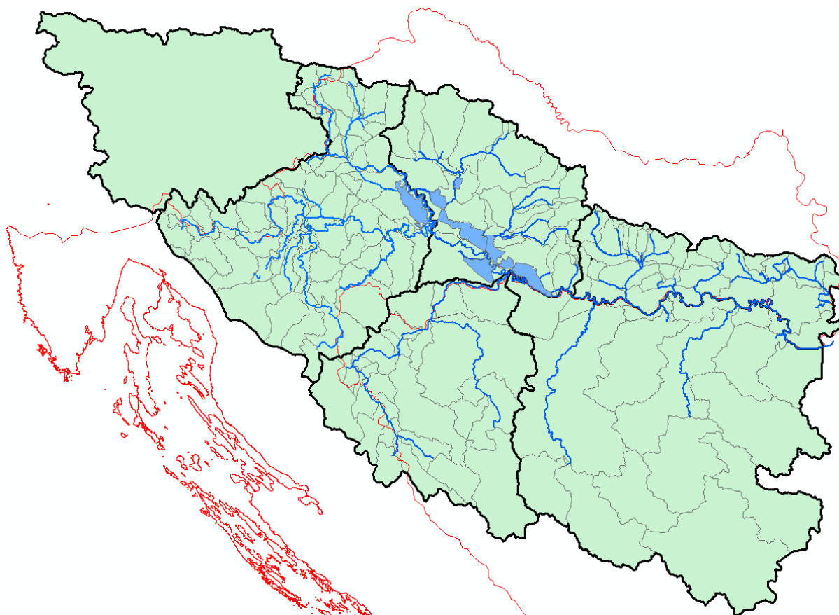
Slika 1. Područje sliva rijeke Save koji ima utjecaj na vodne prilike u Hrvatskoj s retencijama u srednjoj Posavini.

Sava je najduža rijeka u Republici Hrvatskoj, gdje protječe u dužini od 562 km te uvjetuje prirodna, ali i kulturološka obilježja Posavine. Njene najveće pritoke dolaze iz desnog zaobalja, a to su Kupa, Una, Vrbas, Bosna, Drina i druge. Lijeve pritoke su kraće rijeke (Lonja, Česma, Ilova, Orpljava i druge), no one se uglavnom nalaze na teritoriju RH. Slivno područje Save značajno za teritorij Hrvatske prikazano je na slici 1. Sava od Zagreba poprima sve značajke nizinske rijeke (Gugić i sur., 2008).