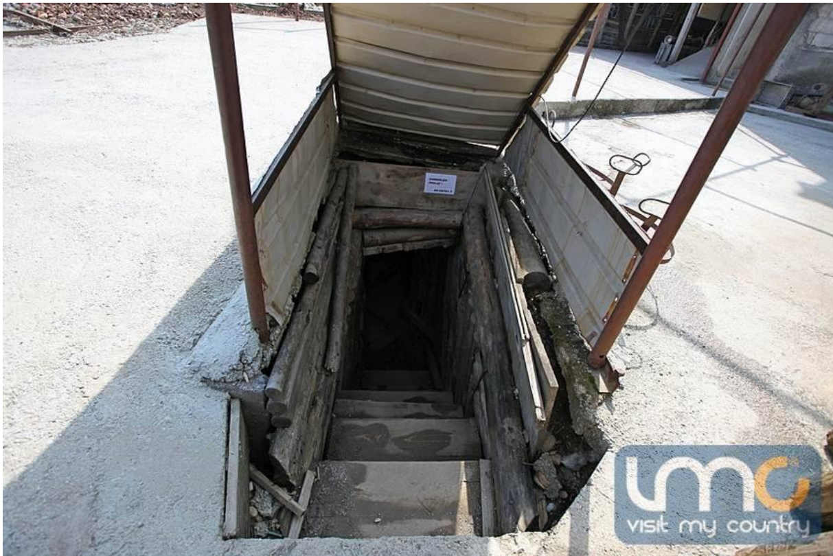
Slika 2. Tunel Dobrinja - Butmir