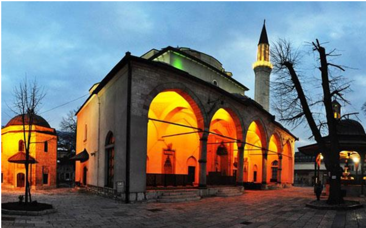
Slika 1. Gazi Huser-begova džamija