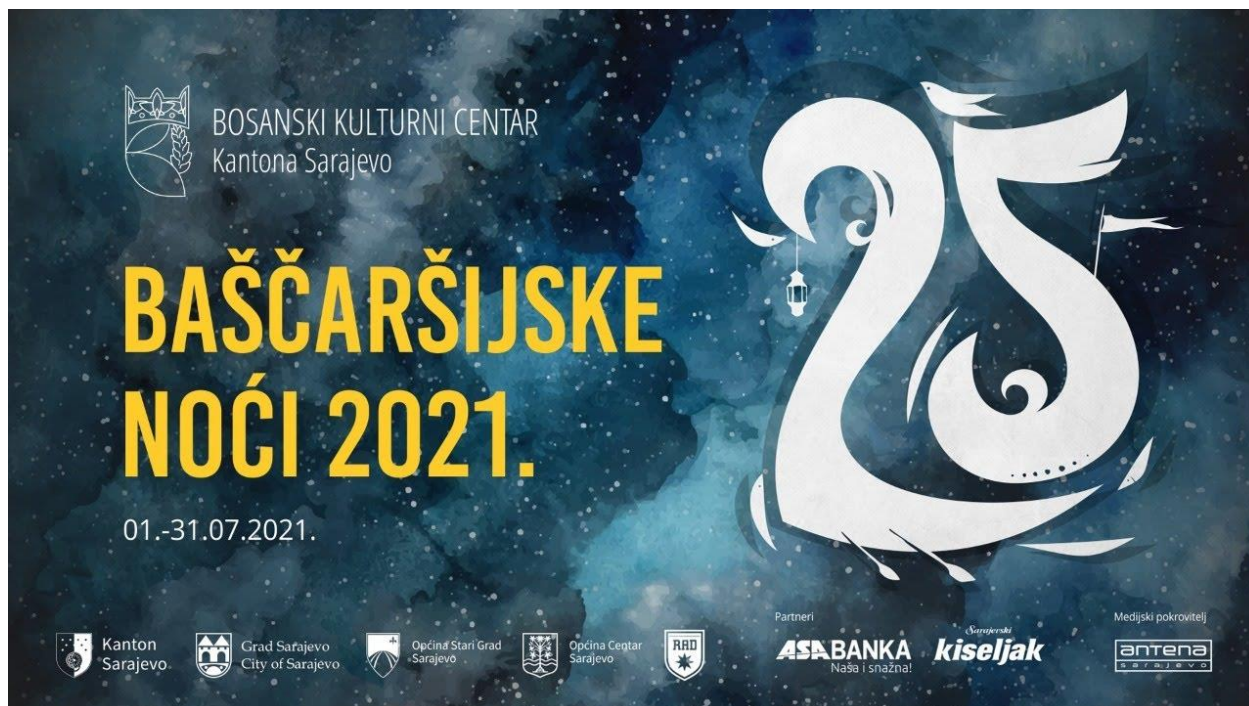
Slika 3. Najava za Bašćaršijske noći, 2021. godina