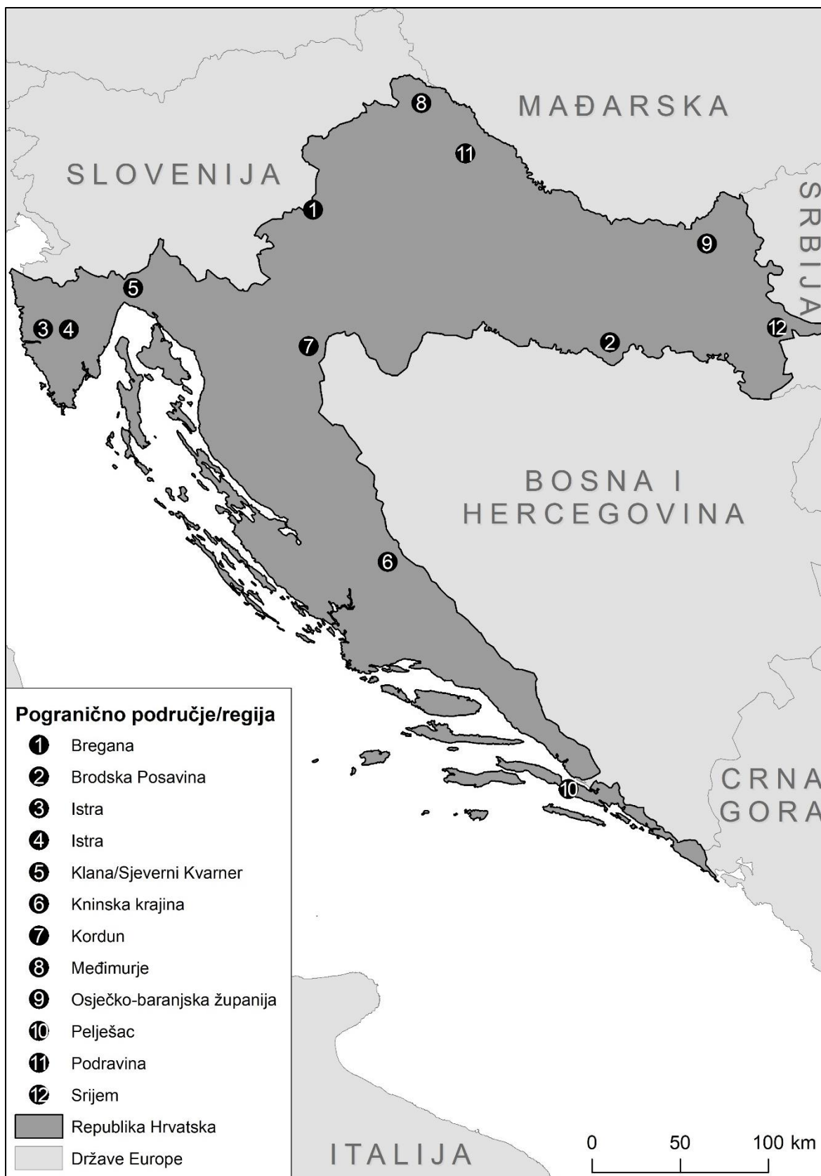
Sl. 2: Pogranična područja i regije stanovanja ispitanika s područja Republike Hrvatske

Kartografska podloga: Open Street Map, 2022