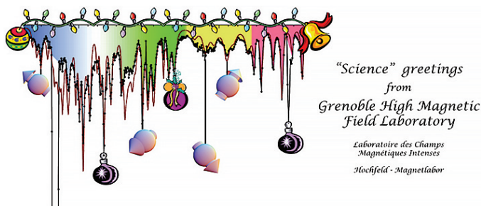
Slika 5. NMR spektar kojim je potvrđeno postojanje “magnetskog kristala” ovdje je okrenut naopako i ukrašen da bi postao novogodišnjom čestitkom laboratorija.

Naravno, od znanstvenih doprinosa su mi više prirasli srcu oni gdje sam se ponajviše sam potrudio za njihovo ostvarenje. Radi se o mojoj glavnoj znanstvenoj tematici kvantnog magnetizma, gdje jako magnetsko polje može inducirati posebna, egzotična stanja materije. Jedan primjer je Bose-Einsteinov kondenzat koji je magnetski ekvivalent električnom supravodljivom stanju. Drugi primjer su platoi u krivulji magnetizacije u ovisnosti o magnetskom polju, koji u posebnim slučajevima mogu odgovarati uređenju lokalne raspodjele magnetizacije u magnetski kristal (tzv. Wignerovom kristalizacijom). Teorijski je prvi put predloženo da se upravo to događa u spoju \text{SrCu}_2(\text{BO}_3)_2 , a naša NMR mjerenja su dala prvi i jedini dokaz te pretpostavke, kao i detaljnu informaciju o strukturi tog magnetskog kristala (vidi slike 4 i 5).