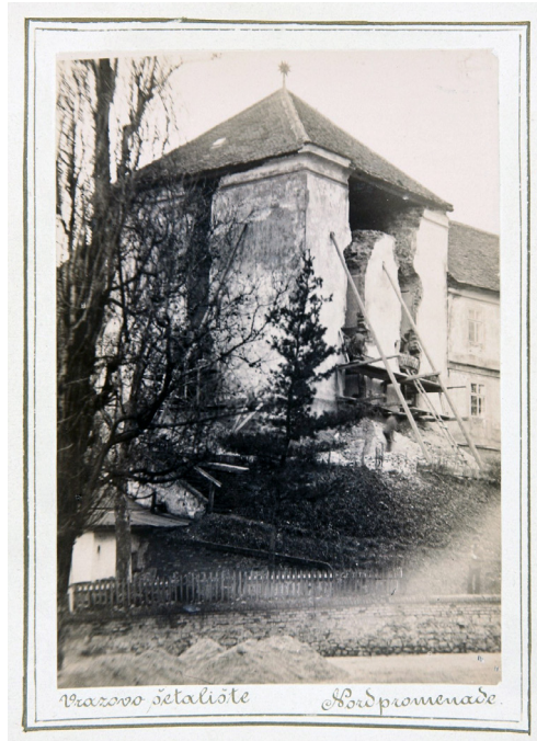
3.1 Radovi na Popovu tornju nakon potresa Herman Fickert