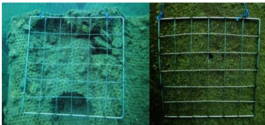
Slika 5. Kvadrat 30x30 cm 2 korišten kod praćenja flore i faune na "eko" betonu-lijevo i običnom-desno. (Ido, S. i Shimrit, P., 2015.).