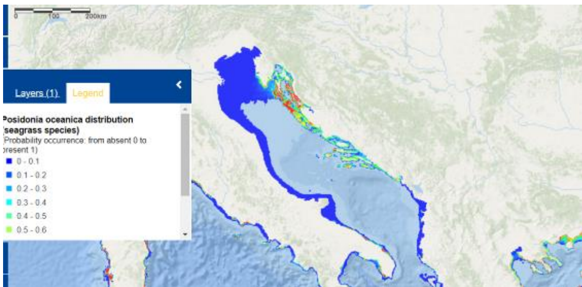
Slika 3. Uvećani prikaz rasprostranjenosti Posidonia oceanica za područje Jadrana.

Kao što je vidljivo na slikama Posidoniju je moguće pronaći duž cijele hrvatske obale Jadrana, naročito u moru kod Kvarnera i Kvarnerskih otoka, sjevernog djela Zadarske županije te na južnim otocima Hvaru, Visu i Lastovu. Pošto cvijetnice Posidonije imaju značajnu ulogu u poboljšanju kvalitete morske vode, apsorpciji CO 2 iz atmosfere, zaštiti obale od udara valova,