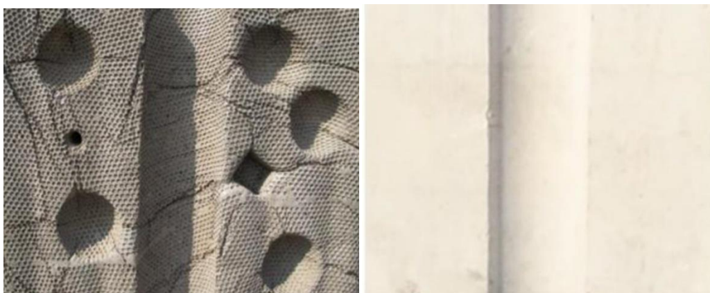
Slika 5. Razlika u strukturi između „eko“ betona-lijevo i običnog betona-desno (Ido, S. i Shimrit, P., 2015.).