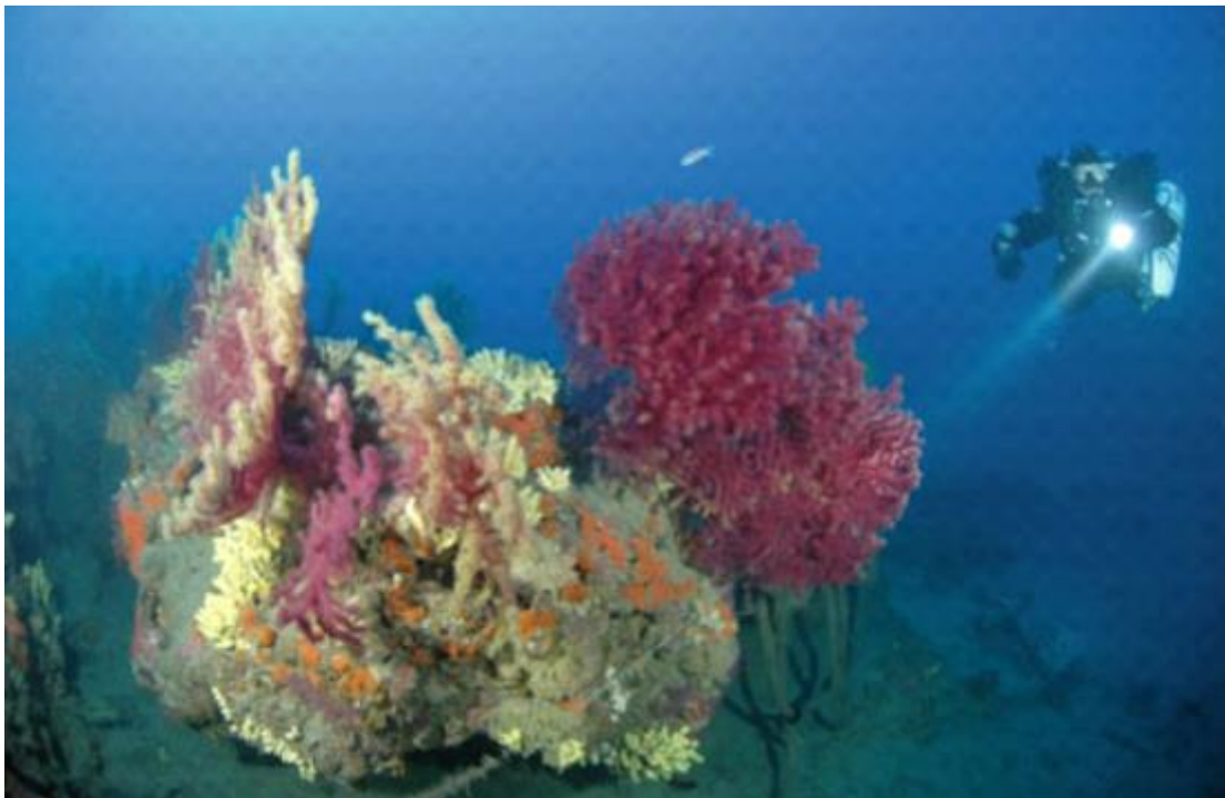
Slika 5. Mediteranska crvena gorgonija ( Paramuricea calvata ). (Photo:Informare).

Konzumacija i zapletanje u morski otpad ima izrazito značajan utjecaj na život u moru. Točnije zooplanktonskom konzumacijom mikroplastike čestice plastike ulaze u morski hranidbeni lanac. Zooplanktivori (ribe mezopelagijala, kitovi usani) su izloženi direktnom unošenju mikroplastike putem kontaminiranog zooplanktona ili slučajnom unošenju tokom hranjenja. Pošto mikroplastika sadrži toksične spojeve koji se akumuliraju tokom hranidbenog lanca to ima izrazit ekotoksikološki učinak na sve karike u lancu prehrane, uključujući i čovjeka. Slučajno zapletanje u morski otpad je identificirano kao najveća prijetnja opstanku najugroženije vrste tuljana na svijetu Sredozemne medvjedice ( Monachus monachus ). (Karamandilis i sur., 2008.). Više od polovice zabilježenog otpada na morskom dnu čini odbačena ili izgubljena ribarska oprema, koja direktno utječe na morske bentoske organizme, primarno gorgonije kao i spužve. Posljedično morski otpad u Mediteranu ima dalekosežne posljedice na bioraznolikost i ekosustav Sredozemnog mora.