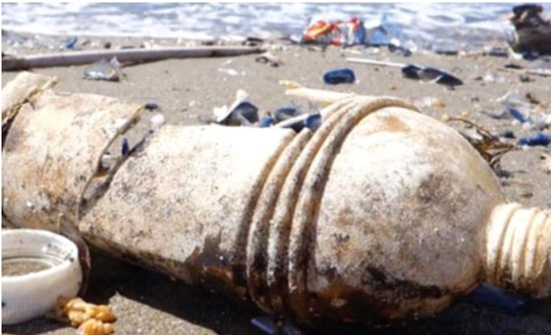
Slika 4. Česta pojava na Mediteranskim plažama. Plastična boca koja će se razgraditi na čestice mikroplastike.

Iako je morski otpad zabrinjavao znanstvenike od sedamdesetih godina prošlog stoljeća danas smo suočeni s kritičnim i kompleksnim problemom za cijelo područje Mediterana. Morski otpad nalazimo izbačen uz obale, kao plutajuće nakupine u stupcu mora, te kao pokrivač na morskom sedimentu. Na obalama najveći postotak otpada čak preko 80% čini plastika. Izmjerene koncentracije čestica mikroplastike u Mediteranu spadaju među najveće na svijetu. (Suaria i sur., 2016.).