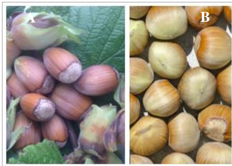
Slika 4. Usporedba orašastih plodova A) obične lijeske ( C. avellana ) i B) lombardijske lijeske ( C. maxima ) (preuzeto s: https://www.blackmoor.co.uk/ i https://www.ecosia.org/ )