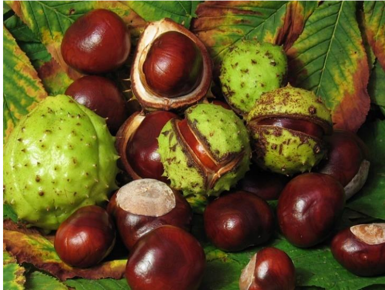
Slika 9. Zreli plodovi običnog divljeg kestena ( A. hippocastanum )