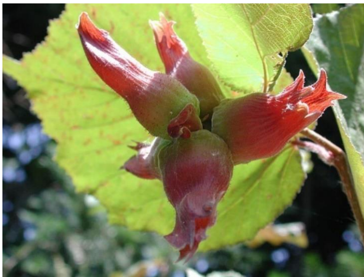
Slika 3. Grozd nedozrelih plodova lombardijske lijeske, C. maxima