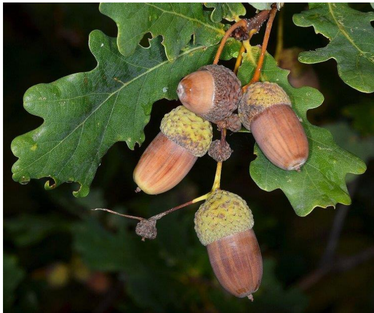
Slika 7. Zreli žirevi (plodovi hrasta lužnjaka, Q. robur )