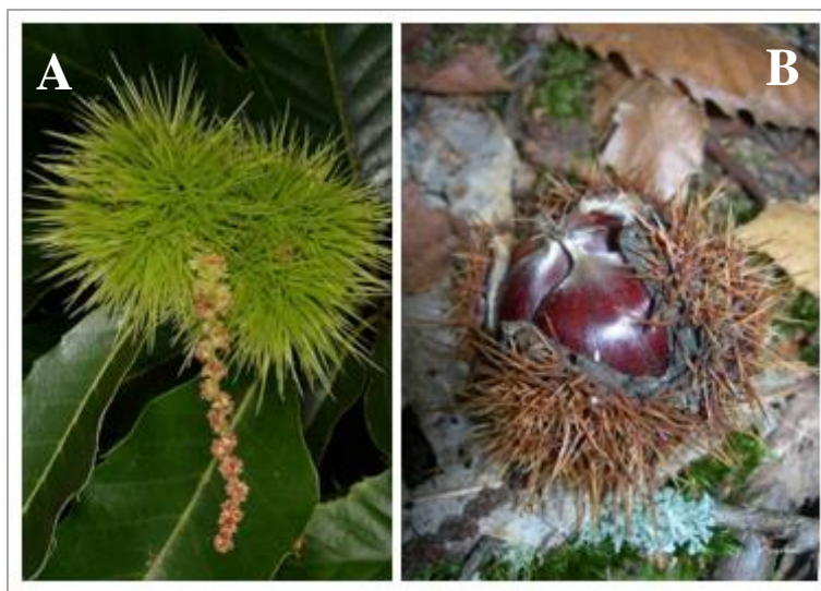
Slika 5. Orašasti plodovi pitomog kestena ( C. sativa ) A) prije i B) nakon sazrijevanja