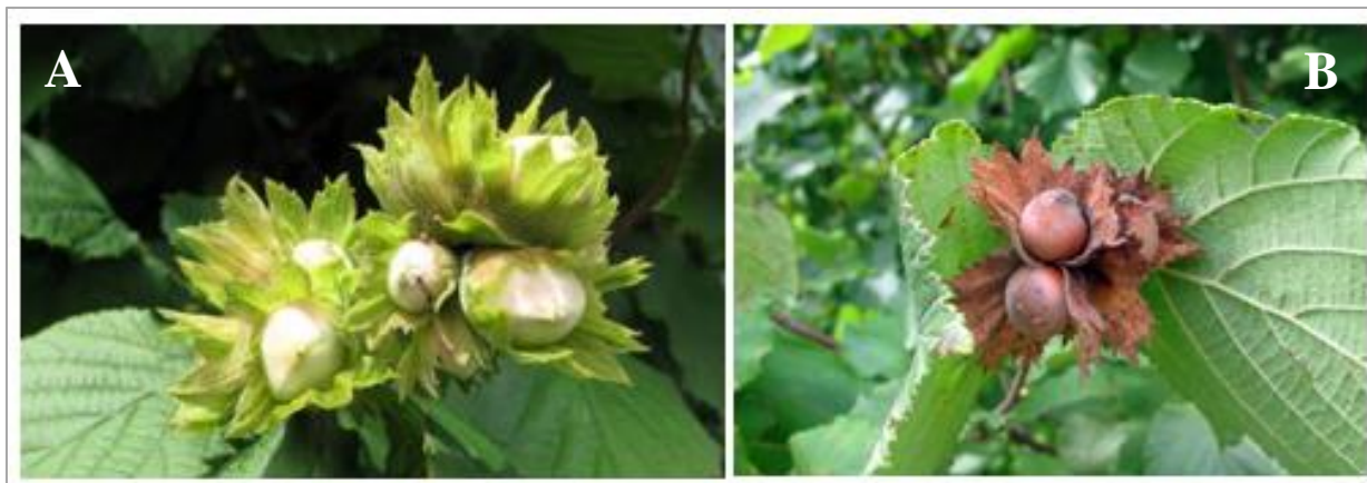
Slika 2. A) Nezreli i B) zreli grozdovi lješnjaka obične lijeske, C. avellana