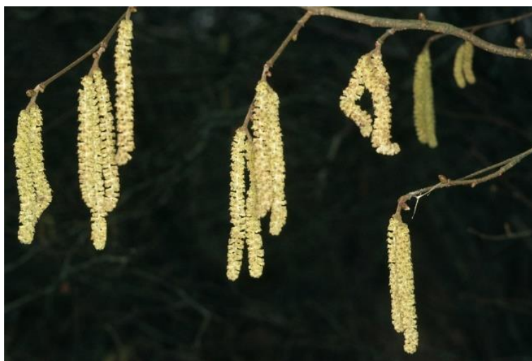
Slika 1. Muški cvat obične lijeske, C. avellana (L.)

dlačice. Lijeska je monoecična, odnosno jednodomna, na što ukazuje pojava muških i ženskih cvjetova ove biljke na istim stablima. Unatoč tome, da bi došlo do uspješnog razmnožavanja, cvjetovi spomenutog stabla moraju biti oprašeni peludom koji potiče s drugih stabala iste vrste. Ženski cvjetovi C. avellana maleni su te oblikom podsjećaju na čupave pupove, svijetlosmeđe do zelene boje, sa crvenim vrhovima. S druge strane, muški se cvjetovi pojavljuju ne samo prije ženskih cvjetova, već i samog lišća, što je najčešće unutar perioda od kraja siječnja i sredine veljače. Muški cvjetovi zapravo rastu kao cvat u obliku rese, nježno žute do zelenkaste boje (Slika 1). Cvjetovi lijeske oprašuju se anemofilijom jer, iako privlače pčele, pelud na ženskim cvjetovima nije dovoljno ljepljiv kako bi ga mali oprašivači prenosili na druga stabla.