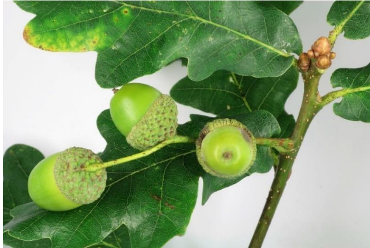
Slika 6. Orašasti plodovi hrasta lužnjaka ( Q. robur ) prije sazrijevanja