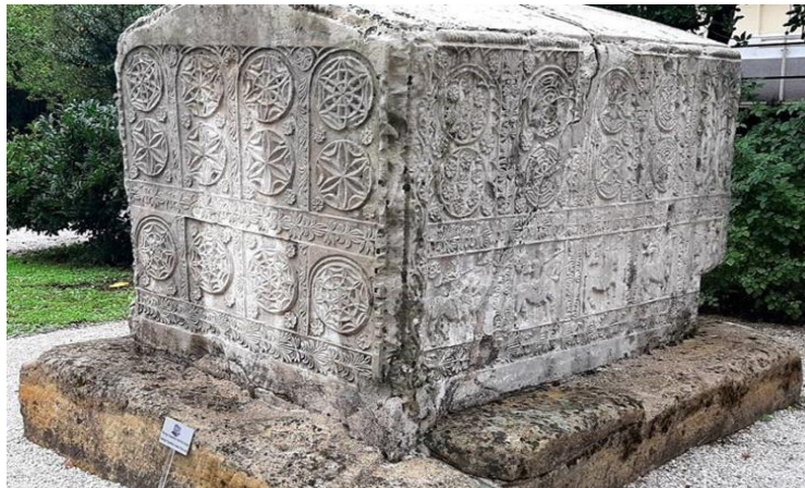
Sl. 5. primjer Zgroščanskog stećka