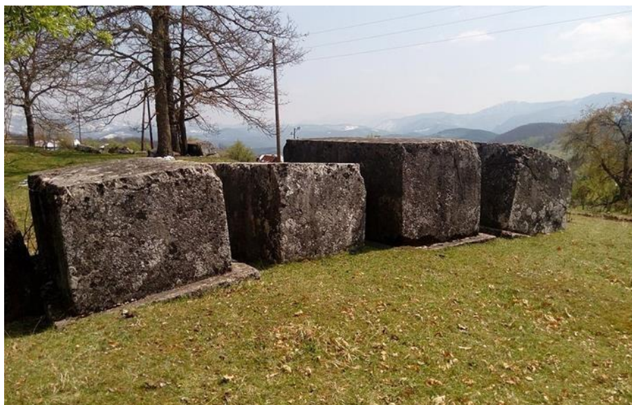
Sl. 4. Stećci u Lađevinama, Rogatica