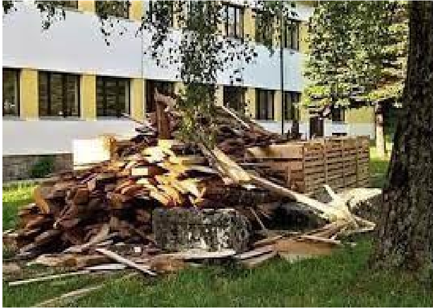
Sl. 14. Primjer nebrige za stećke