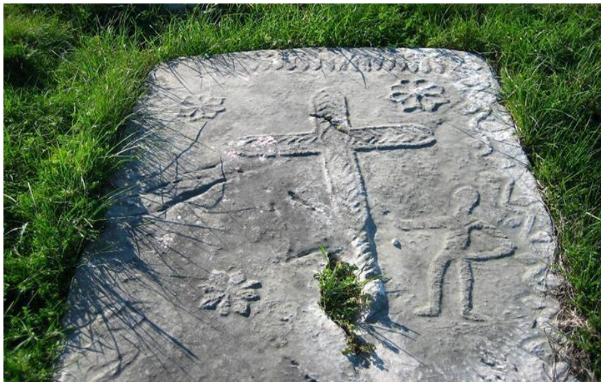
Sl. 2. primjer pločastog stećka u Cisti Velikoj

Stanovništvo srednjovjekovne Bosne u 13. stoljeću je živilo u jako teškim životnim uvjetima. Bili su prisutni nesređeni politički uvjeti, posebno u situaciji kada se grčevito branilo od ugarskih pretenzija, što je se svakako odrazilo i na kulturu koja se može ugledati u siromaštvu oblika i ukrasa u odnosu na 14. i 15. stoljeće. Nema sigurnih dokaza, ali broj pojave ploča, a ne sanduka i sljemenjaka je zasigurno jedan od simptoma slabog i nesređenog privrednog stanja u to vrijeme. (Miletić, 1982)