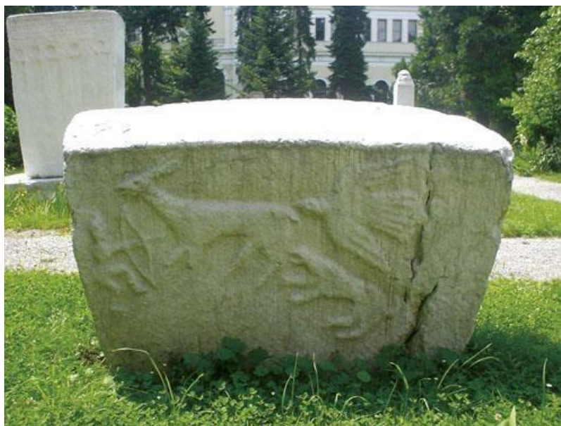
Sl. 11. Primjer životinjskog motiva

U stećcima se pojavljuju cvjetne grane, lisnate i rascvjetane trake do kombinacija usamljenih i opustošenih drveća i cvijeća, tako je na primjer spirala s grozdovima u kompoziciji sa križem ukasila spomenike pored Srebrenice. Također, pojavljuje se dosta predstava drveta koji su prožeti određenom dubljom simbolikom. ( Miletić, 1982).