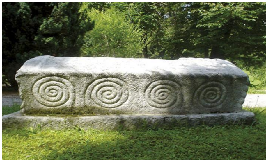
Sl. 3. primjer sanduka na "dvije vode"

sanduci sa dva sahranjena lica koji se mogu prepoznati prema uzdužnoj vrpici sredinom spomenika. (Bešlagić, 2004).