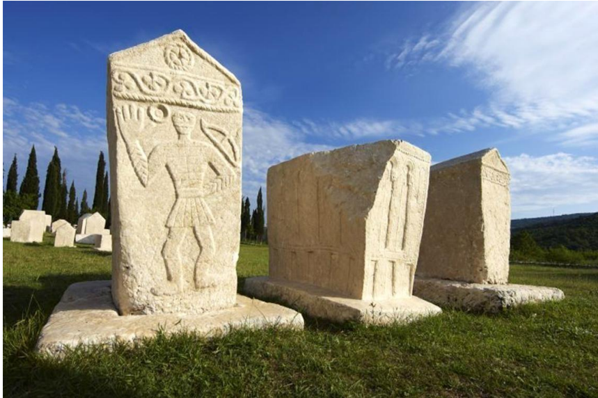
Sl. 9. Prikazuje umjetničke motive na stećcima, općina Stolac