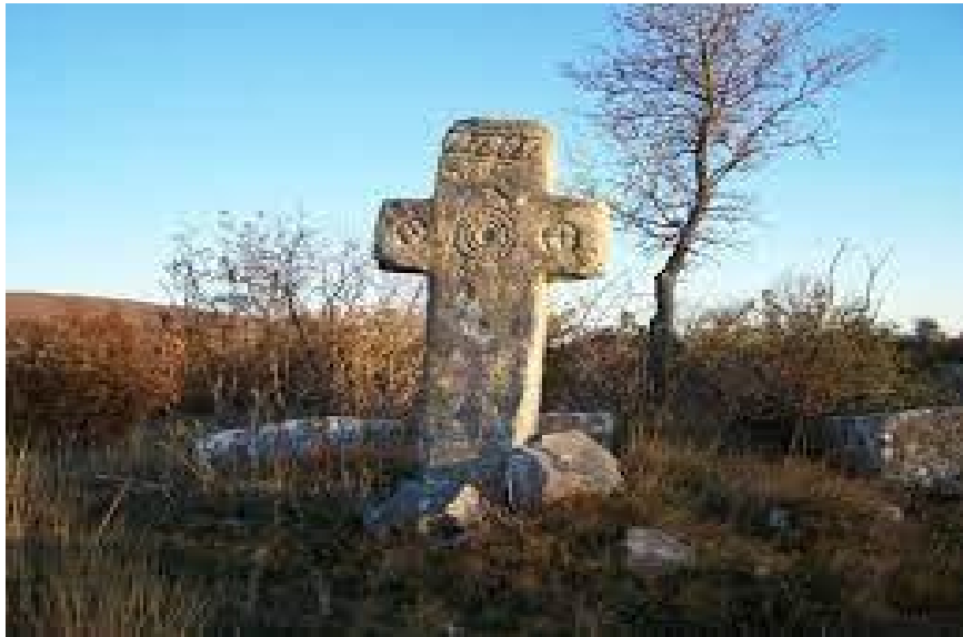
Sl. 7. Primjer krstače

Krstače su tipični kršćanski nadgrobni spomenici. Njihova visina često zna dosegnuti i do 3 metra. One su klesane tako da su im sva tri kraka jednakih dimenzija. Često se pri izradi ovakvih nadgrobnih spomenika pazilo na izradu gornjeg kraka, ali općeg pravila nema. Na teritoriju cijele Bosne i Hercegovine mogu se naći različite gornji krakovi na krstačama; u obliku piramide, bačvasto zasvođeni, a nekada završeni s ravnom površinom. U okolici Zenice i Travnika evidentiran je broj krstača gdje su poprečni krakovi oboreni što podsjeća na ljudska ramena. Krstača ima najviše u Hercegovini, a najmanji broj je u Crnoj Gori i Srbiji. (Bešliagić, 2004).