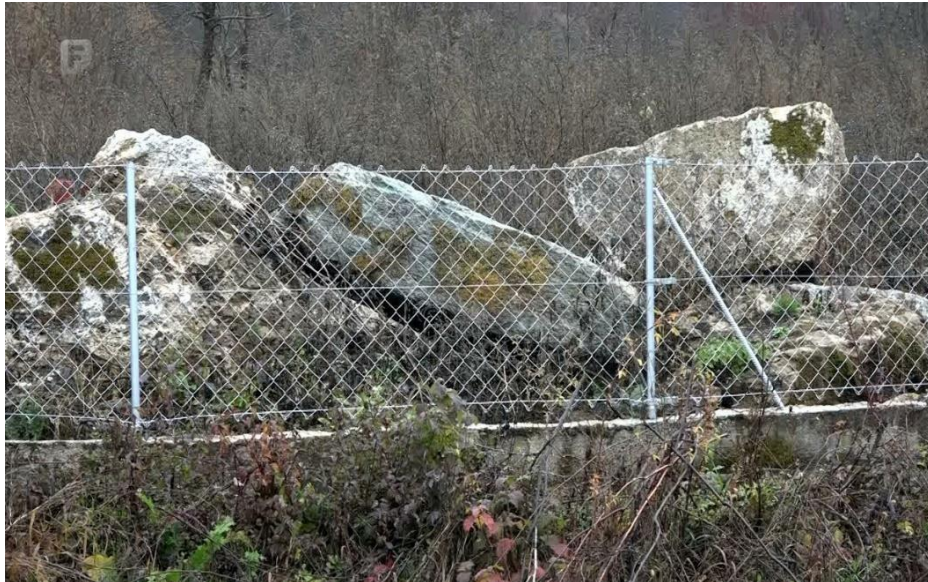
Sl. 15. Primjer nebrige za stećke 2