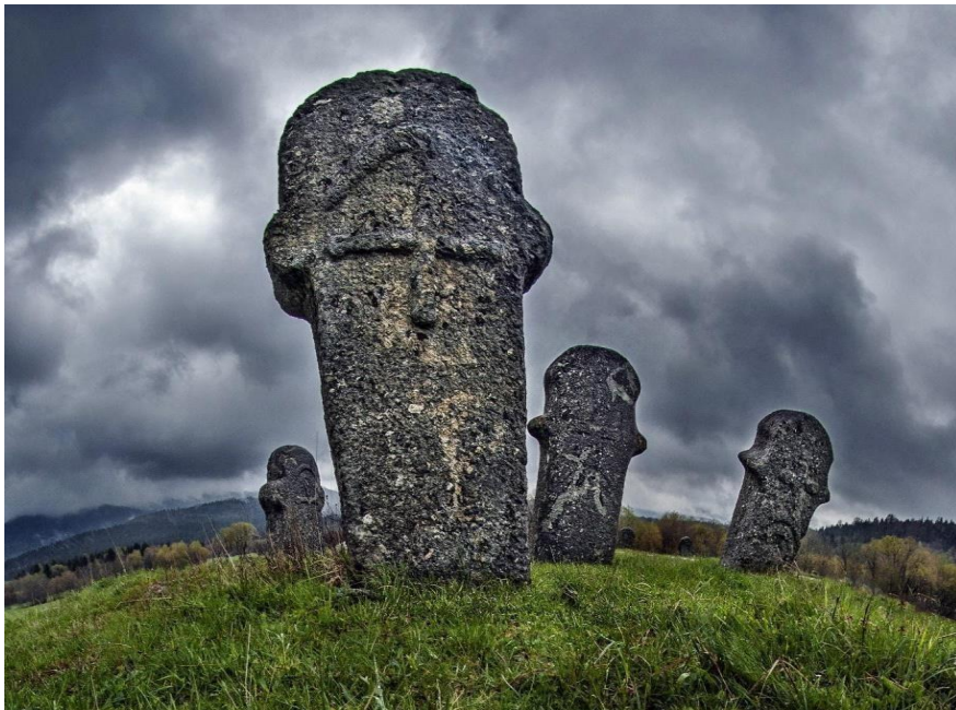
Sl. 10. Prikazuje stećke nekropole Maculje