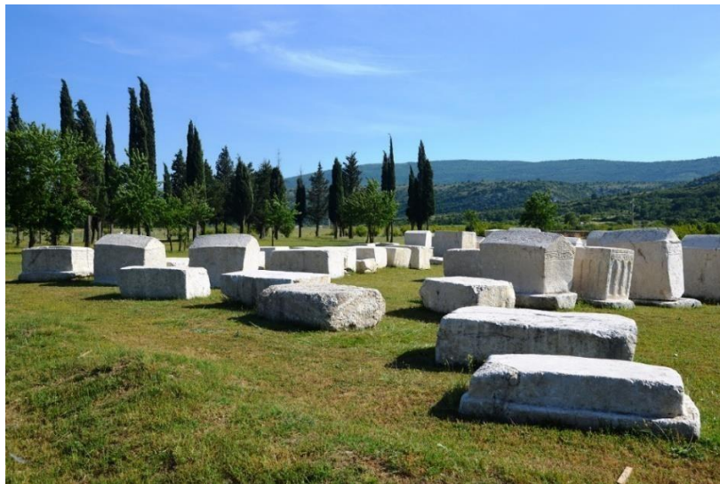
Sl. 13. Nekropola Radimlja, Općina Stolac

Tri kilometra zapadno od općine Stolac nalazi se nekropola Radimlja. Ona se ubraja među najznačajnije spomenike srednjovjekovne Bosne i Hercegovine. Najveći razlog za to je brojnost, posebnost i reprezentativnost ovih oblika. Također, na ovom lokalitetu se nalaze nadgrobni spomenici koji se ističu po visokoj kvaliteti umjetničke izrade, bogatstvom ukrasa te ukrasima sa povijesnim ličnostima. Nekropola Radimlja potječe iz 17. stoljeća, a sastoji se od 133 stećka: 36 ploča, 1 ploča na postolju, 27 sanduka, 24 sanduka na postolju, 4 visoka sanduka, 5 visokih sanduka na postolju, 2 sljemenjaka, 31 sljemenjak na postolju i 3. stećka u obliku križa. Šest stećaka je ukrašeno urezivanjem ili kombinacijom kresanja. Što se tiče dekorativnih motiva, po broju i obradi najviše ima motiva trolisnih lozica i tordiranih vrpce, te simboli štita, mača i luka sa strijelom. (Bordanić, 2019).