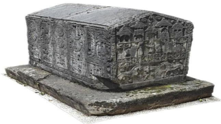
Sl. 1. Primjer stećka iz Zgošće (Kakanj) iz 15. st.

Mnoga interesiranja za njih su započela još prije 450 godina kada je Benedikt Kuriprešić objavio svoj rad” Putopis kroz Bosnu, Srbiju, Bugarsku i Rumeliju 1530 godine.” (Trako, 2011).