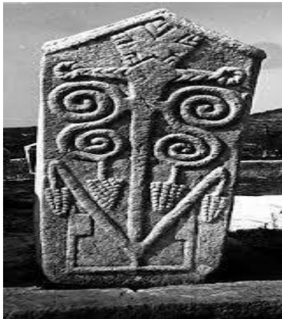
Sl. 6. Stećak "Vitko" Široki Brijeg

Stojeći stećci su najviše klesani u obliku stupova, zapravo stupovi nisu ništa drugo nego uspravni sanduci ili ploče. Kako bi oni čvrsto stajali morali su ih ukopavati u zemlju, pa se tako negdje zovu i „ Usađenici “. Neki stubovi imaju ravnu površinu pri vrhu, dok neki imaju krov na dvije ili tri vode. Također, postoje i oni koji izgledaju bačvasto, zaobljeno ili su udubljeni. Najveći broj stubova je uklesan tako da je donji dio uži nego gornji dio, odnosno oni pri vrhu se postepeno šire. Broj stupova u Bosni i Hercegovini nije baš velik, odnosno obuhvaćaju 4 % od ukupnog broja. (Bešlagić, 2004).