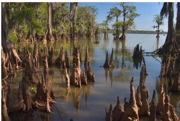
Slika 1. 'koljena' močvarnog čempresa

Hidrofилna vegetacija voli vodu te razvija niz prilagodbi za preživljavanje u vodenim okolišima. Kako je dobivanje kisika preko korijenja otežano, vodene biljke razvile su brojne alternative za pribavljanje i transportiranje kisika (Agency of Natural Resources, 2023). Neki od tih mehanizama su šuplje cjevčice aerenhima za prijenos kisika u travama, trskama, rogozu i šašu; zadebljali dijelovi korijenja močvarnog čempresa, takozvana 'koljena' prikazanima na slici 1, koji izviru iz vode i omogućavaju pribavljanje kisika iz atmosfere; korijenje izloženo na samoj površini tla prikazano na slici 2, koje ne služi samo za olakšani unos kisika, već i za povećanje stabilnosti u blatnom tlu te brojna druga učinkovita rješenja (Lancaster County Conservation District, 2017).