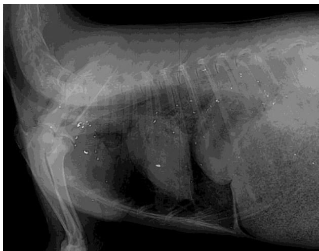
Slika 6. Raspršenost olovne sačme na rendgenskoj slici srce pogodene samo jednim metkom

Prema Green i Pain (2019), procijenjeno je da u Europskoj uniji i Ujedinjenom kraljevstvu pet milijuna ljudi konzumira minimalno jedan obrok divljači tjedno. Divljač, pogotovo ptice, najčešće se lovi olovnom sačmom (Green et al., 2022). Radi se o streljivu u obliku metka za veliku divljač ili u obliku manjih kuglica za ptice i manju divljač koje se, pri ulasku u životinju, rasprši. Time streljivo oslobađa mnogo sitnih fragmenata koji se, kao što je prikazano na slici 6, rasporede po svim tjelesnim tkivima i doprinose povišenoj koncentraciji olova u cijeloj životinji (Thomas et al., 2022).