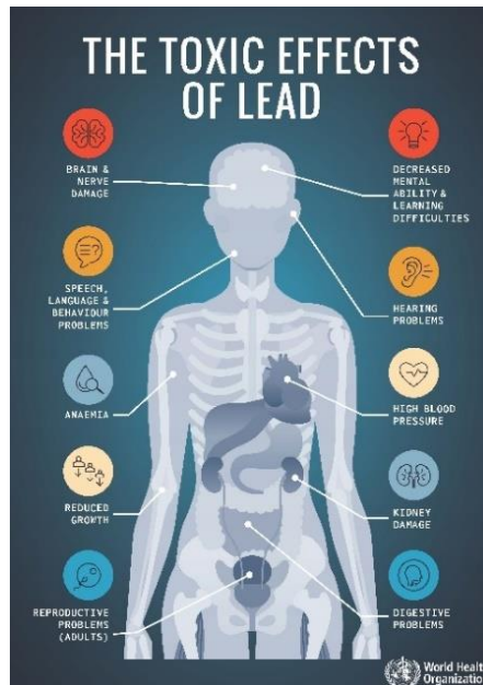
Slika 4. Štetni učinci olova na ljudsko tijelo