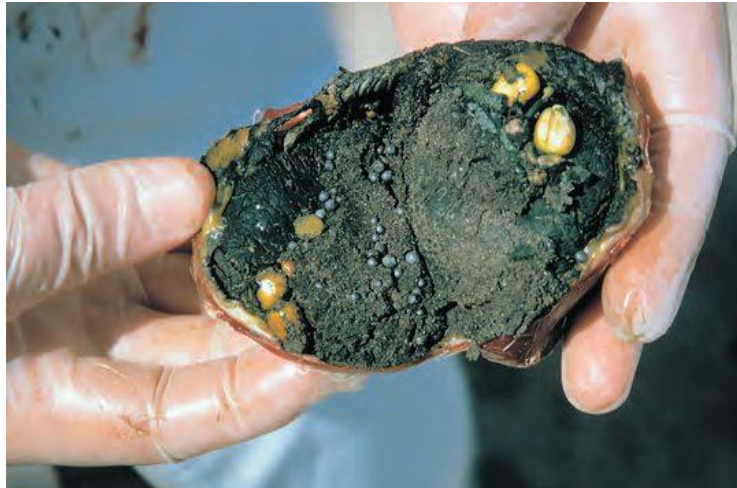
Slika 7. Olovna sačma pronađenu u mišićnom želucu kanadske guske

kamenčiće, ptice ih, kao što je prikazano na slici 7, vrlo često progutaju, što dovodi do trovanja olovom (ECHA, 2023). Istraživanjem provedenim u Europi (Pain, Mateo i Green, 2019), otkrivena je olovna sačma u mišićnom želucu svake treće patke lastarke (32%), svake četvrte glavate patke (24%) i gotovo svake šeste divlje patke (12%), što ove tri vrste čini najugroženijim ptičjim vrstama u pogledu slučajnog trovanja olovom.