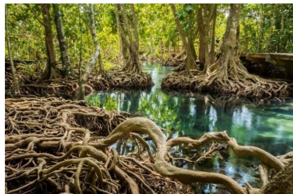
Slika 2. površinsko korijenje mangrova