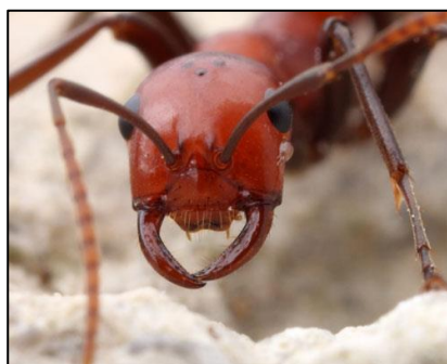
Slika 3. Vrsta Polyergus montivagus s čeljustima prilagođenim za probijanje trupa i glave žrtve (preuzeto iz Deslippe, 2010)

Morfološke prilagodbe prvenstveno su značajne za dulotičke vrste prilikom njihove invazije na zadruge drugih vrsta, poput povećanog tijela i glave te velikih, čvrstih i oštih čeljusti, kakve se mogu vidjeti kod radnika iz roda Polyergus (slika 3) (Rabeling, 2020). Kod nekih drugih vrsta, poput ksenobiotske vrste Cephalotes specularis , morfološke im prilagodbe pomažu u infiltraciji u zadrugu domaćina tako što se izgledom i načinom ponašanja prilagođavaju domaćinskoj vrsti (Powell i sur., 2014).