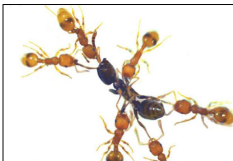
Slika 4. Napad više domaćinskih jedinki Temnothorax curvispinosus (smeđe jedinke) na veću nametničku jedinku Temnothorax americanus (crna jedinka) (preuzeto iz Grüter i sur., 2018)

Ako ipak dođe do osvajanja zadruga od strane nametnika, neke domaćinske zadruge sposobne su započinjati „pobune“. Prilikom tih pobuna domaćinski radnici prepoznaju i uništavaju nametničke ličinke i kukuljice čime smanjuju rast nametničke populacije i sprečavaju njihovo širenje na susjedne zadruga (Achenbach i sur., 2010; Grüter i sur., 2018). Osim uništavanja nametničkih ličinki i kukuljica od strane odraslih domaćinskih jedinki, Pulliainen i suradnici (2019) su dokazali kako i neke ličinke domaćinskih vrsta, poput vrste Formica fusca , prepoznaju nametnička jaja te se njima hrane čime također značajno doprinose smanjenju brojnosti nametnika.