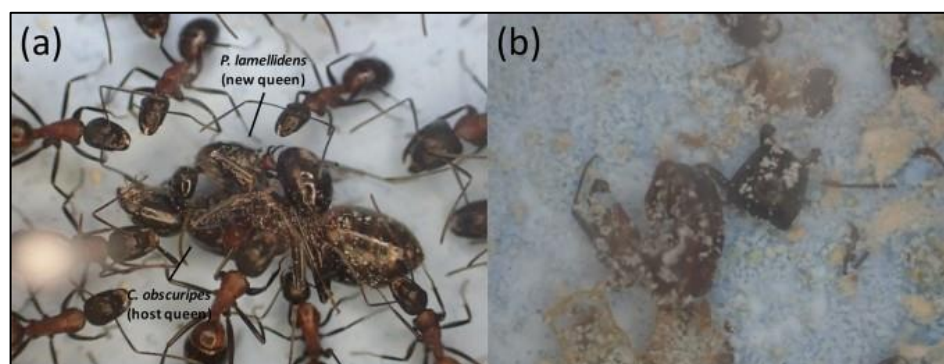
Slika 6. a – napad nametničke kraljice Polyrhachis lamellidens na domaćinsku kraljicu Camponotus obscuripes ; b – ostaci domaćinske kraljice C. obscuripes nakon borbe s nametničkom kraljicom (preuzeto iz Iwai i sur., 2021)

Nametnička vrsta Polyrhachis lamellidens privremeni je nametnik na vrstama Camponotus japonicus i Camponotus obscuripes , što je utvrđeno pronalaskom zadruga koje su sadržavale nametničku kraljicu, nametničke radnike i njihove ličinke te domaćinske radnike, ali bez prisutnosti domaćinske kraljice (Iwai i sur. 2021). U laboratorijskim uvjetima Iwai i suradnici (2021) su dokazali i tolerantnost domaćinskih radnika prema nametničkim jedinkama te agresivno ponašanje nametničke kraljice prema domaćinskoj kraljici kada bi domaćinska kraljica bila unesena u zadrugu (slika 6). Ovaj primjer nametništva potvrđuje Emeryevo pravilo u širem smislu jer sve tri vrste pripadaju istoj potporodici, morfološki su slične te imaju gotovo jednak sastav kutikularnih ugljikovodika.