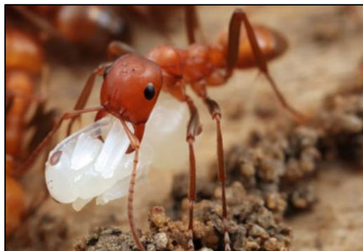
Slika 1. Vrsta Polyergus mexicanus s ukradenom kukuljicom iz pljačkaškog napada (preuzeto iz Rabeling, 2020)

Jedna od najbolje proučenih vrsta socijalnog parazitizma, koju su već u 19. stoljeću počeli proučavati Pierre Huber i Charles Darwin, jest duloza. Dulotičke vrste nisu sposobne same brinuti o ličinkama i kukuljicama niti tražiti i sakupljati hranu, a kod većine vrsta jedinke se ne mogu niti samostalno hraniti. Zato se u održavanju zadruga koriste radnicima drugih vrsta koje otimaju prilikom brojnih pljačkaških napada (slika 1) (Buschinger, 2009; Rabeling, 2020).