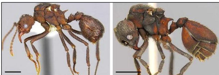
Slika 7. Redukcija tijela nametničke kraljice Acromyrmex charruanus (lijevo) u usporedbi s domaćinskom kraljicom Acromyrmex heyeri (desno) (preuzeto iz Rabeling i sur., 2015)

Prilikom opisivanja vrste, Rabeling i suradnici (2015) uočili su da se sezone parenja nametnika A. charruanus i domaćina A. heyeri odvijaju u suprotnim dijelovima godine, što je u suprotnosti s uobičajenim poklapanjem životnih ciklusa nametnika i domaćina, a to su objasnili manjom kompeticijom nametničkih spolnih jedinki u periodu kada nisu prisutne domaćinske spolne jedinke. Uvidjeli su i da su nakon razmnožavanja nametnika zadruga ostajale prazne te su pretpostavili kako se A. charruanus razmnožava semelparički, odnosno samo jednom u životu proizvodeći velik broj potomaka i potpuno iskorištavajući resurse zadruga što dovodi do i do samog nestanka zadruga. Druga pretpostavka za objašnjenje ovog fenomena napuštenih gnijezda bila je da cijele zadruga A. heyeri migriraju na nova područja, moguće kao posljedica nametništva ili radi potrage za hranom, što je i zabilježeno kod nekih zadruga A. heyeri kod kojih nisu zabilježene nametničke jedinke.