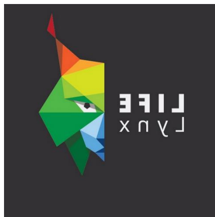
Slika 8. LIFE Lynx

U projektu sudjeluje 11 institucija iz 5 država, a države uključene u projekt su: Hrvatska, Italija, Slovenija, Rumunjska i Slovačka. U Hrvatskoj projekt provode Veleučilište u Karlovcu, Veterinarski fakultet Sveučilišta u Zagrebu i udruga BIOM. (Hunjak, 2021)