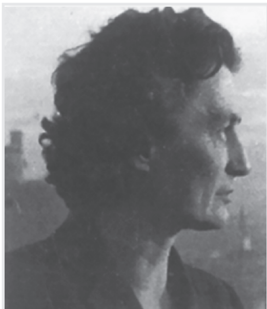
Katarina Kranjc (1915. – 1989. IFS i PMF), prva doktorica fizičkih znanosti u Hrvatskoj (doktorirala 1954.), začetnica u proučavanju ogiba rendgenskih zraka pod malim kutom