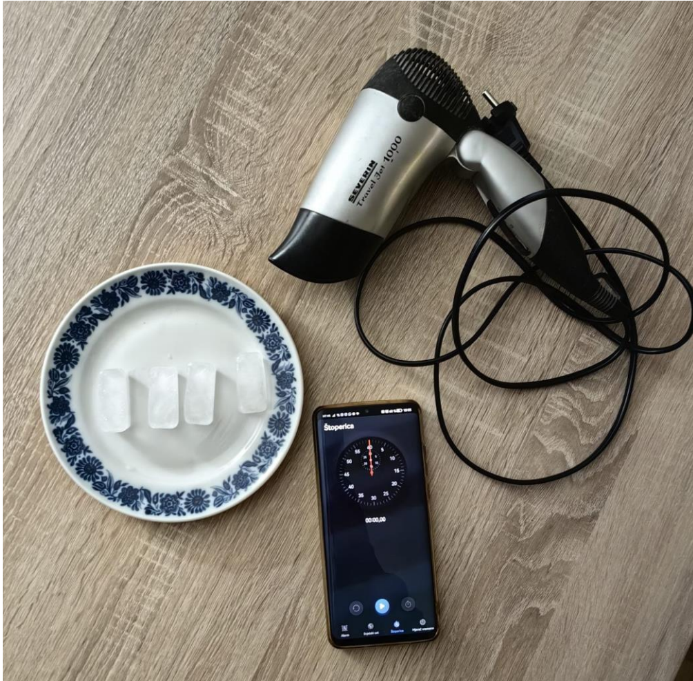
Slika 11 Pokus "Kako otopiti led?"

Pribor: fen, kocke leda, tanjurić, štoperica