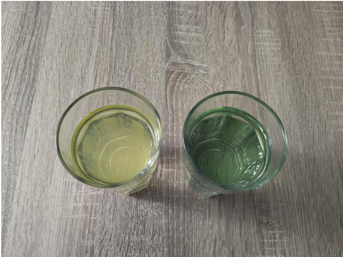
Slika 8 Obje kocke leda su se otopile.