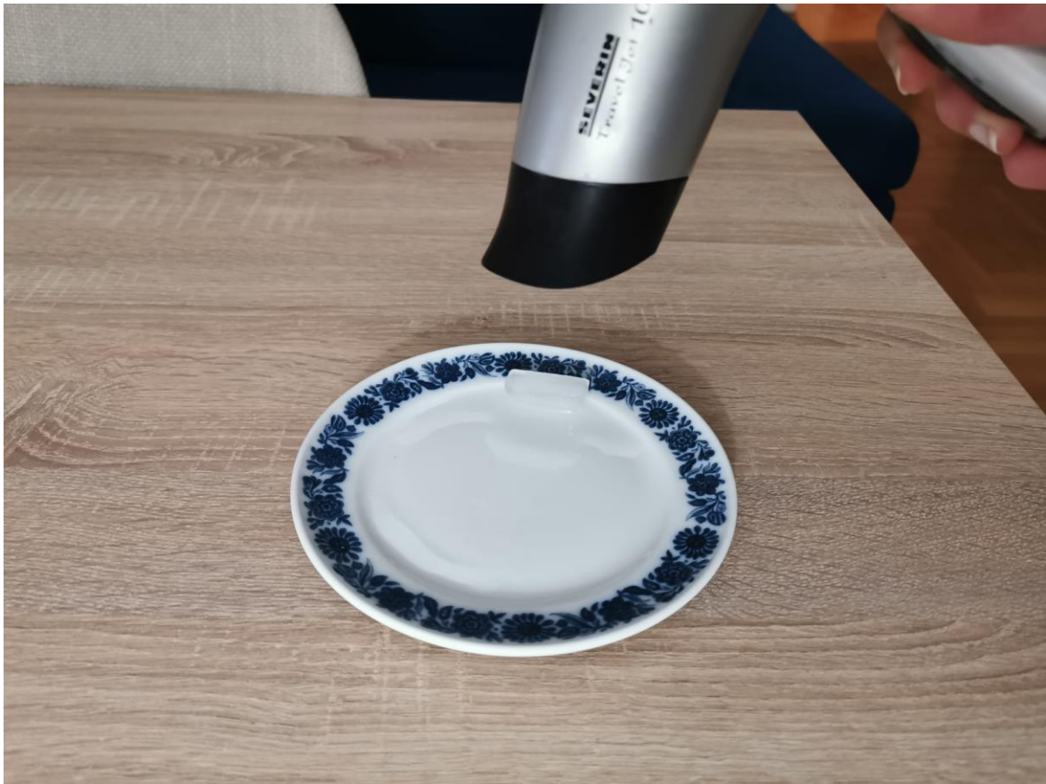
Slika 12 Kako fenom zagrijavati kocku leda?

b) Novu kocku leda postavite na tanjurić i pripremite štopericu. Stavite tanjurić negdje vani tako da sunčeva svjetlost direktno udara u nj i pokrenite štopericu. Ostavite led da se otopi, pratite promjene, bilježite opažanja. Nakon što se sav led otopio, zabilježite vrijeme koje je za to bilo potrebno.