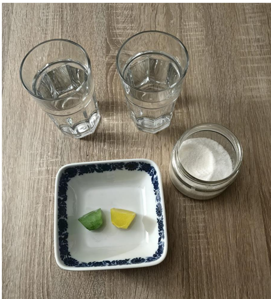
Slika 5 Pokus otapanja leda u slatkoj i slanoj vodi.

Pribor: dvije čaše, voda, sol, dvije kocke leda