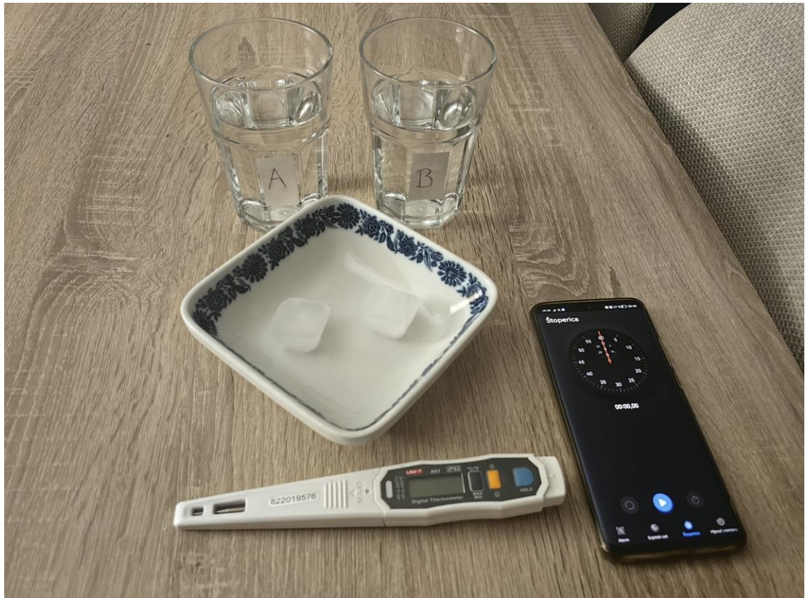
Slika 1 Pribor za pokus Otapanje leda u hladnoj i toploj vodi

Opis pokusa: U čašu A ulijte hladnu, a u čašu B toplu vodu. Izmjerite temperaturu obje vode te zabilježite rezultate. Istovremeno u svaku čašu ubacite kocku leda i pokrenite štopericu. U čaši treba biti onoliko vode koliko je potrebno da led pluta. Pratite promjene u čašama i napišite opažanja. Zabilježite vrijeme nakon kojeg se svaka od kocka leda otopi. Ponovno izmjerite temperaturu vode u obje čaše i zapišite rezultate [13].