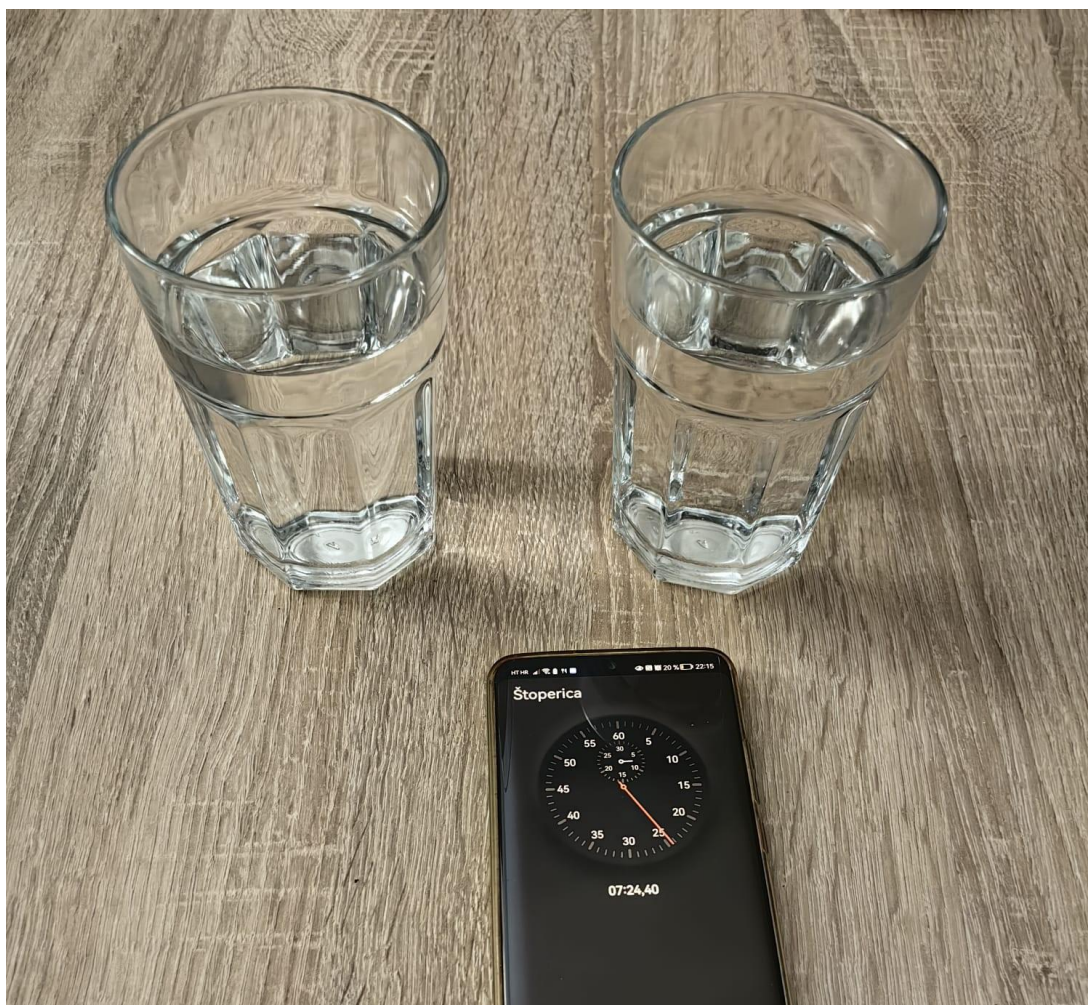
Slika 4 Kocke leda su se otopile u obje čaše.