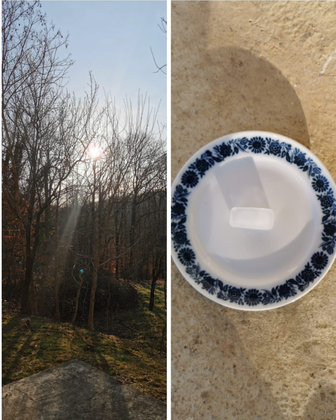
Slika 13 Otapanje kocke leda pod utjecajem sunčeve svjetlosti.

c) Stavite kocku leda na dlan. Drugim dlanom poklopite kocku leda kao da je u sendviču i istovremeno pokrenite štopericu. Trljajte led među dlanovima i pratite promjenu. Kada se sav led otopi, zabilježite vrijeme i zapišite opažanja.