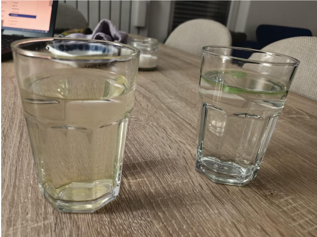
Slika 7 Žuta kocka leda se potpuno otopila, zelena još nije.