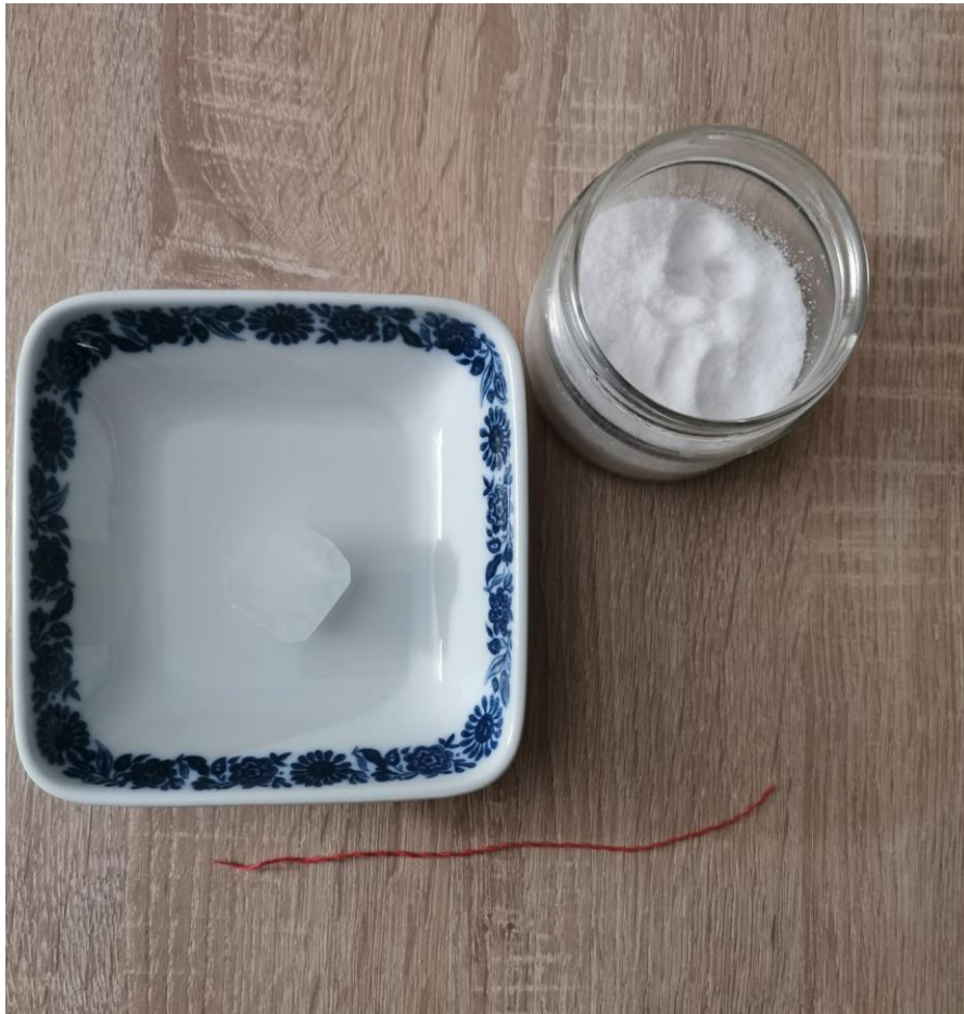
Slika 9 Led na konopcu.

Opis pokusa: Na kocku leda stavite konopac i pospite sol po tom dijelu leda. Ostavite nekoliko minuta sve bez diranja i promatrajte što se događa. Potom podignite konac držeći ga za kraj koji nije na ledu. Zapišite opažanja.