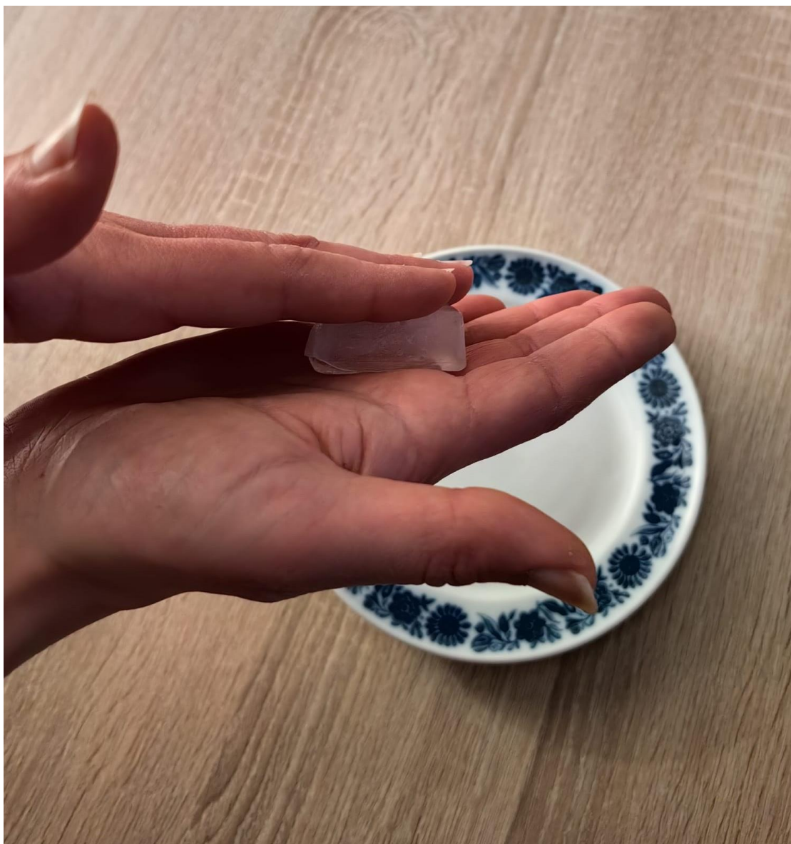
Slika 14 Otapanje leda trljanjem između dlanova.