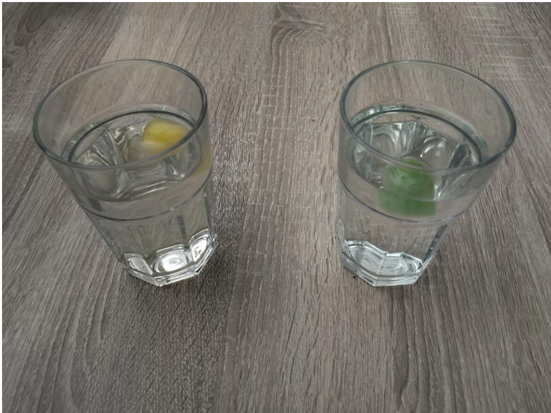
Slika 6 Žuta kocka leda nalazi se u slatkoj vodi, zelena u slanoj vodi.

Opis pokusa: Napunite dvije čaše vodom. U jednu dodajte par kapi jedne, a u drugu par kapi neke druge prehrambene boje. U primjeru na slici korištene su zelena i žuta boja za kolače. Napravite dvije kocke leda od tih otopina. Dvije čaše napunite jednakom količinom vode, idealno da voda bude jednake temperature. U jednu čašu dodajte jednu žličicu soli i dobro promiješajte tako da se sva sol otopi. Za ovaj pokus korištena je sitna morska sol. Odaberite kocku leda određene boje koju ćete ubaciti u slanu vodu i po tome pamтите u kojoj je čaši kakva voda. Sada, kada sadržaj obje čaše izgleda jednako ubacite kocke leda u čaše i pažljivo pratite promjene u čaši. Zabilježite opažanja. Radi boljeg uočavanja promjena u čašama, može se držati obični bijeli papir s druge strane čaša. Pričekajte da se obje kockice leda otope i promotrite otopine u čašama.