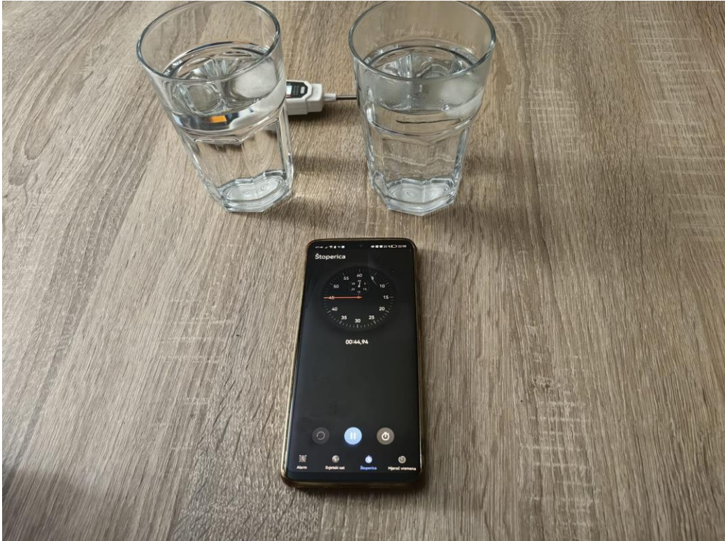
Slika 2 Kocke leda ubačene u čaše s hladnom (lijevo) i toplom (desno) vodom