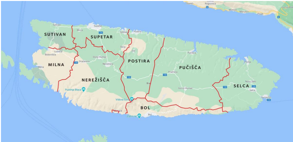
Sl. 2. Općine otoka Brača

jedna od najpopularnijih turističkih destinacija u srcu sezone, što zbog prirodnih ljepota i obale, a što zbog Zlatnog rata koji se u turističkom smislu probio na svjetsku scenu kao turistički fenomen i jedna od najpopularnijih plaža u ovom dijelu Jadrana.