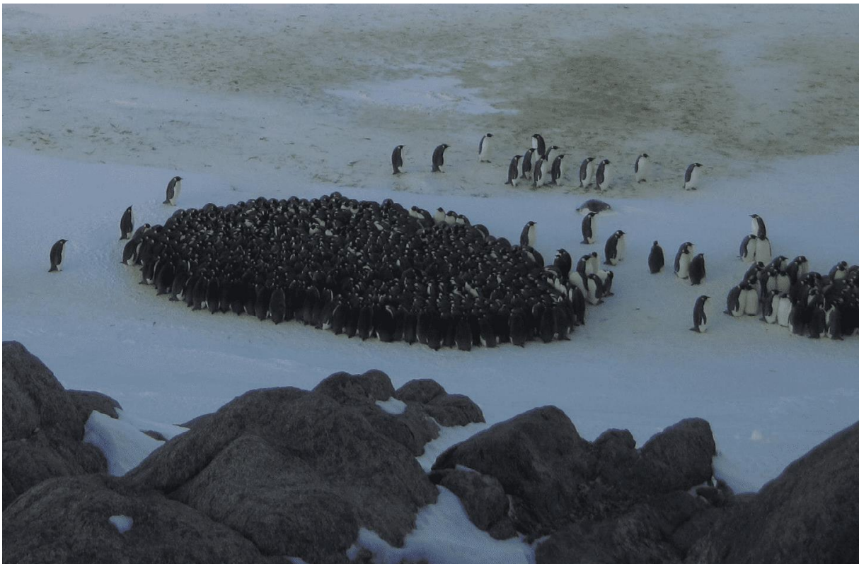
Slika 1. Carski pingvini zbijeni kako bi sačuvali toplinu ( Richter i sur. )

za zbijanjem, gube težinu dvostruko brže tijekom druge faze gladovanja ( Le Maho 1983 ). Tijekom druge faze, pingvini uopće ne reagiraju na pokušaje hvatanja od strane istraživača, dok u trećoj fazi povećavaju lokomotornu aktivnost za 8-15 puta, te pokazuju ekstremnu reakciju na pokušaje hvatanja ( Robin i sur. 1998 ). Ovakva promjena ponašanja, kao i napuštanje jaja se veže uz povećane razine kortikosteroida ( Groscolas i Robin 2001; Criscuolo i sur. 2005; Cockrem i sur. 2006 ). Razlog većih koncentracija kortikosteroida te samim time i povećanje aktivnosti je vjerojatno skraćivanje vremena provedenog u trećoj fazi gladovanja, zbog potencijalnih smrtnih posljedica ( Romero i Wingfield 2016 ).