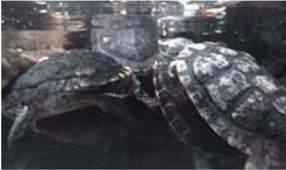
Slika 3. Uznemiravanje manje, novopridošle kornjače od strane većih mužjaka (preuzeto iz Davis, 2009)