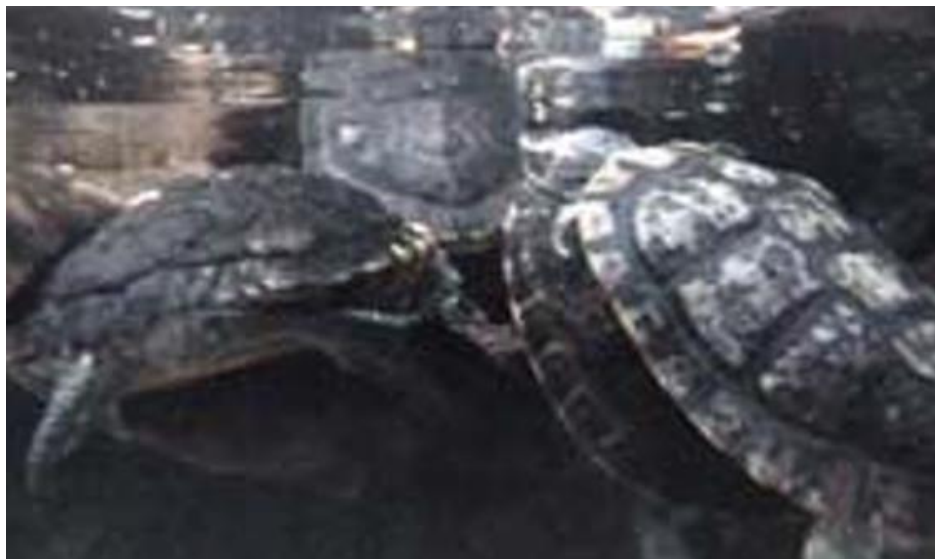
Slika 3. Uznemiravanje manje, novopridošle kornjače od strane većih mužjaka