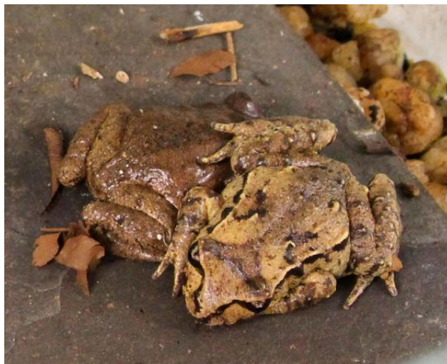
Slika 4. Primjer položaja u kojoj L. hamiltoni boravi u zaklonu na drugoj jedinci (preuzeto iz Lamb i sur., 2021).