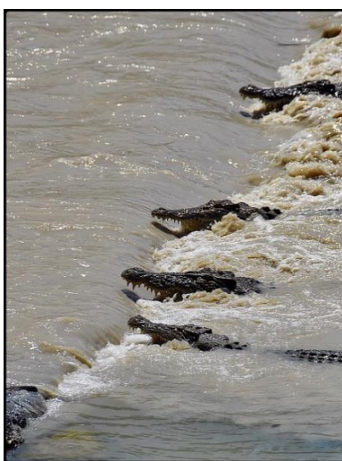
Slika 2. Strategija kooperativnog lova u krokodila

Američki aligatori, Alligator mississippiensis u sezoni parenja privlače pozornost drugih jedinki svojom aktivnošću te se formiraju velike grupe jedinki tijekom perioda udvaranja. Te grupe nisu statične već se kontinuirano mijenja njihova kompozicija, ovisno o tome kako parovi emigriraju i nove jedinke imigriraju (Vliet, 1989). Udvarački ples je najupečatljivija karakteristika socijalnog ponašanja američkog aligatora. On se izvodi u vodi i u njemu sudjeluje i do stotinjak jedinki u svrhu privlačenja ženki, ali i kao prikaz dominacije i obrane teritorija u mužjaka (Doody i sur., 2013).