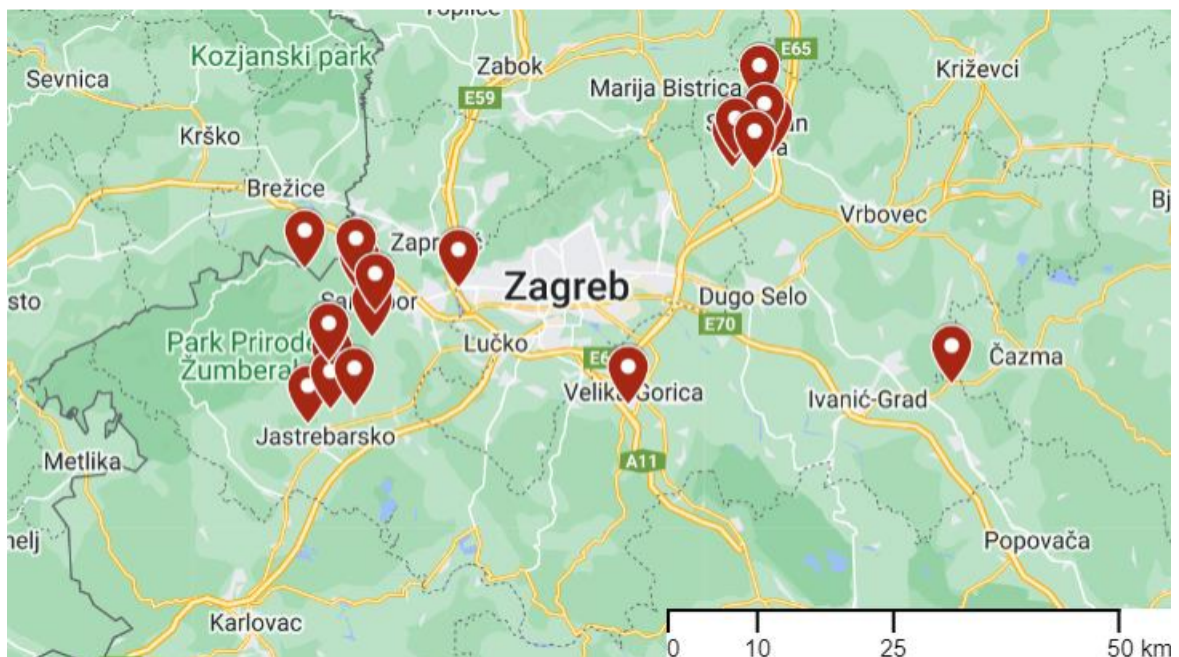
Sl. 8. Izletišta i seljačka turistička gospodarstva u Zagrebačkoj županiji

Slika 8. prikazuje smještaj svih navedenih izletišta i seljačkih turističkih gospodarstava na karti. Ona su prilično neravnomjerno raspoređena u županiji i koncentrirana su u zapadnom dijelu županije, u okolici Samobora i Jastrebarskog, te u sjeveroistočnom dijelu županije, u okolici Svetog Ivana Zeline. Osim toga, spomenuto je kako je pronađeno samo po jedno gospodarstvo na području Ivanić-Grada i Velike Gorice te je na karti jasno vidljiv nedostatak ovakvih gospodarstava u istočnom i južnom dijelu županije.