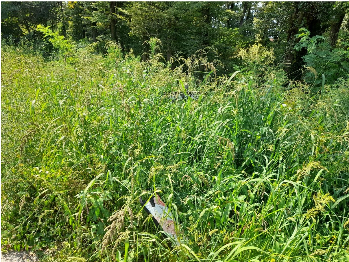
Sl. 4. Prvi putokaz za poučnu stazu na Martin bregu, gotovo neuočljiv u visokoj travi

staza, ali u cijeloj županiji ima ih veći broj (TZ Zagrebačke županije, 2024). Jedna od osam izdvojenih poučnih staza jest Staza kneževa, koja se nalazi kod naselja Budinjak u Parku prirode Žumberak – Samoborsko gorje. Ova je staza naročito zanimljiva jer se tu osim očuvane prirode i raznih geomorfoloških fenomena nalaze i arheološka nalazišta iz starijeg željeznog i rimskog doba. Arheološko nalazište iz starijeg željeznog doba uključuje naselje s bedemima te 140 grobnih humaka podno naselja. Ova je staza dobro uređena te je moguće i organizirati stručnu pratnju za posjetitelje (TZ grada Samobora, 2024). Međutim, nisu sve ovakve staze jednako dobro uređene i održavane. Jedan autoru poznat primjer je staza na Martin bregu u Dugom Selu. Šetnjom kroz šumu mogu se uočiti dva putokaza koja šetače usmjeravaju na spomenutu stazu.