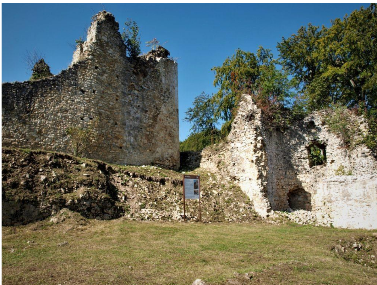
Sl. 3. Ruševine Zelingrada