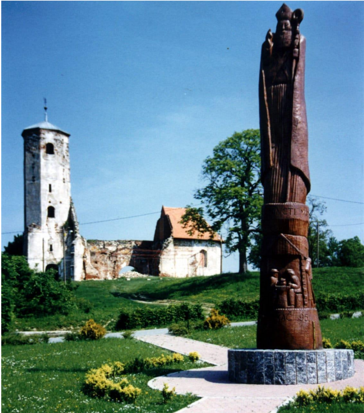
Sl. 7. Crkva svetog Martina na Martin bregu

(Institut za arheologiju, 2024). Ova crkva povijesno je i turistički značajna zbog svoje bogate povijesti i svjedočanstva o prisutnosti viteških redova u ovome kraju. Nažalost, crkva je nastradala u potresu 1880. godine kada se znatan dio građevine potpuno urušio, pa su danas vidljivi samo ostatci, prikazani na slici 7 (TZ Grada Dugog Sela, 2024).