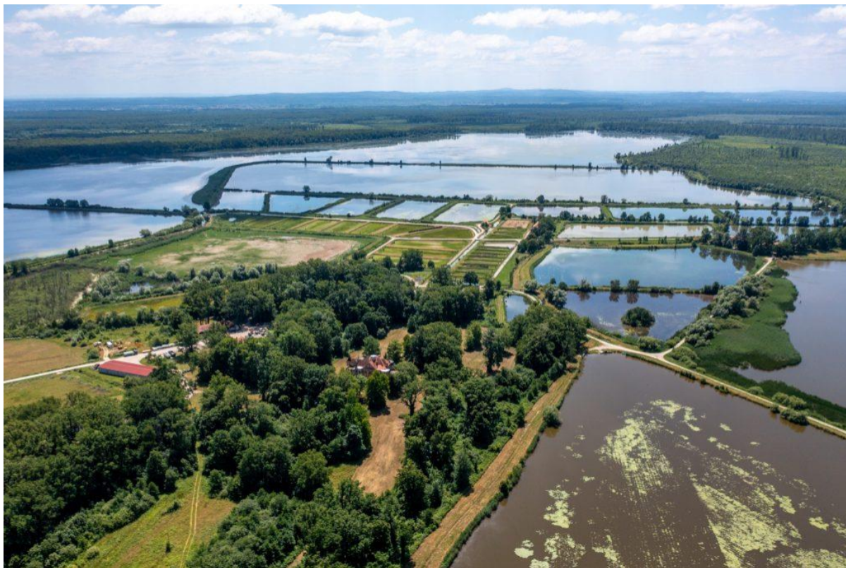
Sl. 2. Ribnjaci u posebnom rezervatu Crna mlaka

turističke posjete, ali ipak može imati određenu turističku ulogu, s obzirom da se preleti ptica, naročito u doba jesenske selidbe, mogu promatrati i s okolnih područja.