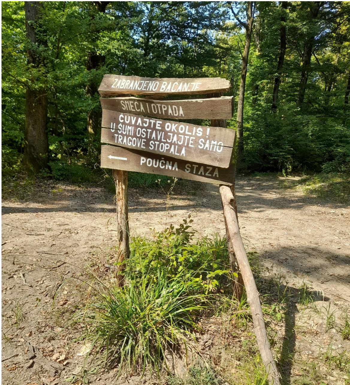
Sl. 5. Drugi putokaz za poučnu stazu, vjerojatno oštećen prilikom izvlačenja drva