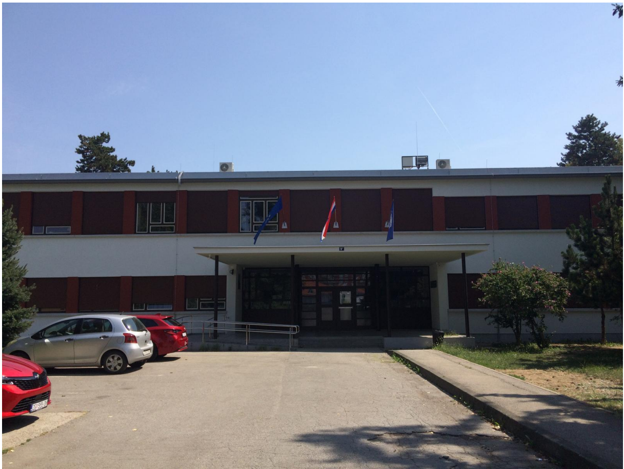
Sl. 10. OŠ Augusta Cesarca (fotografirano 16. 8. 2024.)

OŠ Augusta Cesarca (sl. 10) izgrađena je 1960. godine. Zgradi je potrebna obnova. Godine 2023. započelo se s energetsom obnovom zgrade. Unutarnji prostori zgrade redovito su održavani. Planirana su ulaganja u opremanje učionica na višu razinu za uspješnije poučavanje te zamjena vrata i prozora. U školi se nalazi jedna učionica za geografiju i povijest. Škola raspolaže sa 20 računala za učenike, kojima je potrebna zamjena.