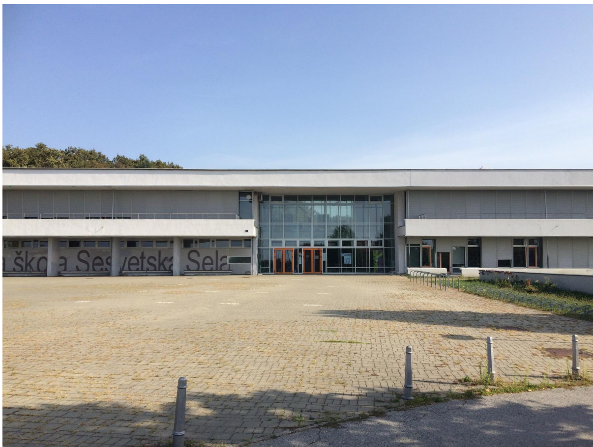
Sl. 44. OŠ Sesvetska Sela (fotografirano 18. 8. 2024.)

OŠ Jelkovec (sl. 45) izgrađena je 2008., a 2020. godine je nadograđena. Zgrada je obnovljena i ima svijetle i prozirne učionice opremljene računalima i projektorima. Planira se popravak prozora i projektoru u jednoj učionici, popravak rasvjetnih tijela u dvije učionice, popravak vrata za izlazak na terasu u jednoj učionici, popravak roleta u učionicama, zamjena dotrajalih računala, ugradnja klima-uređaja u učionice u kojima ih nema, sanacija sportske dvorane i uređenje dvorišta. U Godišnjem planu i programu nije naveden broj učionica za geografiju i povijest niti broj kabineta za geografiju i povijest. Škola raspolaže sa 55 stolnih i 100 prijenosnih računala te 665 tableta.