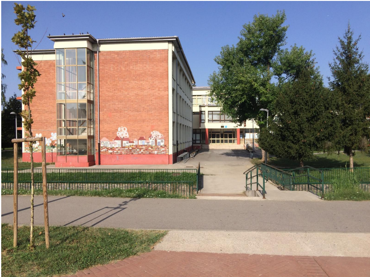
Sl. 36. OŠ Luka (fotografirano 18. 8. 2024.)

prostora za rad. U školi se nalazi jedna učionica za geografiju i jedna učionica za povijest. U Godišnjem planu i programu nije navedeno s koliko računala škola raspolaže.