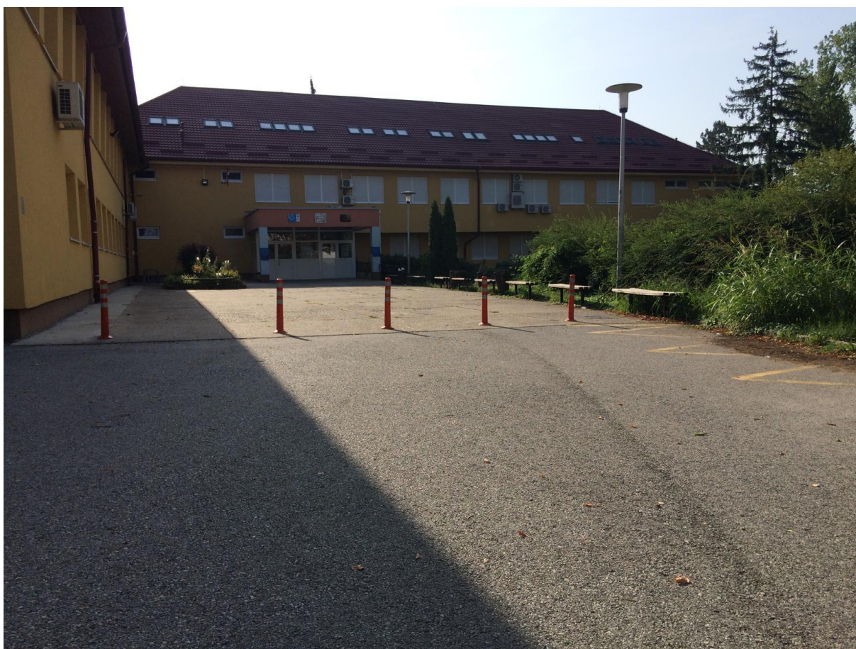
Sl. 35. OŠ Sesvete (fotografirano 18. 8. 2024.)

OŠ Sesvete (sl. 35) izgrađena je 1954. godine. Zgrada je obnovljena, a planira se: izgradnja nove školske dvorane, opremanje učionica nastavnim pomagalicama (globus, projektori i sl.), opremanje školske dvorane potrebnim pomagalicama, nabava namještaja (klupe i stolice), bojanje zidova u učionicama i ostalim prostorijama, te prema potrebi, obnova informatičke, audiovizualne i druge dotrajale opreme. U školi se nalaze dvije učionice za geografiju i povijest. Škola raspolaže sa 68 računala, 99 prijenosnih računala i 498 tableta.