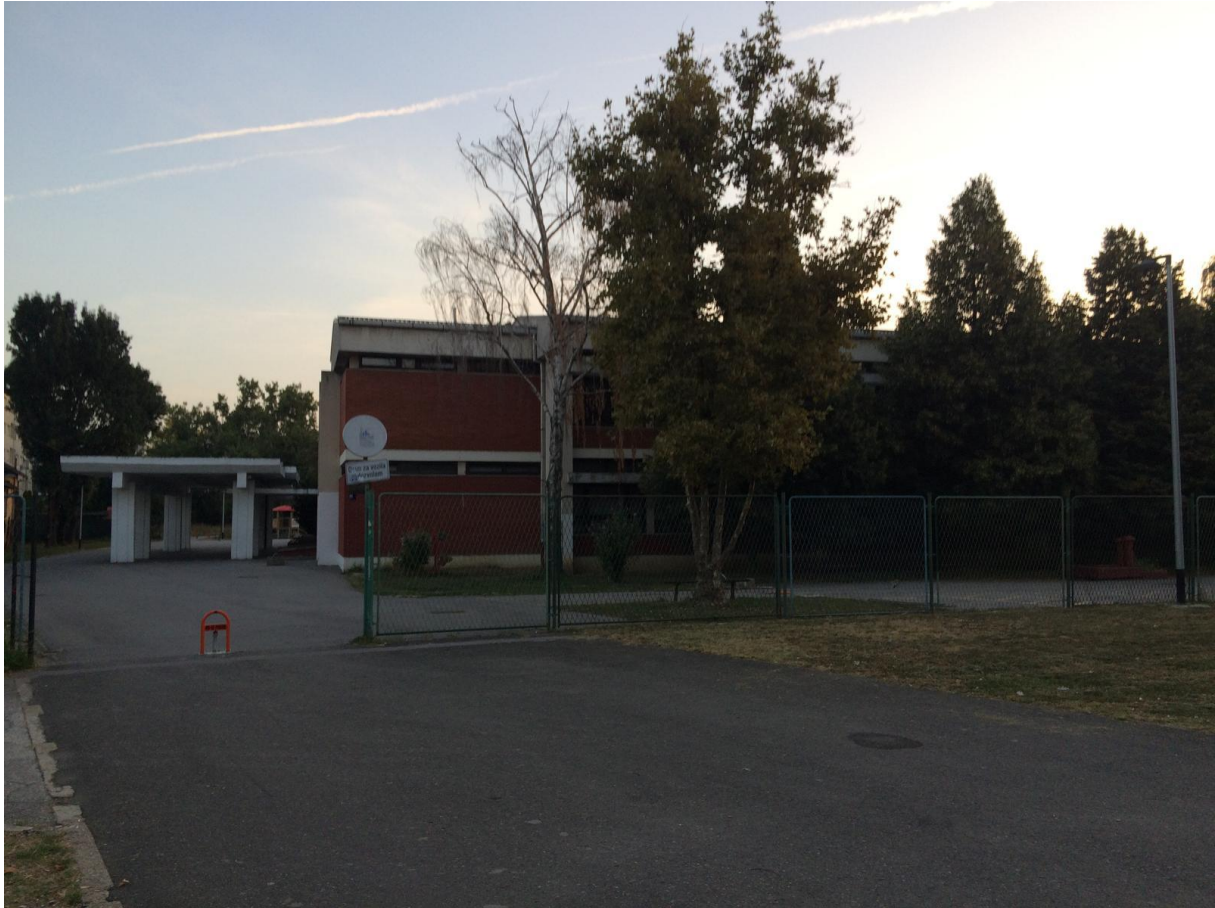
Sl. 9. OŠ Rudeš (fotografirano 16. 8. 2024.)