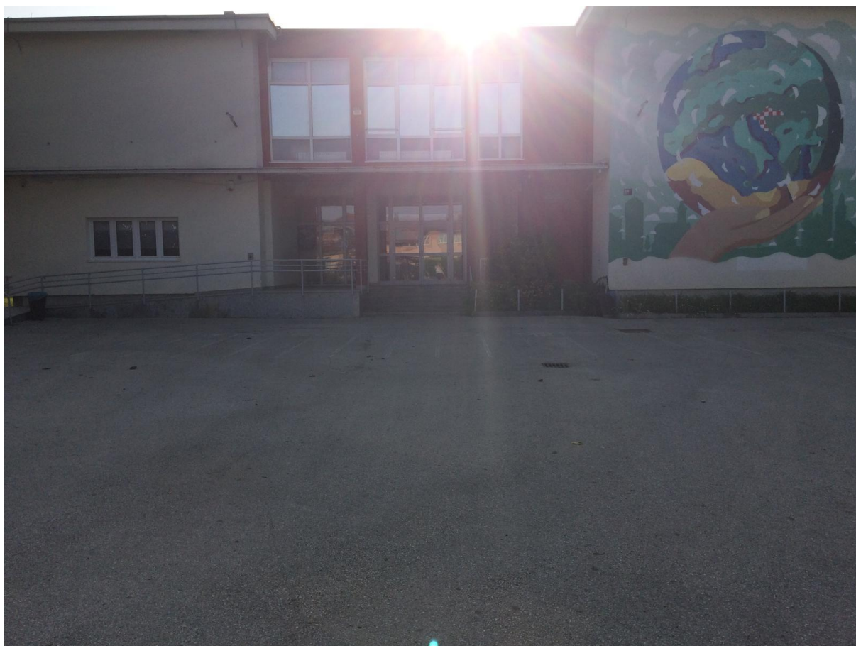
Sl. 37. OŠ Sesvetski Kraljevec (fotografirano 18. 8. 2024.)

OŠ Vugrovec-Kašina (sl. 38) izgrađena je 1947., 1958. godine dograđeno je devet prostorija, a 1981. godine dograđena je montažna sportska dvorana. Zgrada je uglavnom obnovljena. Škola nema dovoljno prostora, tako da bi dogradnja škole bila potrebna. Godine 2016. uveden je gradski vodovod. Nakon potresa u Gradu Zagrebu 2020. godine, obnovljen je unutrašnji prostor i ugrađena je LED rasvjeta. Planira se: nadogradnja škole, izgradnja nove kotlovnice i uvođenje plina, uređenje fasade, uređenje zidova u hodnicima, zatim brušenje i lakiranje parketa u učionicama, uređivanje informatičke učionice, ali i nabava novog namještaja za učionice, prije svega klupe i stolice. U Godišnjem planu i programu se ne navodi broj učionica za geografiju i povijest, kao niti broj računala s kojima škola raspolaže. Škola ima jednu učionicu za geografiju i povijest.