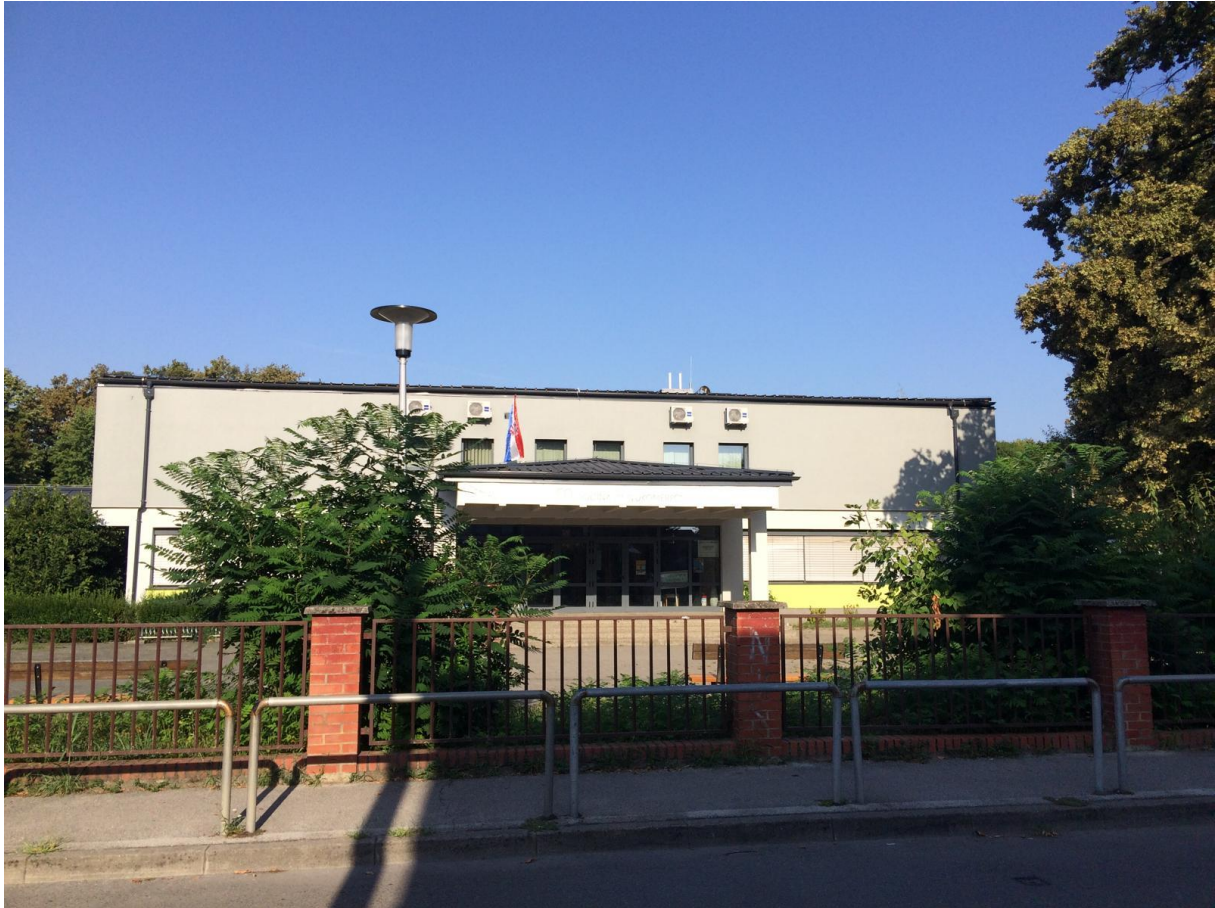
Sl. 13. OŠ Vukomerec (fotografirano 16. 8. 2024.)

OŠ Frana Krste Frankopana (sl. 14) izgrađena je 1952. godine. Zgrada je obnovljena, što podrazumijeva završenu energetska obnovu, obnovljeni su fasada i krov, obojene su unutarnje prostorije i zamijenjeni su prozori, međutim ima još nekih radova koje je potrebno obaviti, a to su: zamjena unutarnjih vrata, zamjena parketa u učionicama predmetne nastave, zamjena namještaja te sanacija sportskih terena. Broj učionica za geografiju nije naveden. Škola raspolaže sa 65 računala, od toga 40 računala je starije od 7 godina, a prije 5 godina, odnosno školske godine 2019./2020. nabavljeno je 10 računala.