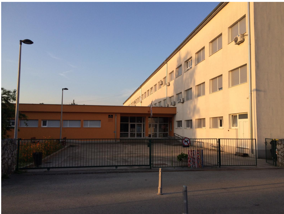
Sl. 3. OŠ Grigora Viteza (fotografirano 16. 8. 2024.)

OŠ Tina Ujevića (sl. 4) izgrađena je 1935. godine. Zgrada se djelomično obnavlja posljednjih 20 godina. Do 2024. završeni su sljedeći radovi: prenamjena prostorija, obnovljena fasada, zamjena vrata, prozora i podova, završena energetska obnova škole i izgrađena nova školska dvorana. U školi se nalazi jedna učionica za geografiju. Škola raspolaže sa 60 računala, a 2023. godine nabavljeno je 21 prijenosno računalo za informatičku učionicu.