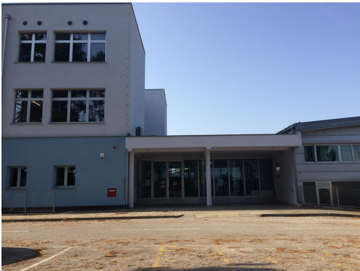
Sl. 39. PŠ Vugrovec (fotografirano 18. 8. 2024.)

OŠ Ivana Grande (sl. 40) izgrađena je 1958., a 2003. godine je dograđena. Godine 2015. izgrađeno je školsko igralište. Zgradi je potrebna obnova i dogradnja, zbog toga što unutrašnji prostor postaje neadekvatan za broj razrednih odjela. Planira se sanacija podruma, dogradnja školskog prostora (2019. godine napravljen je projektni zadatak za dogradnju učionica). Do 2027. godine planira se završiti dogradnja škole, međutim ona još nije počela. Također planira se i nabava novih računala za učenike, kao i prenamjena i obnova prostora (sanacija učionica). U školi se nalazi jedna učionica za geografiju i povijest te jedan kabinet za geografiju i povijest. Škola je tijekom godina redovito opremana nastavnim sredstvima i pomagalicama, tako da većina učionica ima projektore. U školskoj godini 2021./2022. u školu je uveden bežični Internet. Za informatičku učionicu potrebno je nabaviti nova računala. U Godišnjem planu i programu nije naveden broj računala s kojima škola raspolaže.