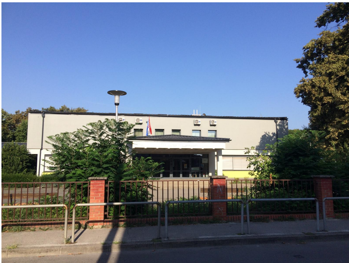
Sl. 13. OŠ Vukomerec (fotografirano 16. 8. 2024.)

OŠ Frana Krste Frankopana (sl. 14) izgrađena je 1952. godine. Zgrada je obnovljena, što podrazumijeva završenu energetska obnovu, obnovljeni su fasada i krov, obojene su unutarnje prostorije i zamijenjeni su prozori, međutim ima još nekih radova koje je potrebno obaviti, a to su: zamjena unutarnjih vrata, zamjena parketa u učionicama predmetne nastave, zamjena namještaja te sanacija sportskih terena. Broj učionica za geografiju nije naveden. Škola raspolaže sa 65 računala, od toga 40 računala je starije od 7 godina, a prije 5 godina, odnosno školske godine 2019./2020. nabavljeno je 10 računala.