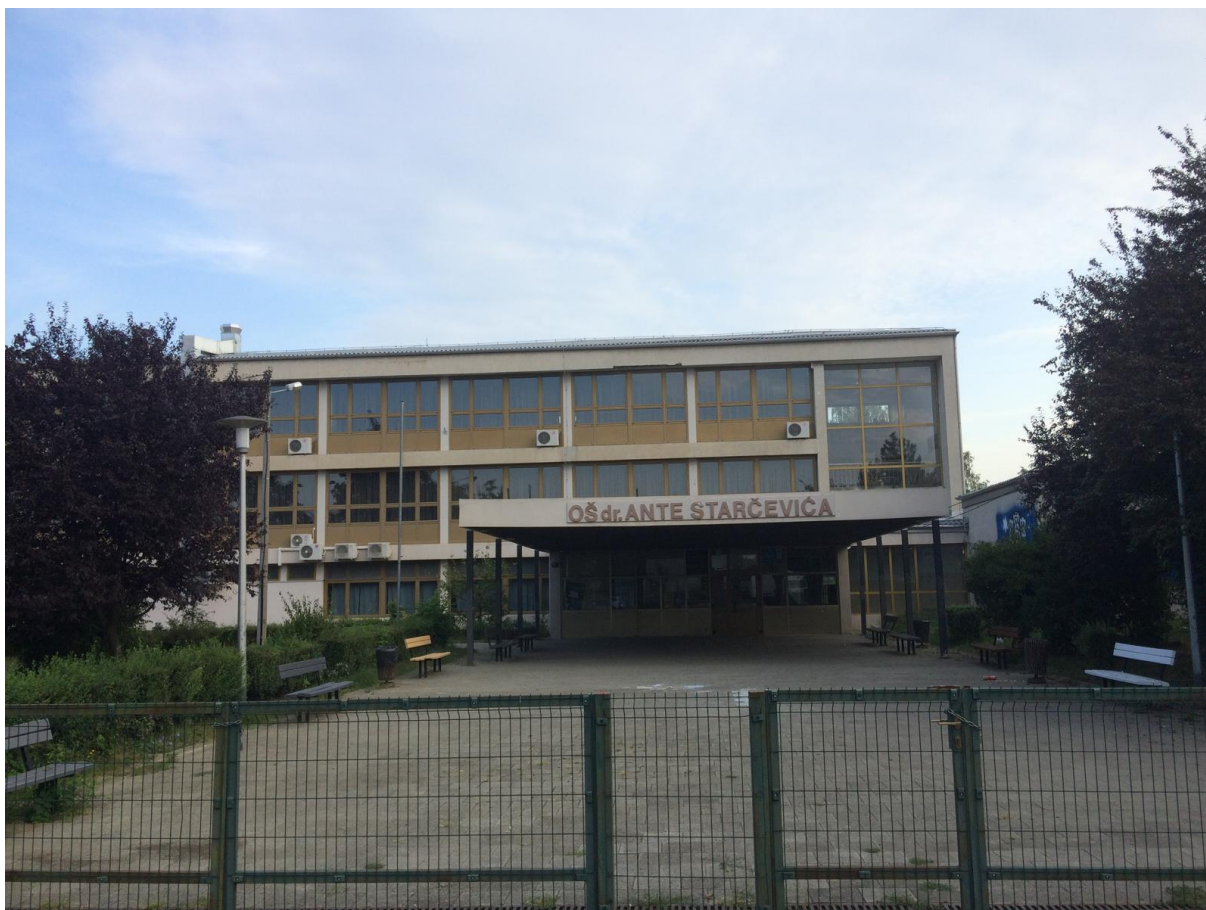
Sl. 29. OŠ dr. Ante Starčevića (fotografirano 17. 8. 2024.)

OŠ Vjenceslava Novaka (sl. 30) izgrađena je 1971. godine. Zgrada je uglavnom obnovljena i planirana su ulaganja: završavanje rekonstrukcije elektro-instalacija, ugradnja klima-uređaja, dogradnja škole koja podrazumijeva dogradnju učionica, proširenje knjižnice i proširenje školske dvorane. Također, prema potrebi, planira se dopunjavanje informatičke opreme. U školi se nalazi jedna učionica za geografiju i jedna učionica za povijest. Škola raspolaže sa 83 računala. Inače, škola ima zadovoljavajuću opremljenost nastavnim sredstvima i pomagalicama, koja će se dopunjavati ovisno o potrebi nastavnika.