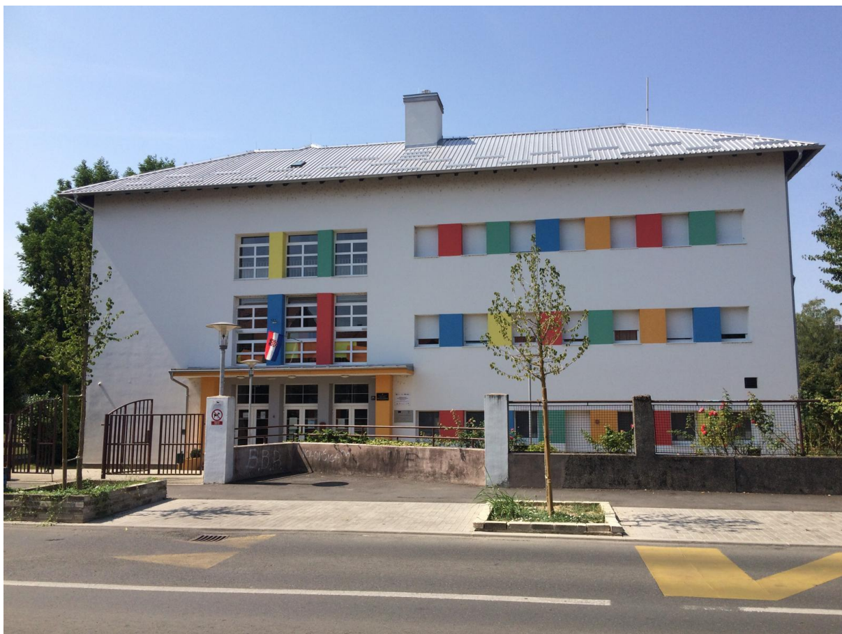
Sl. 14. OŠ Frana Krste Frankopana (fotografirano 16. 8. 2024.)

OŠ Lovre pl. Matačića (sl. 15) izgrađena je 1962. godine. Zgrada je obnovljena što podrazumijeva novu fasadu, novi krov te nove prozore i vrata. Potrebna je zamjena elektro i ostalih instalacija. Školska dvorana je adaptirana. Trenutno se izvode radovi na školskom igralištu. U školi se nalazi jedna učionica za geografiju i povijest. Škola raspolaže sa 50 računala i 35 prijenosnih računala.