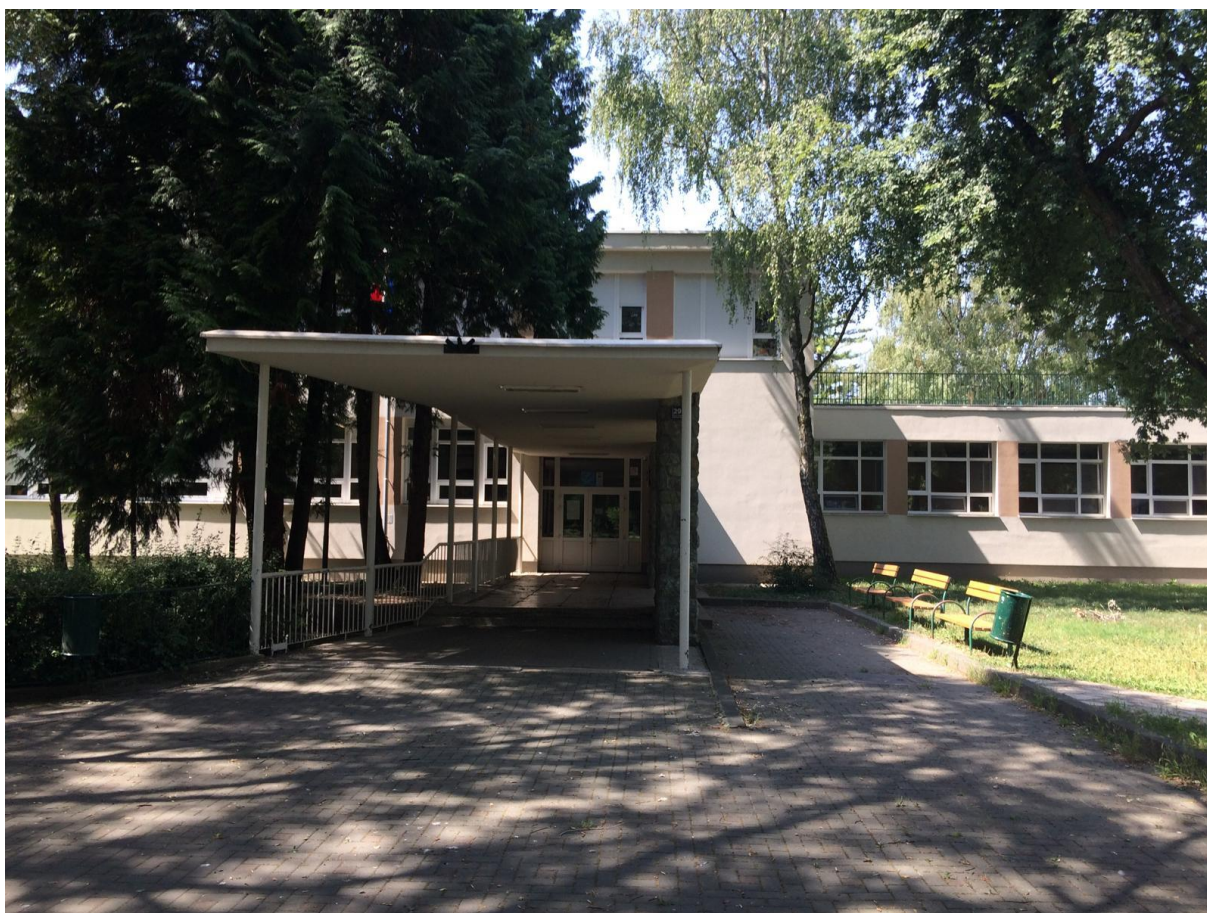
Sl. 11. OŠ Dobriše Cesarića (fotografirano 16. 8. 2024.)

OŠ Žitnjak (sl. 12) postoji još od 1911., ali od školske godine 2000./2001. nalazi se na novoj lokaciji u Petruševcu. Zgrada je novije gradnje s puno staklenih površina. Zgrada je obnovljena, ali su planirana ulaganja u soboslikarske radove, nabavu novih nastavnih sredstava i pomagala, opremanje učionica novim stolovima i stolicama, zamjenu dotrajale informatičke opreme, lakiranje parketa. Također potrebna je ugradnja klima-uređaja. U nekoliko navrata poplava je podigla parket, ali je taj problem sada riješen. Sve učionice su opremljene računalima i projektorima. U školi se nalazi jedna učionica za geografiju i povijest. Škola raspolaže sa 24 prijenosna računala u informatičkoj učionici.