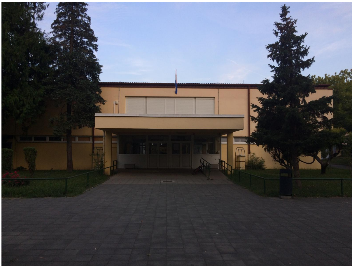
Sl. 30 OŠ Vjenceslava Novaka (fotografirano 17. 8. 2024.)

OŠ Žuti brijeg (sl. 31) izgrađena je 1983. godine. Zgrada je uglavnom obnovljena. Unutarnji prostor je adekvatan za ostvarivanje odgojno-obrazovnih zadaća i programa. U planu je ugradnja klima-uređaja u šest učionica, sanacija i uređenje učionica nakon odlaska OŠ Bukovac iz prostora škole, zatim uređenje školskog dvorišta i postavljanje novih klupa i stolica te sanacija dotrajalih. U školi se nalazi jedna učionica i jedan kabinet za geografiju te jedna učionica i jedan kabinet za povijest. Škola je informatički u potpunosti opremljena i raspolaže sa 110 računala.