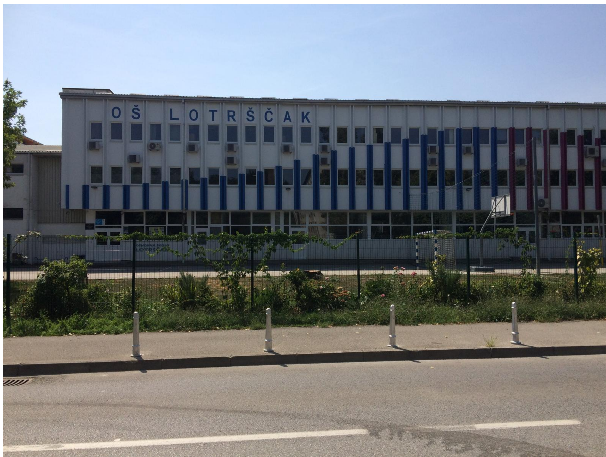
Sl. 21. OŠ Lotrščak (fotografirano 16. 8. 2024.)

OŠ Ružičnjak (sl. 22) započela je s radom 2015., a od školske godine 2019. /2020. na ovoj je adresi. Zgrada je obnovljena, a planira se obnova unutarnjeg i vanjskog prostora škole. Učenici od 5. do 8. razreda, odnosno svaki pojedini razred ima svoju učionicu. Škola raspolaže sa 20 stolnih i 25 prijenosnih računala te 56 tableta za učenike.