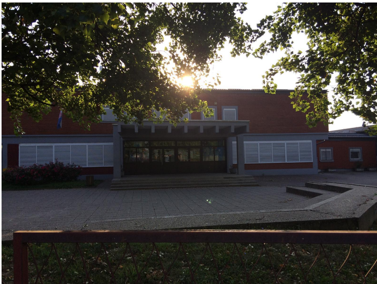
Sl. 17. OŠ dr. Vinka Žganca (fotografirano 16. 8. 2024.)

OŠ Dragutina Kušlana (sl. 18) postoji od 1936., a u ovoj zgradi nalazi se od 1956. godine. Škola koristi manje od 50 % prostora ove zgrade, zbog toga što prostor dijeli s 3. gimnazijom. Zgrada je obnovljena. Tijekom godina završeni su brojni poslovi: sanirani su svi sanitarni čvorovi u zgradi, zamijenjena su sva vrata i prozori, sanirana je velika dvorana za TZK, uređeni su vanjski sportski tereni, promijenjeni su električni vodovi, oličene su učionice i hodnici, sanirana je fasada. Potrebna je nabava školskog namještaja u svim učionicama, nova računala za informatičku učionicu, zamjena parketa u svim učionicama, sanacija školskog igrališta. Nakon potresa u Gradu Zagrebu 2020. godine odrađena je sanacija zgrade. U školi se nalazi jedna učionica za geografiju. U informatičkoj učionici nalazi se 15 računala. Nabavljeno je nekoliko novih računala, a ostala su stara više od 10 godina.