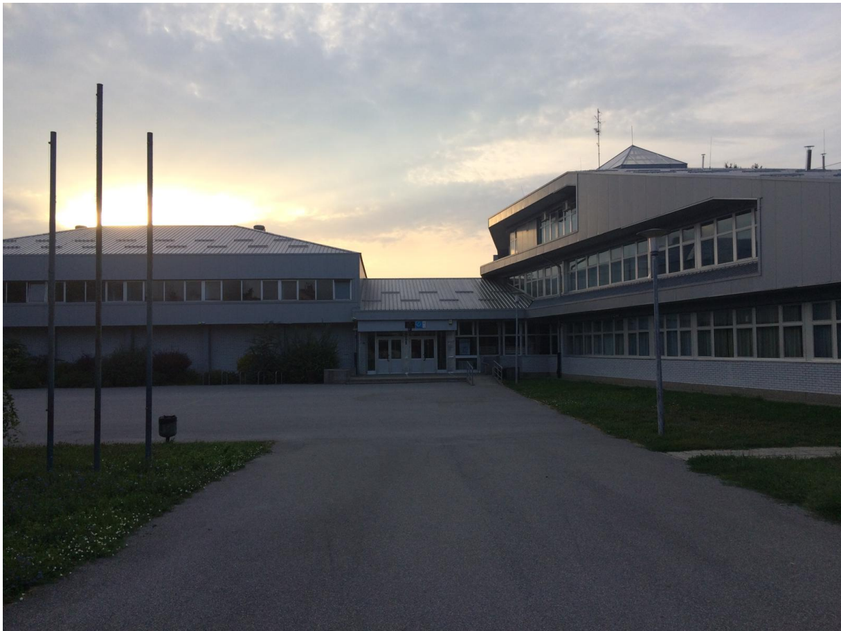
Sl. 28. OŠ Antuna Branka Šimića (fotografirano 17. 8. 2024.)

OŠ dr. Ante Starčevića (sl. 29) izgrađena je 1960. godine. Zgrada je obnovljena, a to podrazumijeva: drvena stolarija je zamijenjena aluminijskom u cijeloj školi, nakon potresa obnovljeni su svi unutarnji prostori, zamijenjena je kotlovnica, sve učionice su klimatizirane, zamijenjena je rasvjeta i postavljena je LED rasvjeta, zatim popravljeni i oličeni su zidovi u svim prostorijama, obnovljeni su parketi, zamijenjene su klupe i stolice, uređeni su sanitarni čvorovi. Potrebno je zamijeniti računala u učionicama. U školi se nalazi jedna učionica za geografiju i povijest. Škola raspolaže sa 97 računala, od toga 24 prijenosna računala u informatičkoj učionici. Sve učionice imaju računalo i projektor. Škola je dobro opremljena nastavnim sredstvima i pomagalicima.