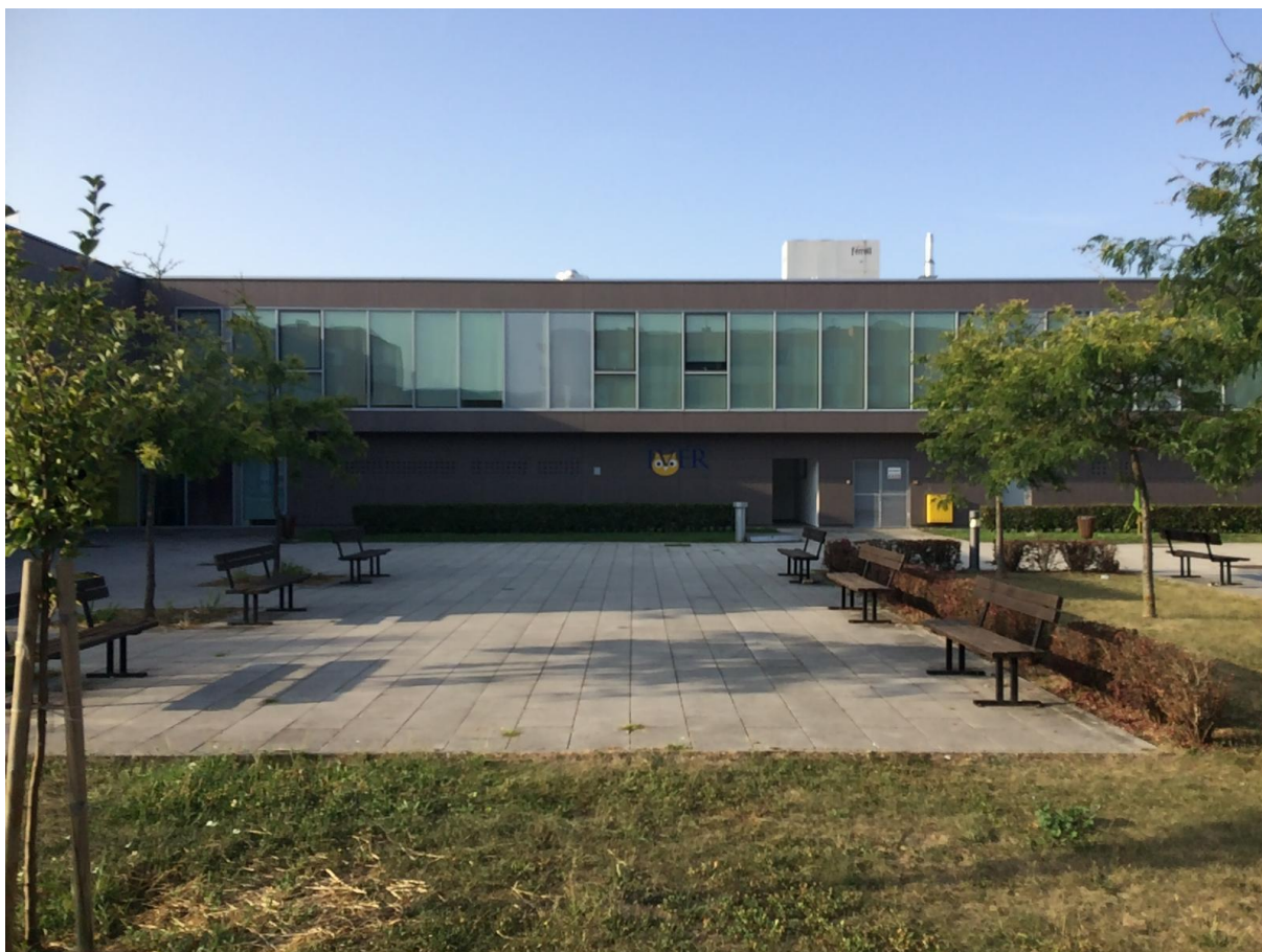
Sl. 46. OŠ Iver (fotografirano 18. 8. 2024.)

Istraživanjem stanja školskih zgrada, odnosno jesu li vanjski zidovi i unutarnji zidovi obnovljeni u posljednjih pet godina, ima li škola specijaliziranu učionicu za geografiju i/ili kabinet za geografiju te koliko je prosječno učenika na jedno stolno ili prijenosno računalo, dobiveni su sljedeći rezultati. Vanjski zidovi kod 87 % promatranih škola su obnovljeni u posljednjih pet godina, a kod 13 % škola vanjski zidovi nisu obnovljeni u posljednjih pet godina. Unutrašnjost je kod 54 % škola obnovljena, a kod 46 % škola nije obnovljena u posljednjih pet godina. Čak 89 % škola ima specijaliziranu učionicu za geografiju, a samo 39 % kabinet za geografiju. Istraživanje je pokazalo kako 11 % škola nema specijaliziranu učionicu za geografiju, a 61 % nema kabinet za geografiju. Za devet škola na promatranom području nije navedeno s koliko računala raspolažu. Na jedno stolno ili prijenosno računalo u pet gradskih četvrti Grada Zagreba u prosjeku dolazi osam učenika.