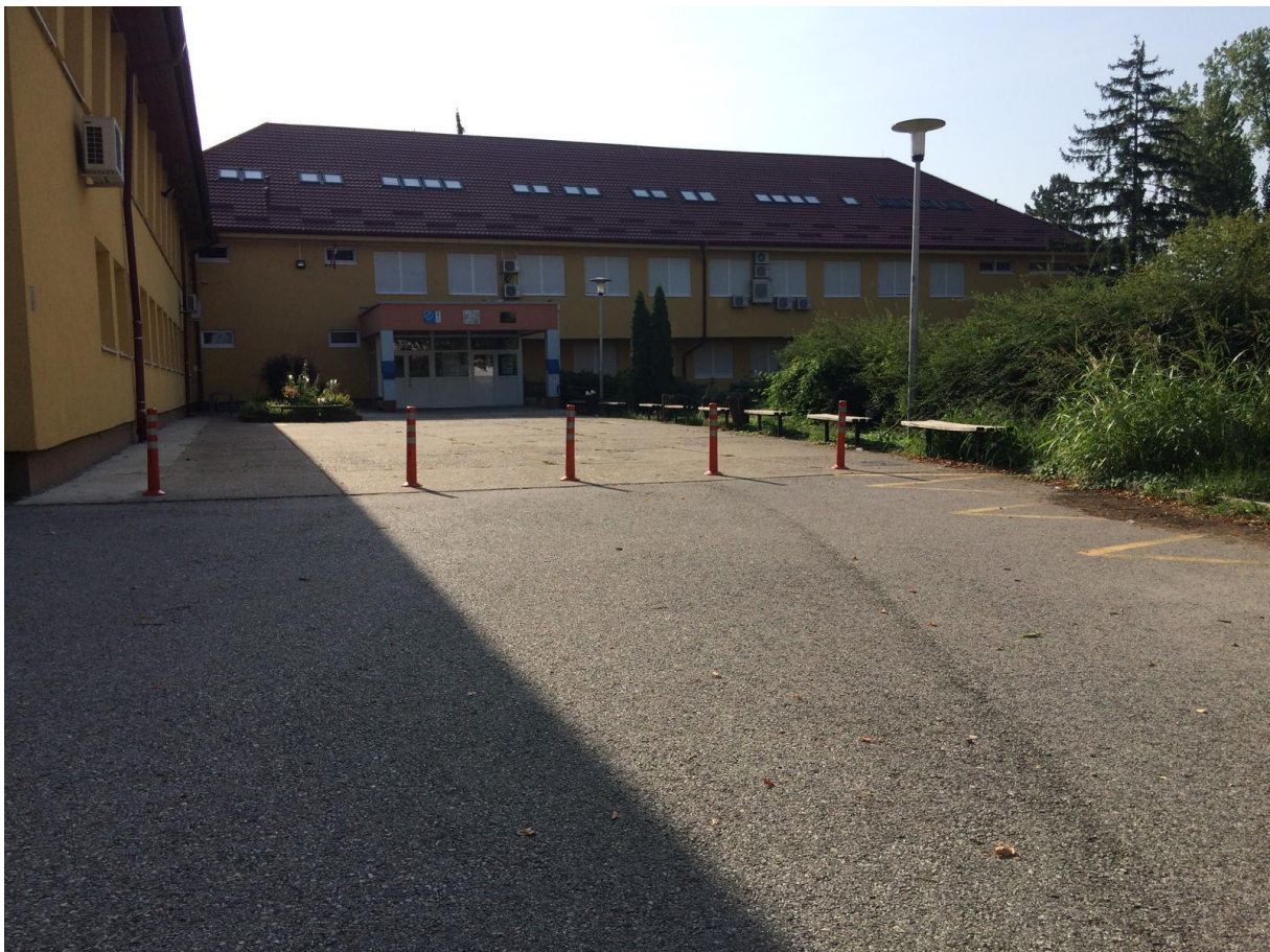
Sl. 35. OŠ Sesvete (fotografirano 18. 8. 2024.)

OŠ Sesvete (sl. 35) izgrađena je 1954. godine. Zgrada je obnovljena, a planira se: izgradnja nove školske dvorane, opremanje učionica nastavnim pomagalicama (globus, projektori i sl.), opremanje školske dvorane potrebnim pomagalicama, nabava namještaja (klupe i stolice), bojanje zidova u učionicama i ostalim prostorijama, te prema potrebi, obnova informatičke, audiovizualne i druge dotrajale opreme. U školi se nalaze dvije učionice za geografiju i povijest. Škola raspolaže sa 68 računala, 99 prijenosnih računala i 498 tableta.