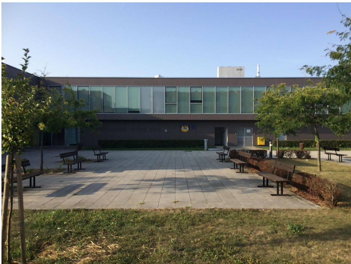
Sl. 46. OŠ Iver (fotografirano 18. 8. 2024.)

Istraživanjem stanja školskih zgrada, odnosno jesu li vanjski zidovi i unutarnji zidovi obnovljeni u posljednjih pet godina, ima li škola specijaliziranu učionicu za geografiju i/ili kabinet za geografiju te koliko je prosječno učenika na jedno stolno ili prijenosno računalo, dobiveni su sljedeći rezultati. Vanjski zidovi kod 87 % promatranih škola su obnovljeni u posljednjih pet godina, a kod 13 % škola vanjski zidovi nisu obnovljeni u posljednjih pet godina. Unutrašnjost je kod 54 % škola obnovljena, a kod 46 % škola nije obnovljena u posljednjih pet godina. Čak 89 % škola ima specijaliziranu učionicu za geografiju, a samo 39 % kabinet za geografiju. Istraživanje je pokazalo kako 11 % škola nema specijaliziranu učionicu za geografiju, a 61 % nema kabinet za geografiju. Za devet škola na promatranom području nije navedeno s koliko računala raspolažu. Na jedno stolno ili prijenosno računalo u pet gradskih četvrti Grada Zagreba u prosjeku dolazi osam učenika.