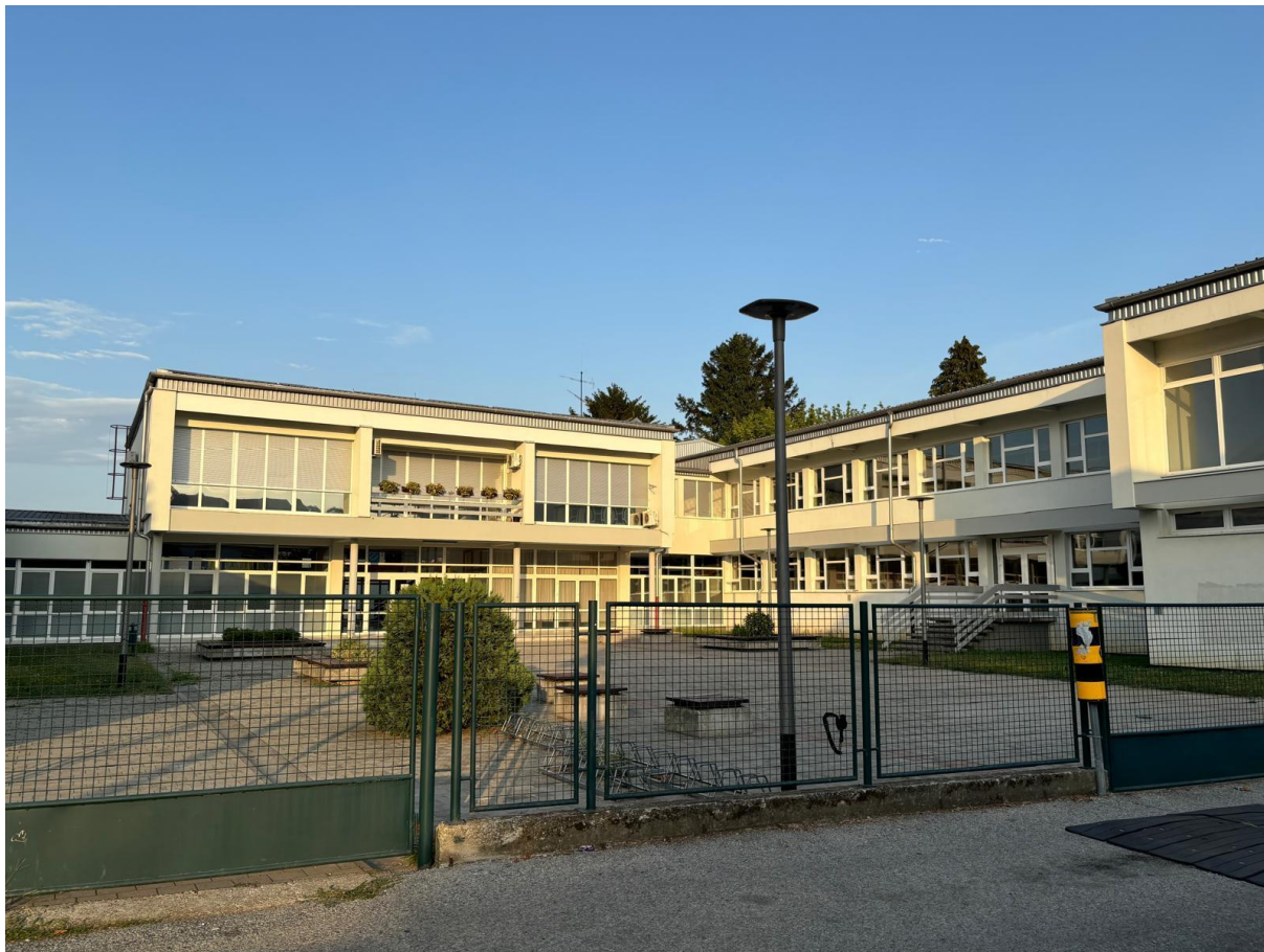
Sl. 33. OŠ Ivana Mažuranića (fotografirano 16. 8. 2024.)

jedan kabinet za geografiju i povijest. Škola je informatički u potpunost opremljena, raspolaže sa 126 računala, 10 prijenosnih računala (49 prijenosnih računala CARNET-a) i 1 tablet (355 CARNET tableta).