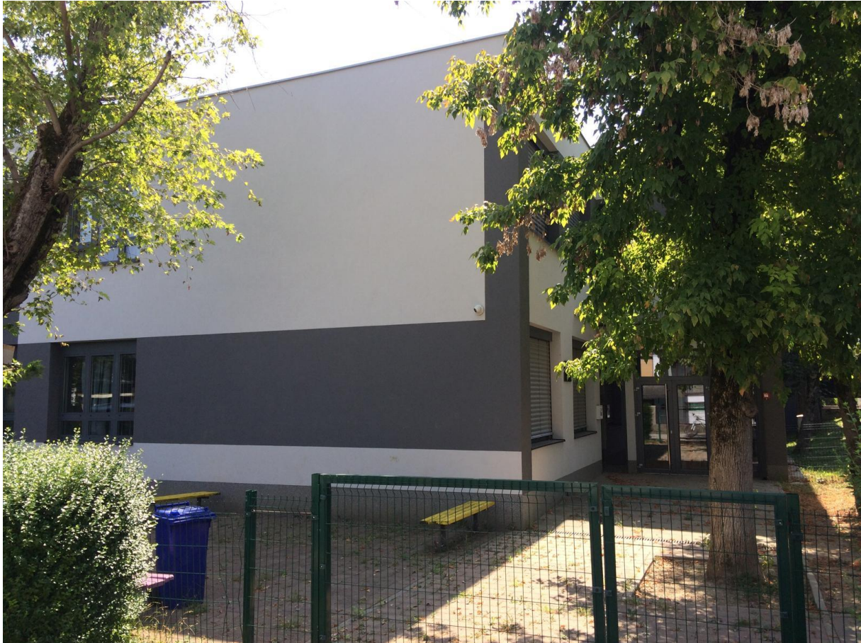
Sl. 20. Prva katolička OŠ u Gradu Zagrebu (fotografirano 16. 8. 2024.)

OŠ Lotrščak (sl. 21) započela je s radom 2016. godine. Zgrada je uglavnom obnovljena. Planiraju se ulaganja u uređenje sportske dvorane, sanitarnih čvorova, uređenje školskog igrališta, obnovu fasade i uređenje učionica. Škola ima osam učionica predmetne nastave za učenike od 5. do 8. razreda. Škola raspolaže sa 44 stolna i 95 prijenosnih računala te 79 tableta za učenike.