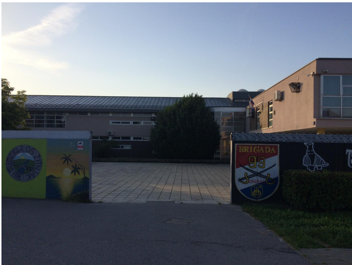
Sl. 12. OŠ Žitnjak (fotografirano 16. 8. 2024.)

OŠ Vukomerec (sl. 13) izgrađena je 1973. godine. Zgrada se postupno obnavlja. Svojom veličinom, funkcionalnošću i opremljenošću, zgrada u određenoj mjeri ne zadovoljava potrebe učenika zbog velikog broja razrednih odjela. Potrebna je obnova krovšta, energetska obnova, obnova parketa i pločica te bojanje unutarnjih prostora. Završena je obnova fasade te zamjena vrata i prozora. U školi se nalazi jedna učionica za geografiju i povijest te jedan kabinet za geografiju i povijest. Škola raspolaže sa 67 računala.