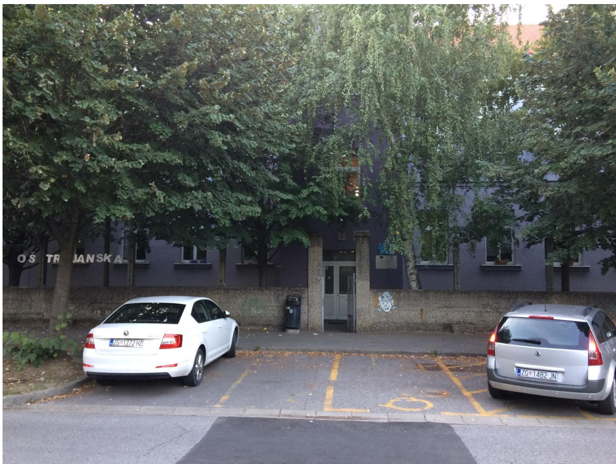
Sl. 8. OŠ Trnjanska (fotografirano 16. 8. 2024.)

OŠ Rudeš (sl. 9) izgrađena je 1987. godine. Zgrada je u dobrom stanju, ali je potrebno ličenje učionica, brušenje i lakiranje parketa u učionicama, adaptacija školske kuhinje, zamjena preostalih drvenih prozora plastičnim prozorima. U školi se nalazi jedna učionica za geografiju i povijest te jedan kabinet za geografiju i povijest. Škola ima svoje školsko dvorište i igralište. Škola raspolaže sa 86 računala, od toga 29 računala u informatičkoj učionici, 12 računala u učionicama predmetne nastave i 21 prijenosno računalo.