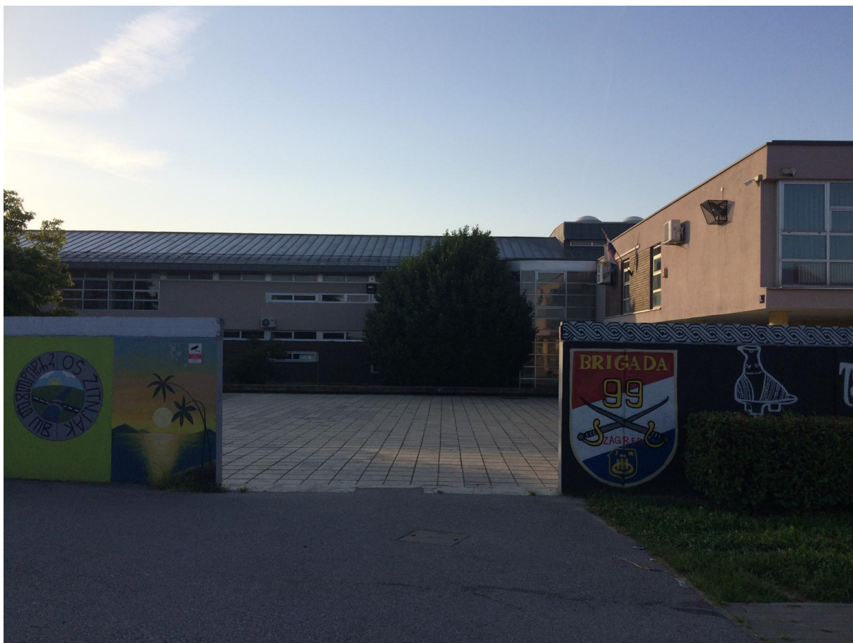
Sl. 12. OŠ Žitnjak (fotografirano 16. 8. 2024.)

OŠ Vukomerec (sl. 13) izgrađena je 1973. godine. Zgrada se postupno obnavlja. Svojom veličinom, funkcionalnošću i opremljenošću, zgrada u određenoj mjeri ne zadovoljava potrebe učenika zbog velikog broja razrednih odjela. Potrebna je obnova krovišta, energetska obnova, obnova parketa i pločica te bojanje unutarnjih prostora. Završena je obnova fasade te zamjena vrata i prozora. U školi se nalazi jedna učionica za geografiju i povijest te jedan kabinet za geografiju i povijest. Škola raspolaže sa 67 računala.