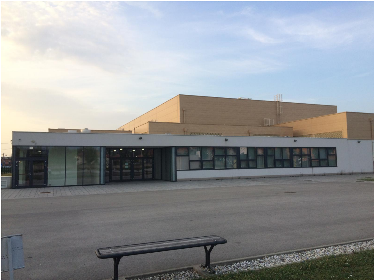
Sl. 27. OŠ Granešina (fotografirano 17. 8. 2024.)

OŠ Antuna Branka Šimića (sl. 28) izgrađena je 1992. godine. Zgradi je potrebna obnova i dogradnja. Neke prostorije u školi su premale, a potrebno je i uređenje školskog dvorišta. Planirana je dogradnja 13 do 15 učionica (za rad u 1 smjeni), dogradnja i povećanje kapaciteta školske kuhinje, blagovaonice, knjižnice i školske dvorane. Uz navedene zahvate, planira se i obnova drvene i limene stolarije, kao i parketa u svim učionicama. Potrebno je promijeniti zavjese u većini učionica, a u učionicama predmetne nastave na stropove treba postaviti knauf ploče. U školi se nalazi jedna učionica za geografiju i povijest te jedan kabinet za geografiju i povijest. Škola raspolaže sa 65 računala, od toga su 24 računala za učenike u informatičkoj učionici. Sve učionice imaju računalo i projektor.