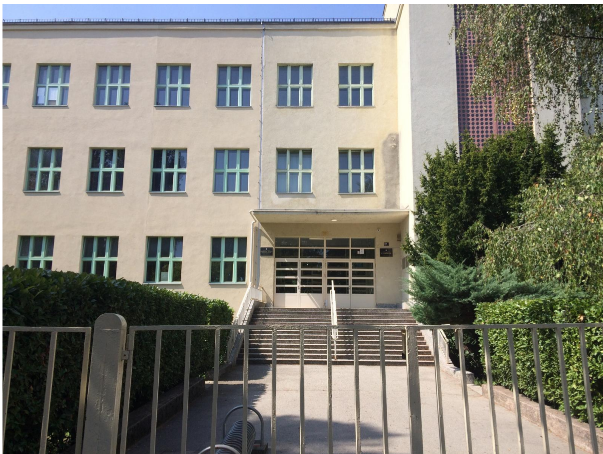
Sl. 18. OŠ Dragutina Kušlana (fotografirano 16. 8. 2024.)

OŠ Borovje (sl. 19) izgrađena je 2005. godine. Zgrada se obnavlja, a planira se uređenje učionica, nadogradnja škole, ugradnja klima-uređaja i nabava novih računala. U školi se nalazi jedan kabinet za geografiju i povijest. Škola raspolaže sa 60 računala.