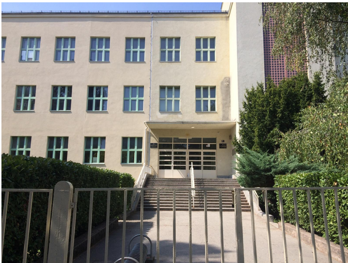
Sl. 18. OŠ Dragutina Kušlana (fotografirano 16. 8. 2024.)

OŠ Borovje (sl. 19) izgrađena je 2005. godine. Zgrada se obnavlja, a planira se uređenje učionica, nadogradnja škole, ugradnja klima-uređaja i nabava novih računala. U školi se nalazi jedan kabinet za geografiju i povijest. Škola raspolaže sa 60 računala.