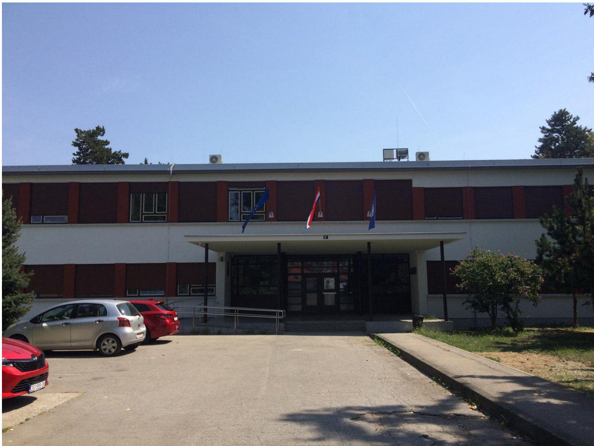
Sl. 10. OŠ Augusta Cesarca (fotografirano 16. 8. 2024.)

OŠ Augusta Cesarca (sl. 10) izgrađena je 1960. godine. Zgradi je potrebna obnova. Godine 2023. započelo se s energetsom obnovom zgrade. Unutarnji prostori zgrade redovito su održavani. Planirana su ulaganja u opremanje učionica na višu razinu za uspješnije poučavanje te zamjena vrata i prozora. U školi se nalazi jedna učionica za geografiju i povijest. Škola raspolaže sa 20 računala za učenike, kojima je potrebna zamjena.