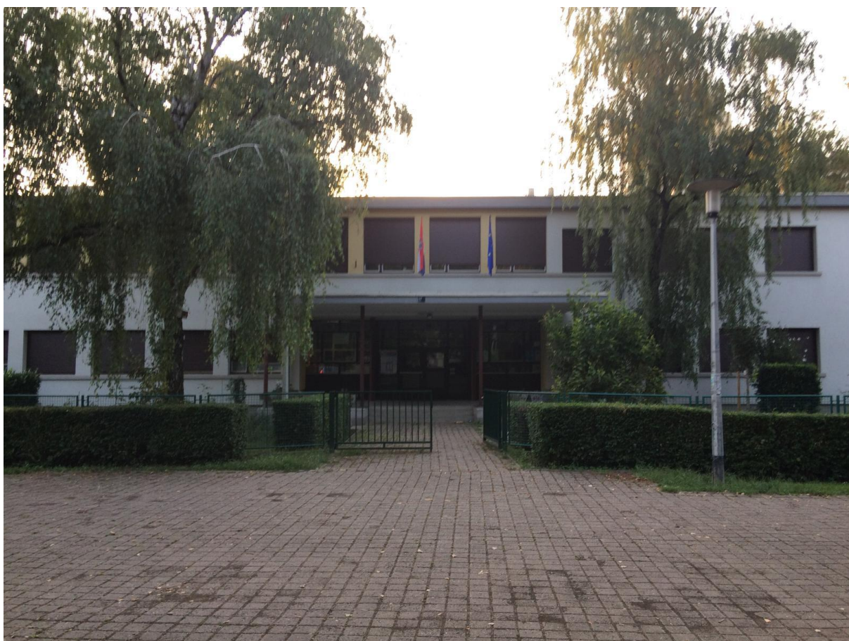
Sl. 1. OŠ Cvjetno naselje (fotografirano 16. 8. 2024.)

OŠ Cvjetno naselje (sl. 1) izgrađena je 1962. godine. Zgrada je djelomično obnovljena, ali su potrebna ulaganja u sanaciju unutarnjih zidova u prizemlju, zamjenu električnih instalacija te obnovu krovišta, fasade i školskog dvorišta. U školi se nalazi jedna specijalizirana učionica za nastavu geografije i povijesti. Škola raspolaže sa 58 stolnih računala, ali su potrebna nova računala.