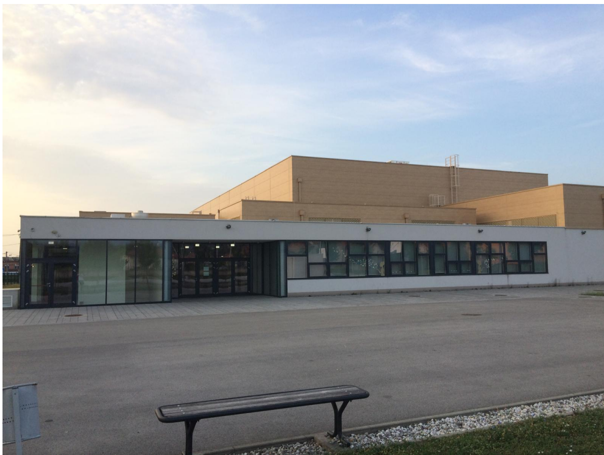
Sl. 27. OŠ Granešina (fotografirano 17. 8. 2024.)

OŠ Antuna Branka Šimića (sl. 28) izgrađena je 1992. godine. Zgradi je potrebna obnova i dogradnja. Neke prostorije u školi su premale, a potrebno je i uređenje školskog dvorišta. Planirana je dogradnja 13 do 15 učionica (za rad u 1 smjeni), dogradnja i povećanje kapaciteta školske kuhinje, blagovaonice, knjižnice i školske dvorane. Uz navedene zahvate, planira se i obnova drvene i limene stolarije, kao i parketa u svim učionicama. Potrebno je promijeniti zavjese u većini učionica, a u učionicama predmetne nastave na stropove treba postaviti knauf ploče. U školi se nalazi jedna učionica za geografiju i povijest te jedan kabinet za geografiju i povijest. Škola raspolaže sa 65 računala, od toga su 24 računala za učenike u informatičkoj učionici. Sve učionice imaju računalo i projektor.