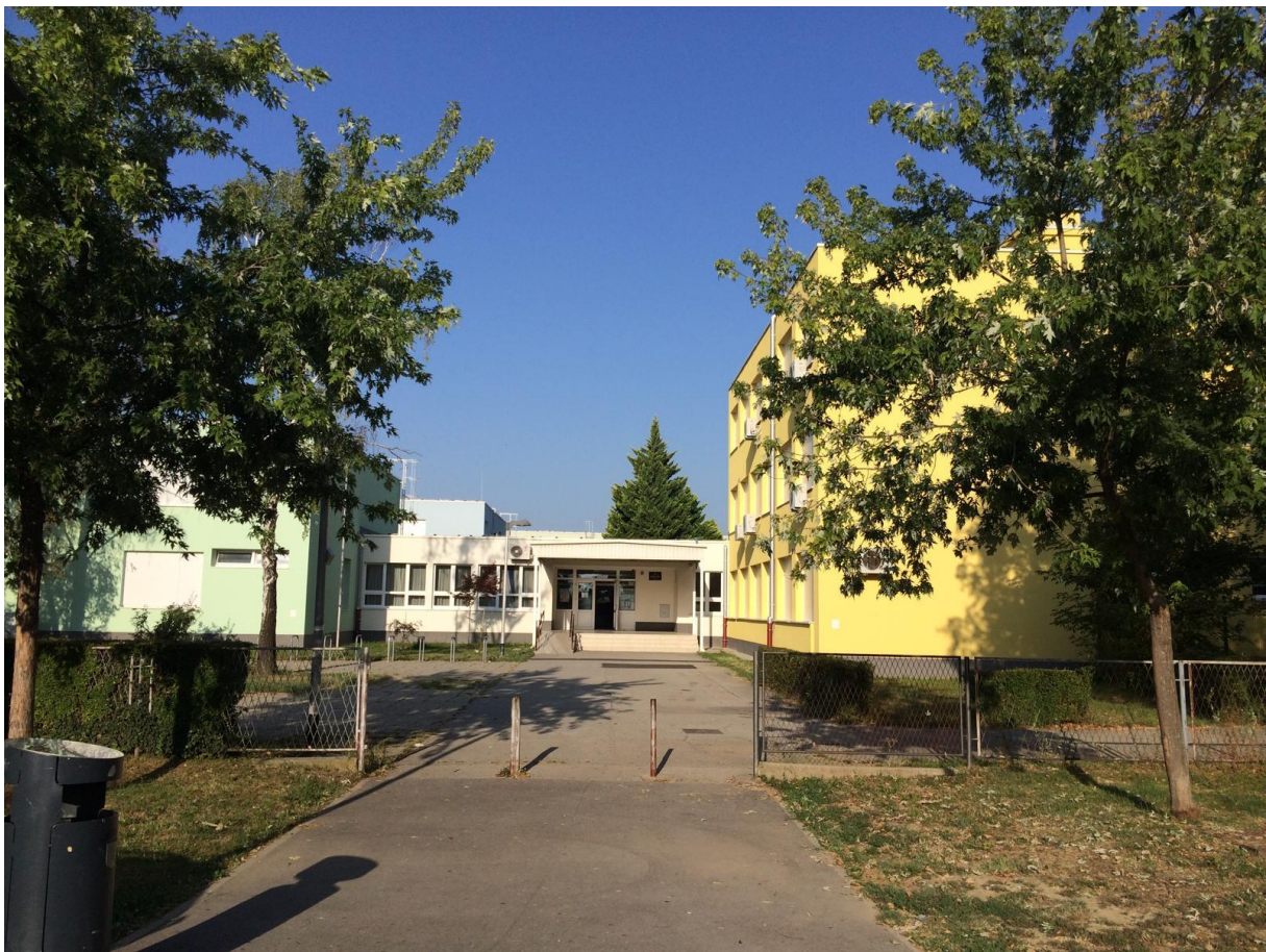
Sl. 32. OŠ Retkovec (fotografirano 16. 8. 2024.)

OŠ Retkovec (sl. 32) je izgrađena 1967. godine. Potrebna su ulaganja u školsku zgradu, kao što je nadogradnja škole, zbog toga što se dio nastave odvija u nedovoljno velikim prostorijama. Radovi koji se izvode: obnova fasade, obnova vanjske stolarije, krova i kotlovnice. Planira se dogradnja šest učionica i školske dvorane, obnova informatičke opreme u učionicama, obnova prostora oko škole. U školi se nalazi jedna učionica za geografiju i jedna učionica za povijest. Škola raspolaže sa 60 računala.