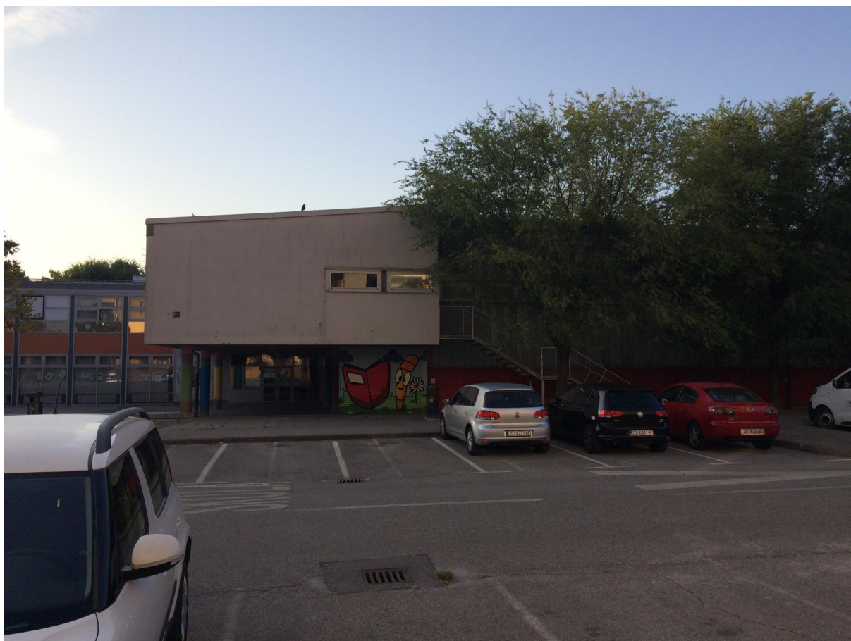
Sl. 19. OŠ Borovje (fotografirano 16. 8. 2024.)

Prva katolička OŠ u Gradu Zagrebu (sl. 20) od školske godine 2013./2014. nalazi se na ovoj lokaciji. Zgrada je obnovljena i stalno se ulaže u zgradu. U školi se nalazi jedna učionica za geografiju i ostale predmete. Nastava TZK odvija se u OŠ Frana Krste Frankopana. Škola raspolaže sa 4 stolna i 30 prijenosnih računala. Brinu se o pravovremenoj i adekvatnoj zamjeni zastarjele novom informatičkom opremom.