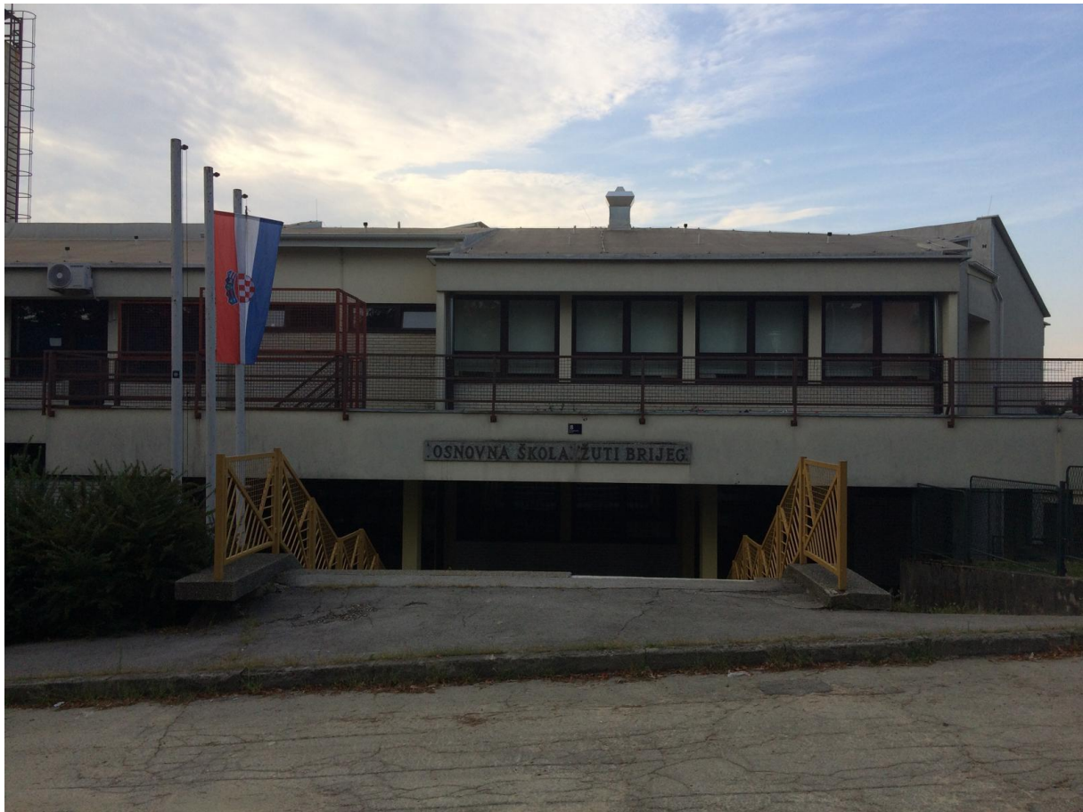
Sl. 31. OŠ Žuti brijeg (fotografirano 17. 8. 2024.)