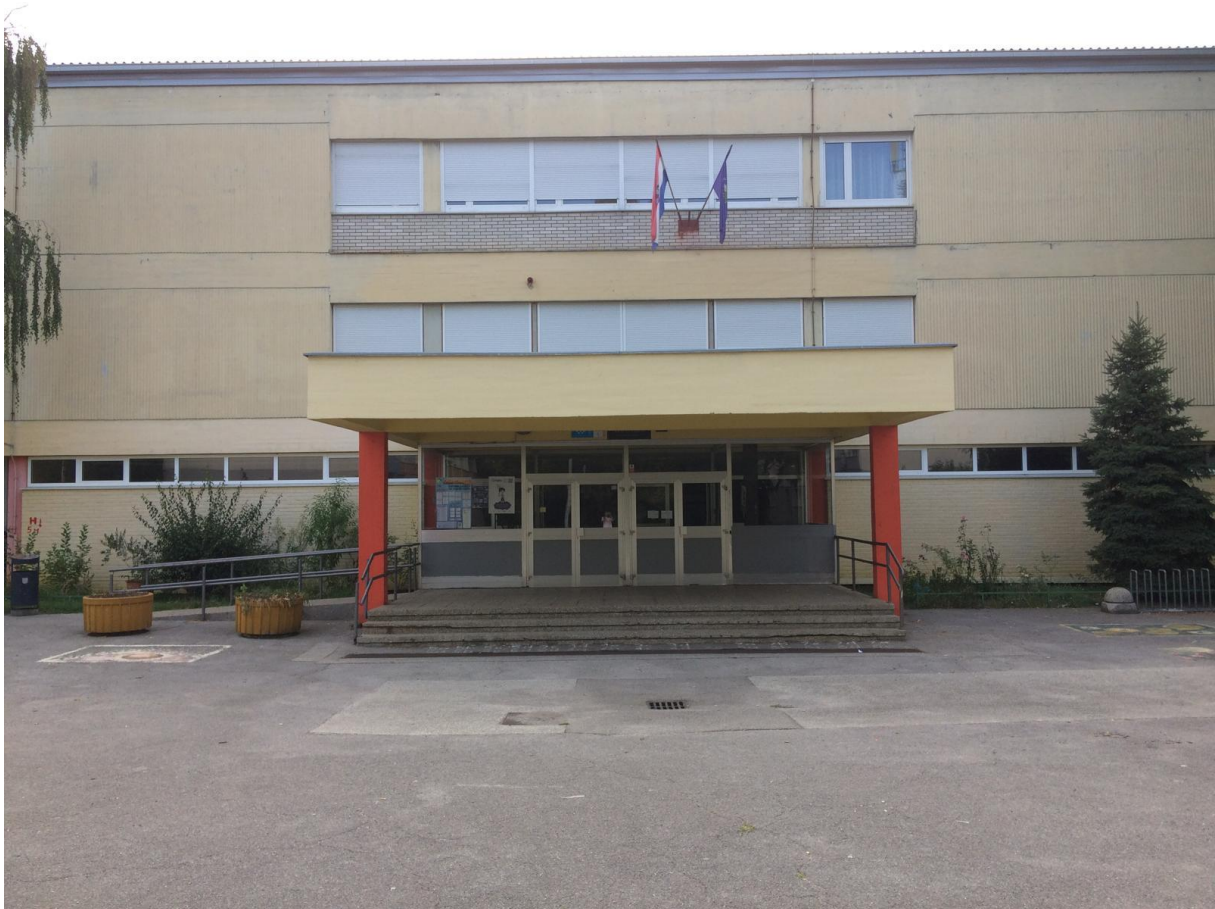
Sl. 24. OŠ Mate Lovraka (fotografirano 17. 8. 2024.)

OŠ Mate Lovraka (sl. 24) izgrađena je 1974. godine. Zgrada je obnovljena, školski hodnici su uređeni i obnovljene su sanitarne prostorije. Potrebno je obnoviti rasvjetu u školskoj dvorani. Planirana ulaganja su: zamjena vrata i prozora, zamjena parketa u učionicama, zamjena nastavnih sredstava i pomagala, uključujući informatičku opremu (zbog zastarijevanja). U školi se nalazi jedan kabinet za geografiju i povijest. Škola raspolaže sa 80 računala.