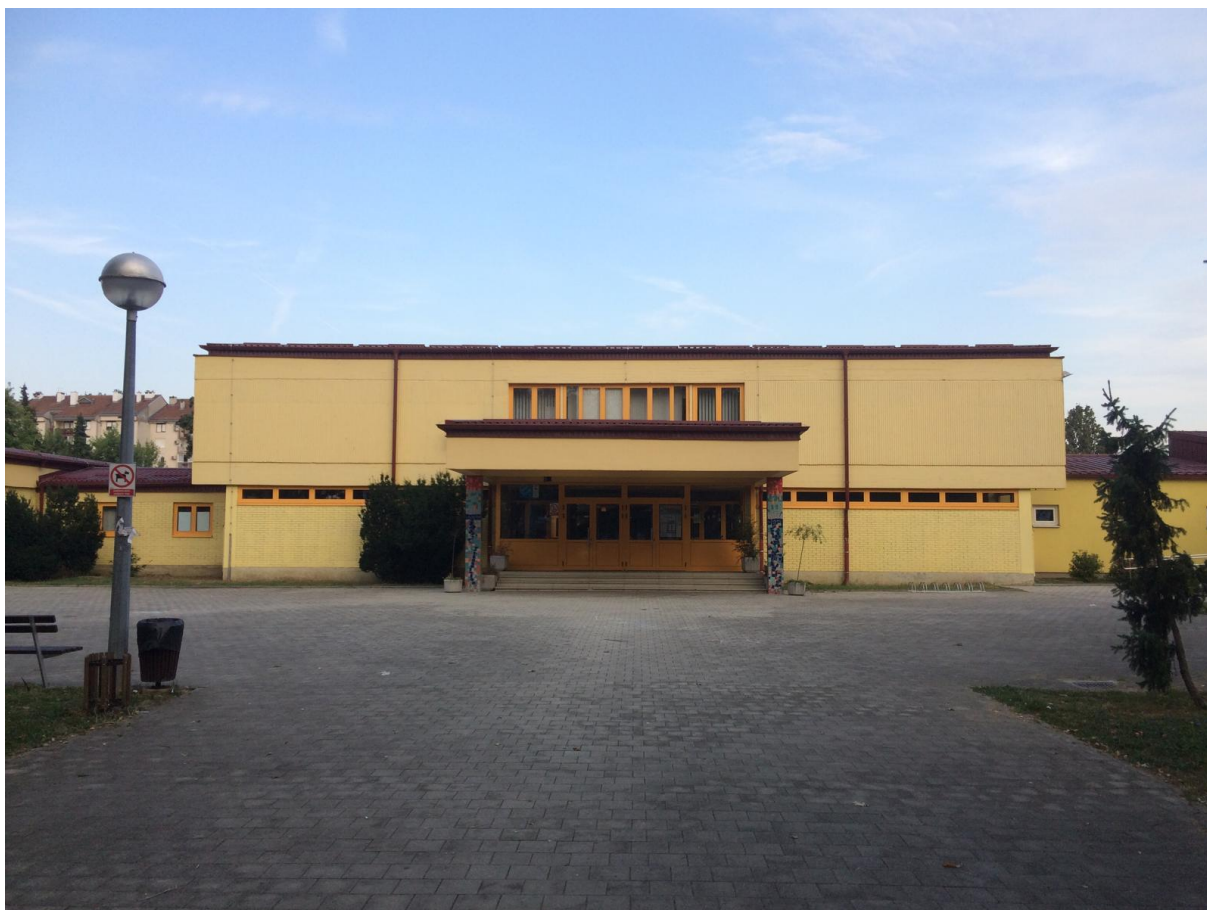
Sl. 26. OŠ Antuna Mihanovića (fotografirano 17. 8. 2024.)

OŠ Granešina (sl. 27) izgrađena je 1987., dograđena 2006., a 2019. godine izgrađena je nova školska dvorana. Zgrada je obnovljena, ali su u planu: dogradnja pet učionica, energetska obnova i sanacija krovništva. U školi se nalaze dvije učionice za geografiju i povijest. Škola raspolaže sa 192 računala.