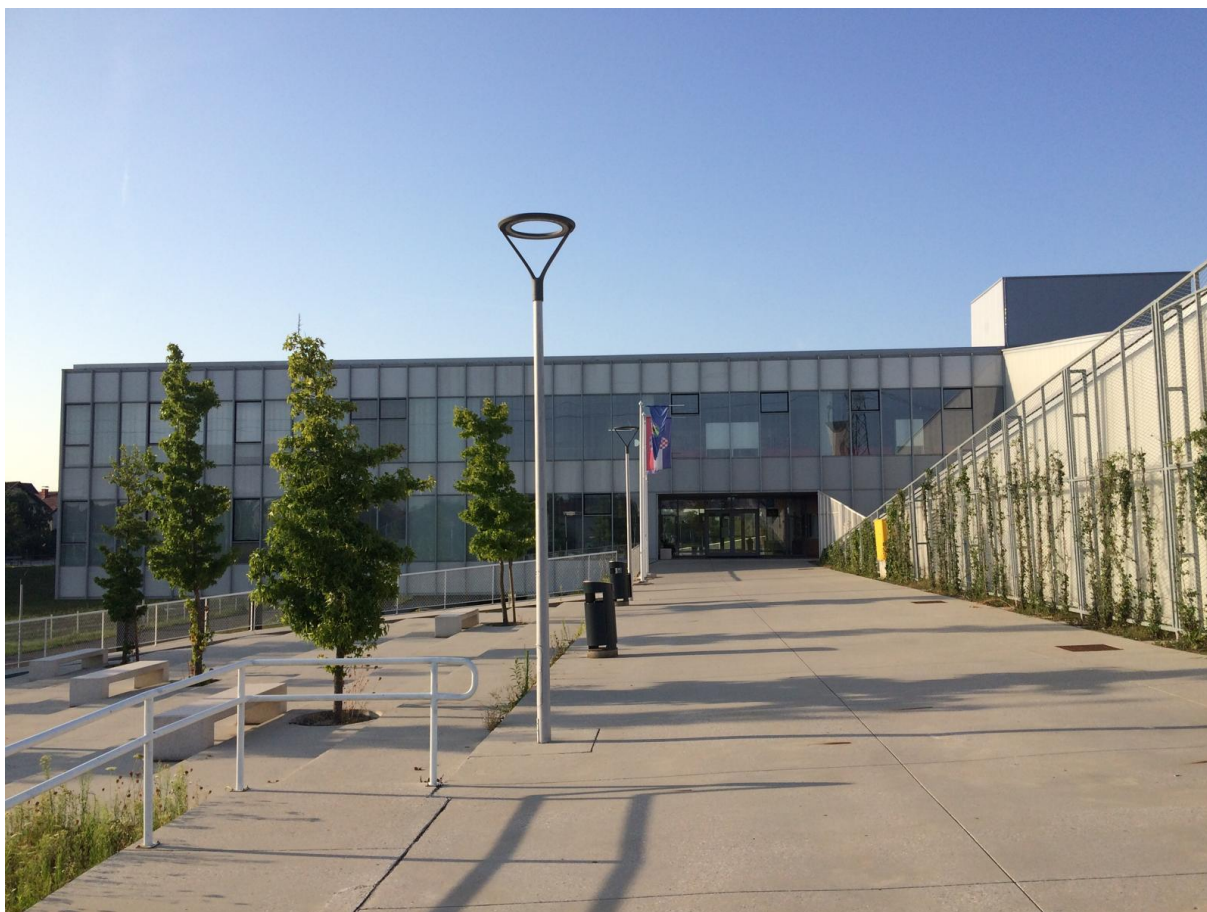
Sl. 23. OŠ Ivanja Reka (fotografirano 16. 8. 2024.)