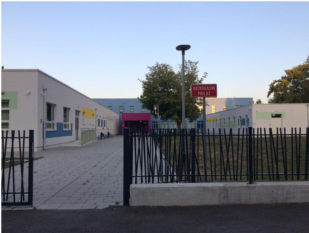
Sl. 2. OŠ Jure Kaštelana (fotografirano 16. 8. 2024.)

naveden broj specijaliziranih učionica i kabineta za geografiju i povijest. Škola raspolaže sa 103 stolna i 52 prijenosna računala. Godišnji plan i program ove škole nije javno dostupan. Škola ima jednu učionicu za geografiju i povijest te jedan kabinet za geografiju i povijest.