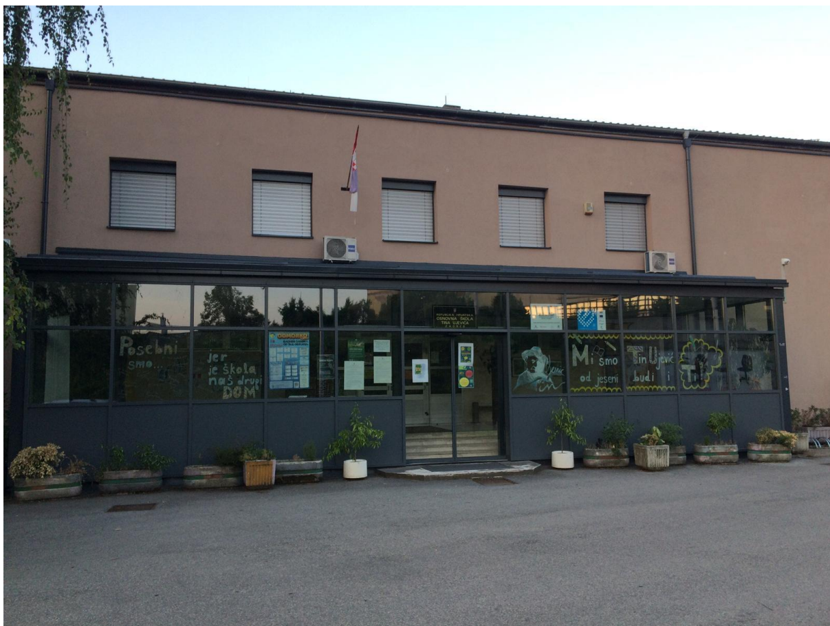
Sl. 4. OŠ Tina Ujevića (fotografirano 16. 8. 2024.)

OŠ Rapska (sl. 5) izgrađena je 1939., a 1967. godine izvršena je adaptacija i proširenje. Današnja je zgrada obnovljena (vanjski i unutarnji dio). Škola ulaže u nabavu potrebnog namještaja, potrebnih nastavnih sredstava i pomagala, kao i informatičku opremu, a planiraju se okrečiti učionice i obnoviti parketi u učionicama. U školi se nalazi jedna učionica za geografiju i povijest. Škola raspolaže sa 70 računala.