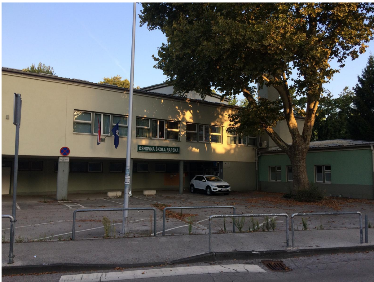
Sl. 5. OŠ Rapska (fotografirano 16. 8. 2024.)

OŠ Marina Držića (sl. 6) izgrađena je 1959. godine. U obnovljenoj zgradi planirano je postavljenje i lakiranje parketa, zamjena dotrajalih vrata, nabava stolova i stolica za učionice, nabava klima-uređaja. U školi se nalazi jedna učionica za geografiju i povijest te jedan kabinet za geografiju i povijest. Škola raspolaže sa 55 računala.