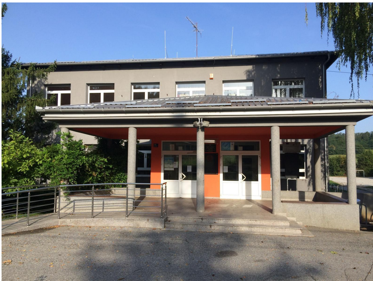
Sl. 41. PŠ Adamovec (fotografirano 18. 8. 2024.)

OŠ Brestje (sl. 42) izgrađena je 1997. godine. Zgrada se obnavlja, što podrazumijeva obnovu krovišta, zamjenu oštećenog poda, zamjenu dotrajale stolarije (vrata i prozori) te servis i nadogradnju videonadzora. U školi se nalazi jedna učionica za geografiju i povijest i jedan kabinet za povijest. Škola je opremljena suvremenim audiovizualnim nastavnim sredstvima, koje je potrebno stalno obnavljati. Škola raspolaže sa 50 računala.