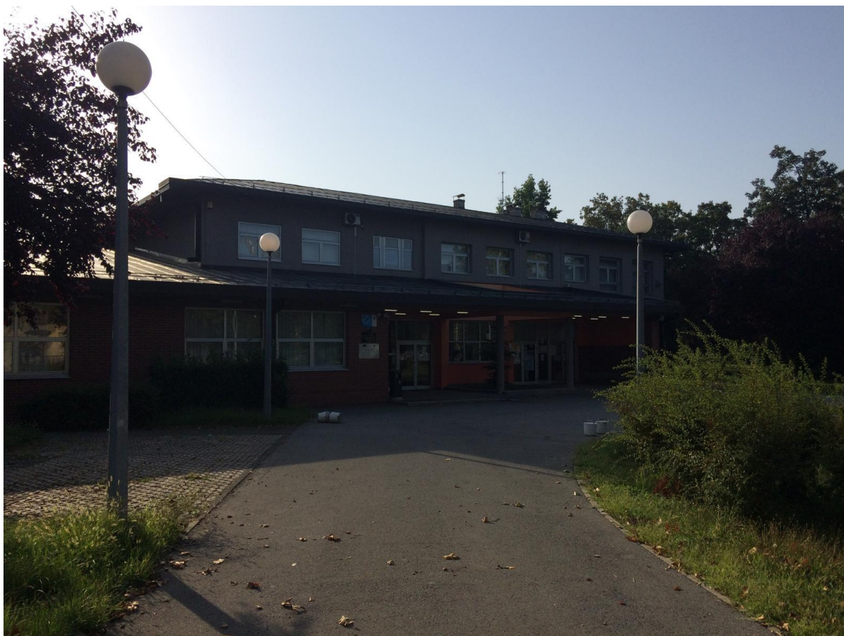
Sl. 40. OŠ Ivana Grande (fotografirano 18. 8. 2024.)

PŠ Adamovec (sl. 41) izgrađena je 1959., a 1980. godine dograđena je montažna sportska dvorana. Zgrada je obnovljena. Tijekom godina zamijenjena je vanjska stolarija, rekonstruirana kotlovnica, sanirani podovi i sanitarni čvorovi u sportskoj dvorani, sanirane su elektroinstalacije, uređeno je školsko igralište, popravljani su krov škole i krov dvorane te fasada. Također odrađeno je opremanje informatičke učionice. Planira se sanacija zida sportske dvorane, sanacija igrališta i dvorišta, sanacija podova u podrumskim učionicama te sanacija sanitarnih čvorova u zgradi. Također potrebno je pokrenuti inicijativu za dogradnju škole. U školi se nalazi jedna učionica za geografiju i ostale predmete. U školskoj godini 2021./2022. u školu je uveden bežični Internet. U Godišnjem planu i programu nije naveden broj računala s kojima škola raspolaže.