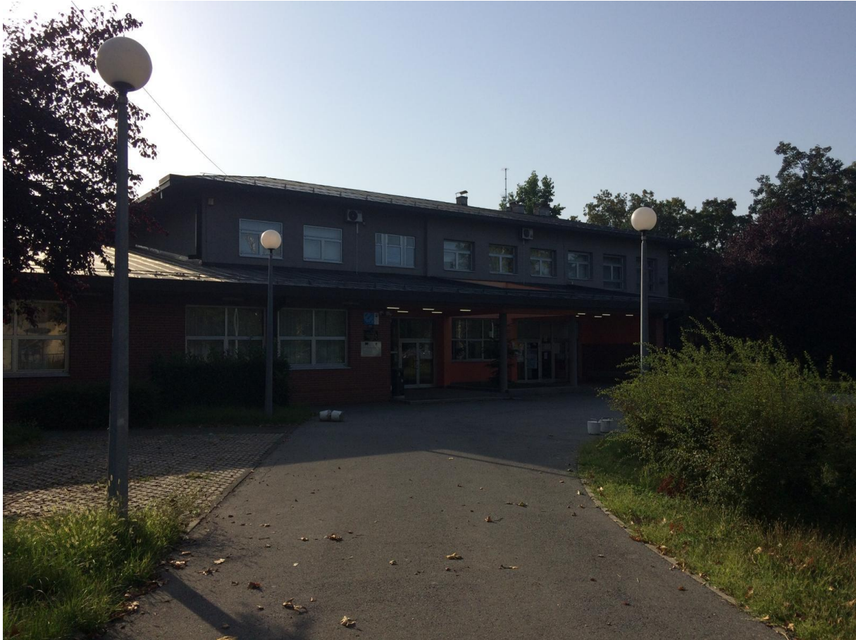
Sl. 40. OŠ Ivana Grande (fotografirano 18. 8. 2024.)

PŠ Adamovec (sl. 41) izgrađena je 1959., a 1980. godine dograđena je montažna sportska dvorana. Zgrada je obnovljena. Tijekom godina zamijenjena je vanjska stolarija, rekonstruirana kotlovnica, sanirani podovi i sanitarni čvorovi u sportskoj dvorani, sanirane su elektroinstalacije, uređeno je školsko igralište, popravljani su krov škole i krov dvorane te fasada. Također odrađeno je opremanje informatičke učionice. Planira se sanacija zida sportske dvorane, sanacija igrališta i dvorišta, sanacija podova u podrumskim učionicama te sanacija sanitarnih čvorova u zgradi. Također potrebno je pokrenuti inicijativu za dogradnju škole. U školi se nalazi jedna učionica za geografiju i ostale predmete. U školskoj godini 2021./2022. u školu je uveden bežični Internet. U Godišnjem planu i programu nije naveden broj računala s kojima škola raspolaže.