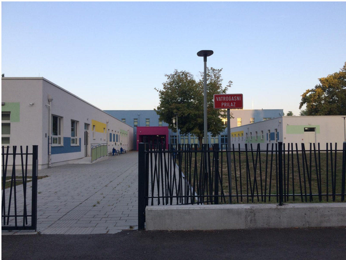
Sl. 2. OŠ Jure Kaštelana (fotografirano 16. 8. 2024.)

naveden broj specijaliziranih učionica i kabineta za geografiju i povijest. Škola raspolaže sa 103 stolna i 52 prijenosna računala. Godišnji plan i program ove škole nije javno dostupan. Škola ima jednu učionicu za geografiju i povijest te jedan kabinet za geografiju i povijest.