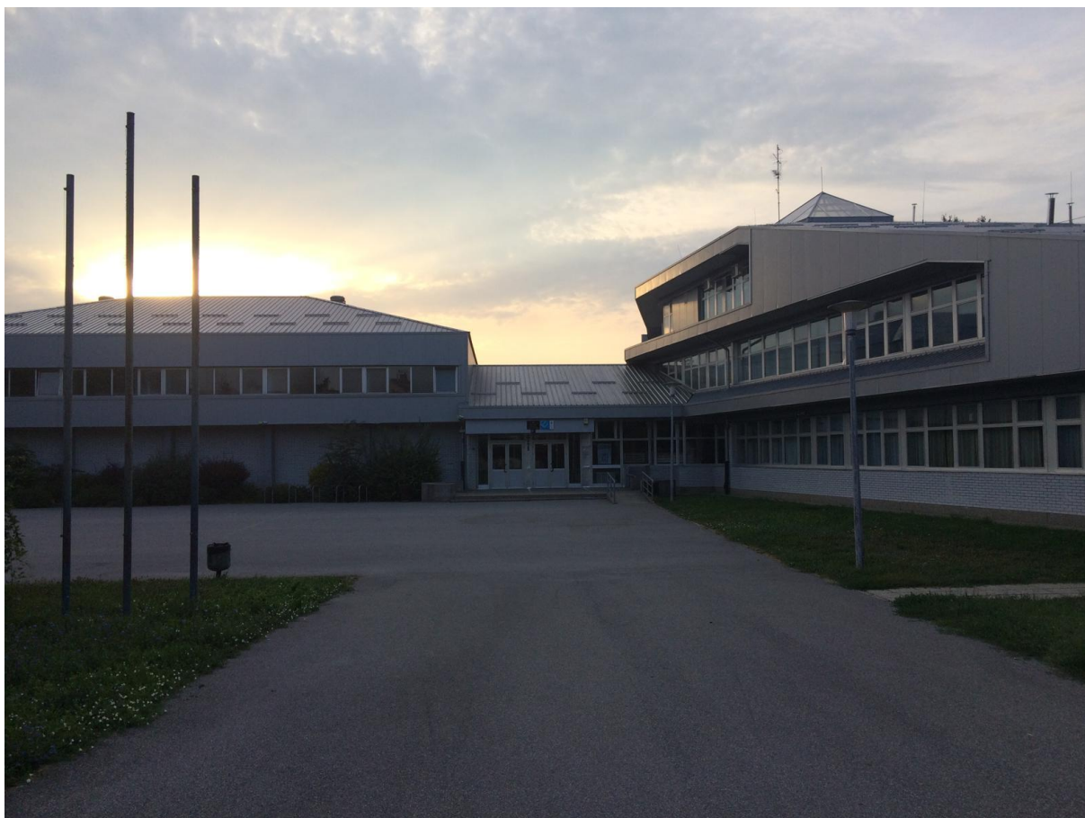
Sl. 28. OŠ Antuna Branka Šimića (fotografirano 17. 8. 2024.)

OŠ dr. Ante Starčevića (sl. 29) izgrađena je 1960. godine. Zgrada je obnovljena, a to podrazumijeva: drvena stolarija je zamijenjena aluminijskom u cijeloj školi, nakon potresa obnovljeni su svi unutarnji prostori, zamijenjena je kotlovnica, sve učionice su klimatizirane, zamijenjena je rasvjeta i postavljena je LED rasvjeta, zatim popravljeni i oličeni su zidovi u svim prostorijama, obnovljeni su parketi, zamijenjene su klupe i stolice, uređeni su sanitarni čvorovi. Potrebno je zamijeniti računala u učionicama. U školi se nalazi jedna učionica za geografiju i povijest. Škola raspolaže sa 97 računala, od toga 24 prijenosna računala u informatičkoj učionici. Sve učionice imaju računalo i projektor. Škola je dobro opremljena nastavnim sredstvima i pomagalicima.