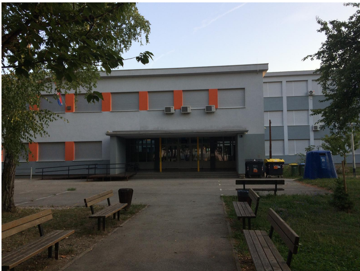
Sl. 6. OŠ Marina Držića (fotografirano 16. 8. 2024.)

OŠ Davorina Trstenjaka (sl. 7) izgrađena je 1956. godine. U obnovljenoj zgradi potrebno je još postavljanje novog parketa i ličenje učionica, zamjena stolarije i obnova igrališta. U školi se nalazi jedna učionica za geografiju. Škola raspolaže sa 66 računala.