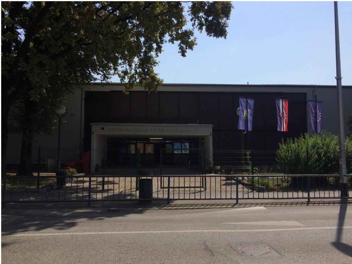
Sl. 16. OŠ Petra Preradovića (fotografirano 16. 8. 2024.)

OŠ dr. Vinka Žganca (sl. 17) izgrađena je 1976., a dogradnja je izvršena 2018. godine. Zgrada je obnovljena. Iako je odrađena dogradnja škole i dalje postoji problem nedostatka učionica. U školi se nalazi jedna učionica za geografiju i povijest. Škola je dobro opremljena nastavnim sredstvima i pomagalicama. U svakoj učionici se nalazi po jedno prijenosno računalo, a u informatičkoj učionici se nalaze 24 računala.