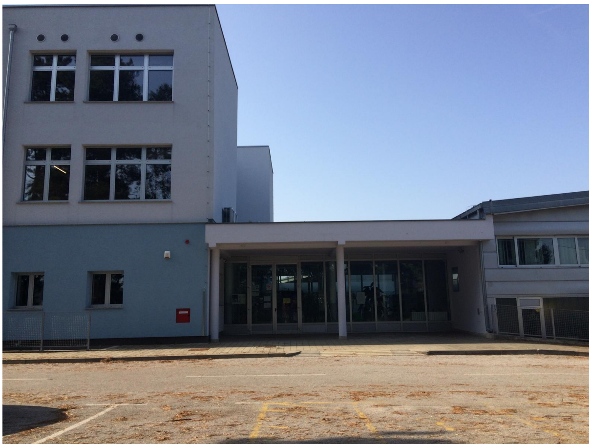
Sl. 39. PŠ Vugrovec (fotografirano 18. 8. 2024.)

OŠ Ivana Grande (sl. 40) izgrađena je 1958., a 2003. godine je dograđena. Godine 2015. izgrađeno je školsko igralište. Zgradi je potrebna obnova i dogradnja, zbog toga što unutrašnji prostor postaje neadekvatan za broj razrednih odjela. Planira se sanacija podruma, dogradnja školskog prostora (2019. godine napravljen je projektni zadatak za dogradnju učionica). Do 2027. godine planira se završiti dogradnja škole, međutim ona još nije počela. Također planira se i nabava novih računala za učenike, kao i prenamjena i obnova prostora (sanacija učionica). U školi se nalazi jedna učionica za geografiju i povijest te jedan kabinet za geografiju i povijest. Škola je tijekom godina redovito opremana nastavnim sredstvima i pomagalicama, tako da većina učionica ima projektore. U školskoj godini 2021./2022. u školu je uveden bežični Internet. Za informatičku učionicu potrebno je nabaviti nova računala. U Godišnjem planu i programu nije naveden broj računala s kojima škola raspolaže.