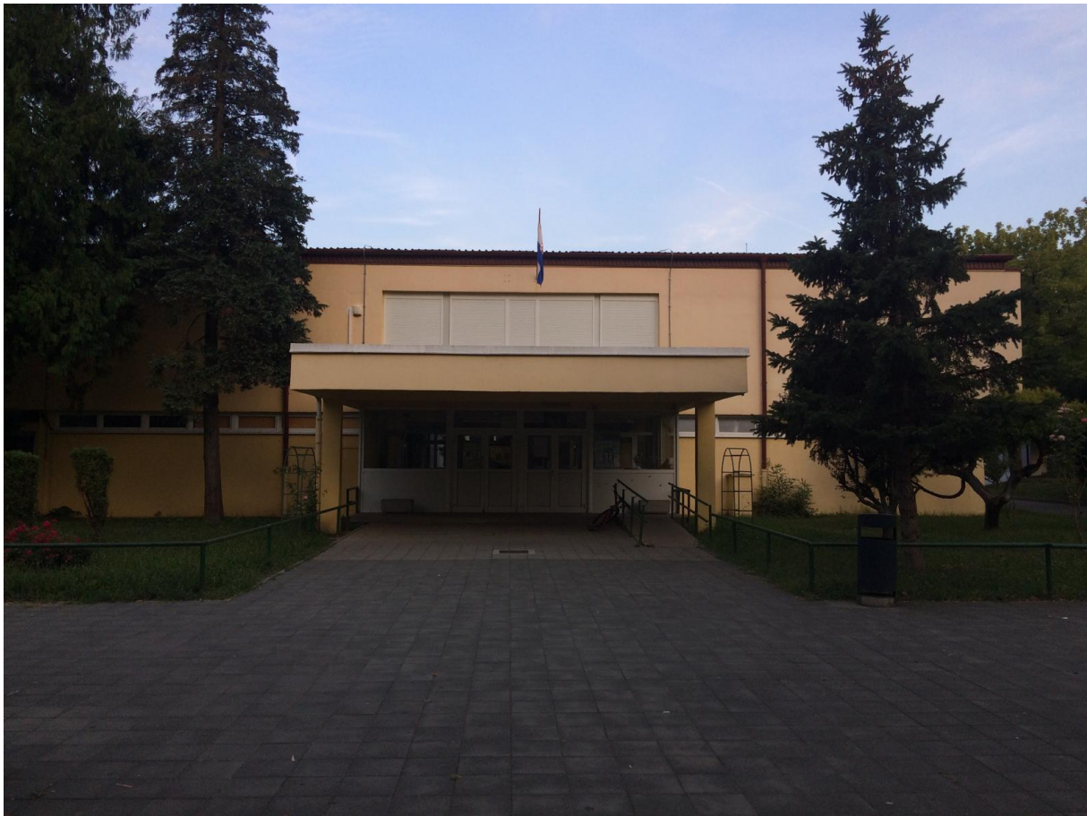
Sl. 30 OŠ Vjenceslava Novaka (fotografirano 17. 8. 2024.)

OŠ Žuti brijeg (sl. 31) izgrađena je 1983. godine. Zgrada je uglavnom obnovljena. Unutarnji prostor je adekvatan za ostvarivanje odgojno-obrazovnih zadaća i programa. U planu je ugradnja klima-uređaja u šest učionica, sanacija i uređenje učionica nakon odlaska OŠ Bukovac iz prostora škole, zatim uređenje školskog dvorišta i postavljanje novih klupa i stolica te sanacija dotrajalih. U školi se nalazi jedna učionica i jedan kabinet za geografiju te jedna učionica i jedan kabinet za povijest. Škola je informatički u potpunosti opremljena i raspolaže sa 110 računala.