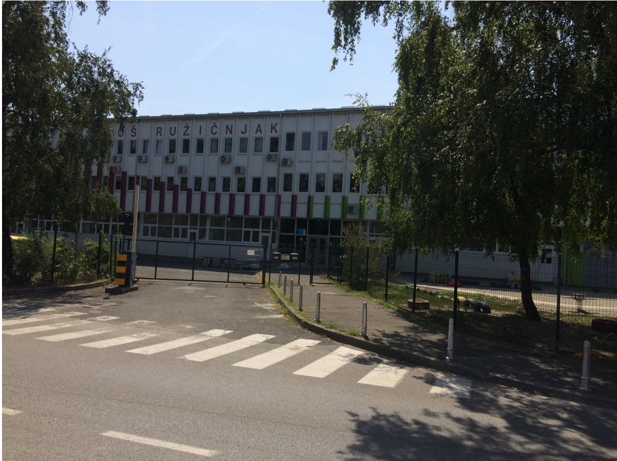
Sl. 22. OŠ Ružičnjak (fotografirano 16. 8. 2024.)

OŠ Ivanja Reka (sl. 23) izgrađena je 2019. godine. Školska zgrada je nova. Za sada u planu nisu veća preuređenja, osim potrebnog održavanja, kao što su: bojenje zidova, održavanje podova i popravak sitnih oštećenja. Trenutno se otklanjaju uočeni građevinski nedostaci i sitna oštećenja. U školu bi trebalo ugraditi klima-uređaje. U školi se nalaze jedna učionica i jedan kabinet za geografiju te jedna učionica i jedan kabinet za povijest. Škola raspolaže sa 85 računala, 28 računala koje je darovao CARNET i 19 prijenosnih računala za učenike.