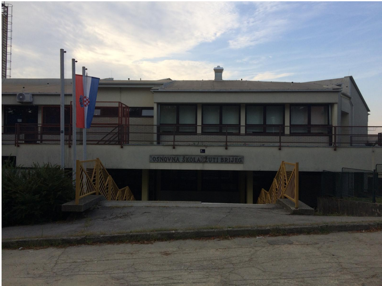
Sl. 31. OŠ Žuti brijeg (fotografirano 17. 8. 2024.)