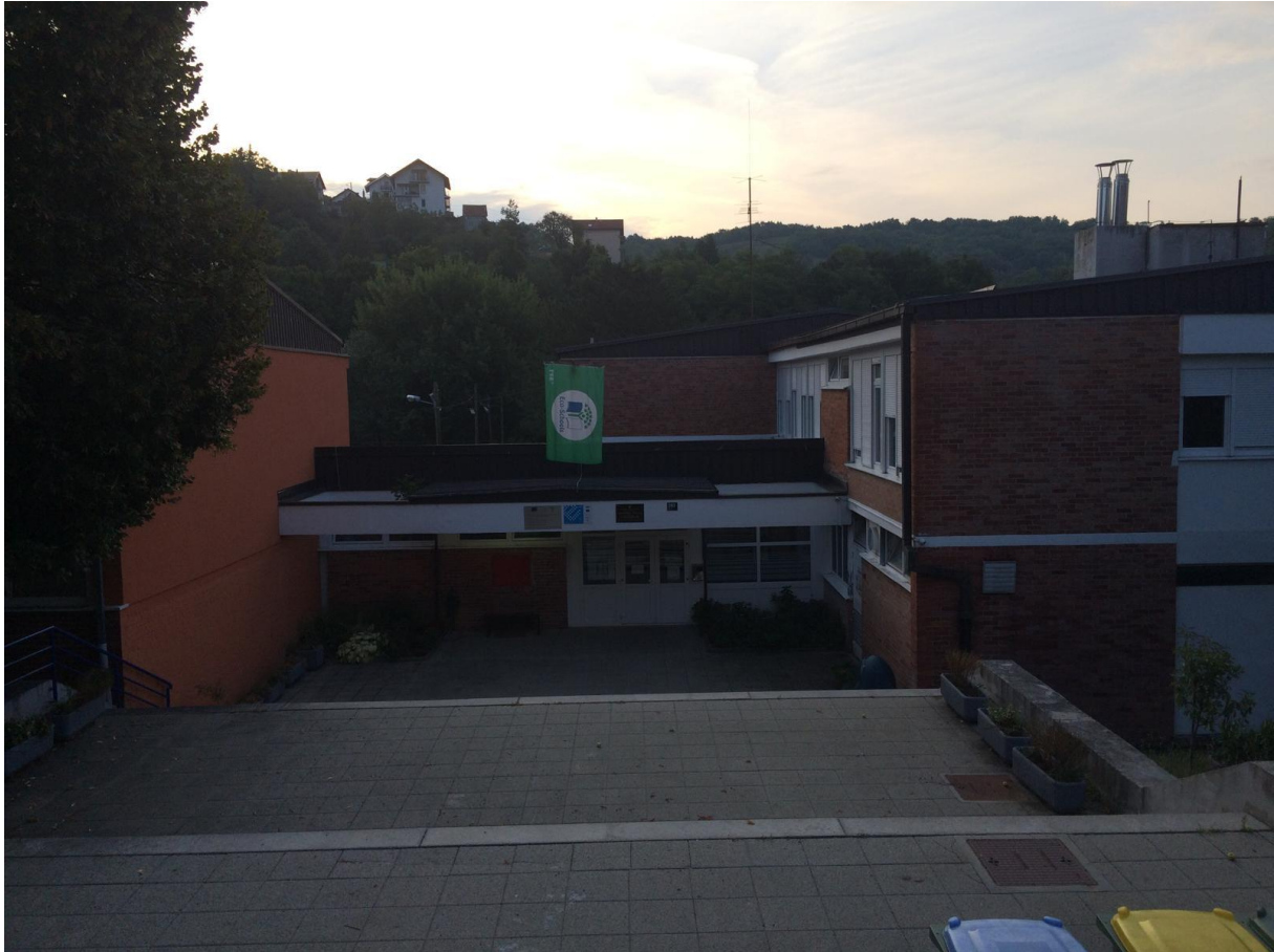
Sl. 25. OŠ Čučerje (fotografirano 17. 8. 2024.)

OŠ Antuna Mihanovića (sl. 26) izgrađena je 1973. godine. Zgrada je obnovljena. Dogradnja škole započela je u školskog godini 2017./2018. i radovi su završeni 2018. godine. Poslovi koji su obavljani: zamjena prozora, adaptacija sanitarnih čvorova, uređenje školskog igrališta. U planu je obnova hidrantske mreže. Učionice su dobro didaktički opremljene. U školi se nalazi jedna učionica za geografiju i jedna učionica za povijest, kao i suvremena informatička učionica s 30 računala. Škola raspolaže sa 45 stolnih i 52 prijenosna računala te 290 tableta za učenike. Sve učionice imaju mogućnost korištenja IKT tehnologije.