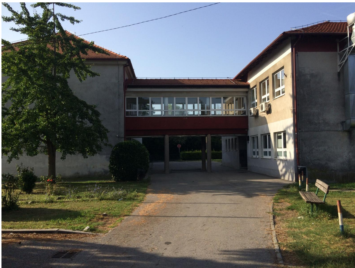
Sl. 38. OŠ Vugrovec-Kašina (fotografirano 18. 8. 2024.)

PŠ Vugrovec (sl. 39) izgrađena je 1962. godine. Zgrada je obnovljena, odnosno sanirana i nadograđena nakon potresa u Gradu Zagrebu 2020. godine. Škola je opremljena novim namještajem te je preuređena i modernizirana kotlovnica. Planira se nadograditi malu sportsku dvoranu, sanirati podrumске prostorije te izvršiti sanaciju površinskih voda i kanalizacije na školskom dvorištu. U Godišnjem planu i programu nije naveden broj učionica i/ili kabineta za geografiju i povijest, kao niti broj računala s kojima škola raspolaže. Škola ima jedan kabinet za geografiju i povijest.