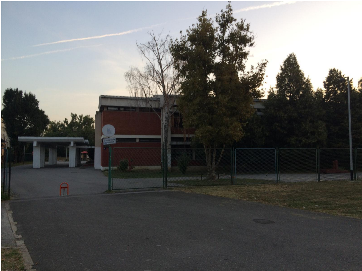
Sl. 9. OŠ Rudeš (fotografirano 16. 8. 2024.)