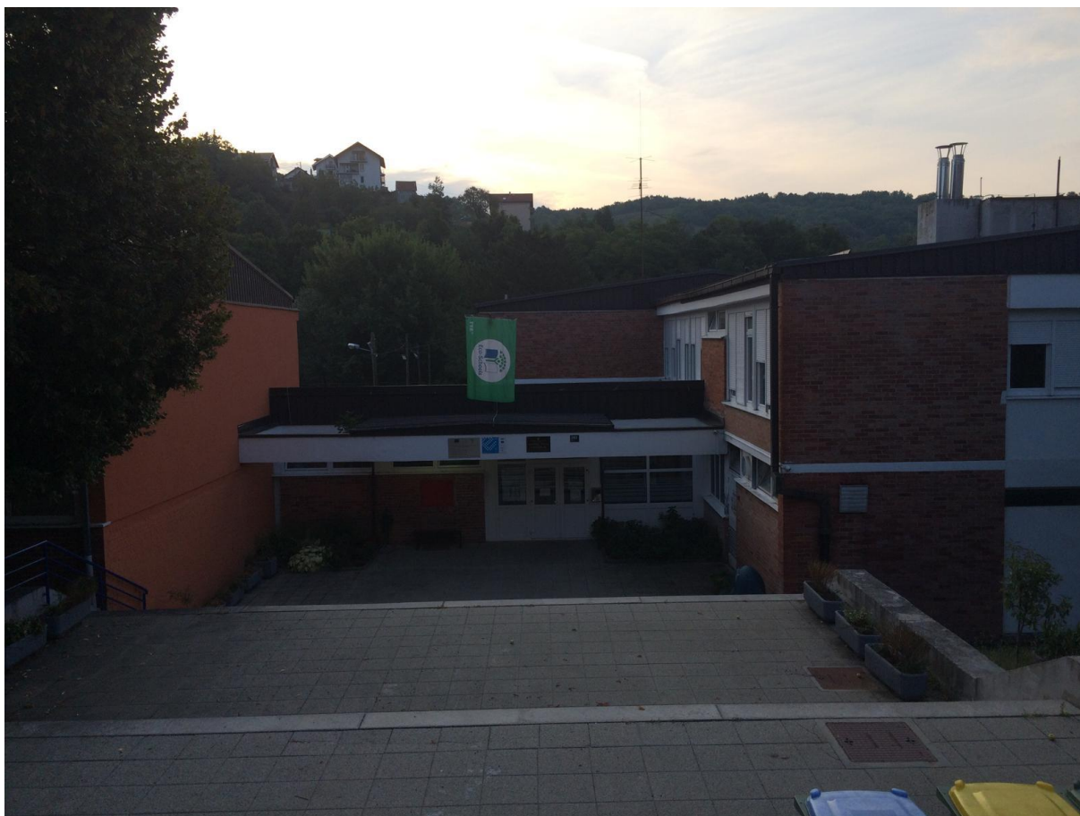
Sl. 25. OŠ Čučerje (fotografirano 17. 8. 2024.)

OŠ Antuna Mihanovića (sl. 26) izgrađena je 1973. godine. Zgrada je obnovljena. Dogradnja škole započela je u školskog godini 2017./2018. i radovi su završeni 2018. godine. Poslovi koji su obavljani: zamjena prozora, adaptacija sanitarnih čvorova, uređenje školskog igrališta. U planu je obnova hidrantske mreže. Učionice su dobro didaktički opremljene. U školi se nalazi jedna učionica za geografiju i jedna učionica za povijest, kao i suvremena informatička učionica s 30 računala. Škola raspolaže sa 45 stolnih i 52 prijenosna računala te 290 tableta za učenike. Sve učionice imaju mogućnost korištenja IKT tehnologije.