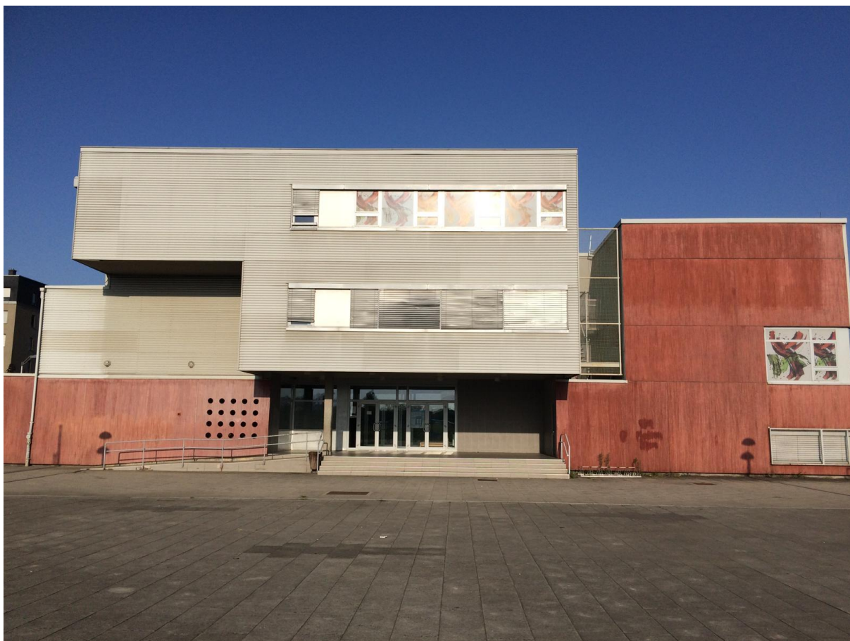
Sl. 45. OŠ Jelkovec (fotografirano 16. 8. 2024.)

OŠ Iver (sl. 46) izgrađena je 2014., a 2020. godine izvršena je prenamjena prostora. Zgrada je obnovljena, osim što bi trebalo sanirati sportsko igralište. Za 2023./2024. školsku godinu u Godišnjem planu i programu se ne navode planirana ulaganja, osim sanacije sportskog igrališta. U školi se nalazi jedna učionica za geografiju i povijest i jedan kabinet za geografiju i povijest. Škola raspolaže sa 28 stolnih i 74 prijenosna računala.