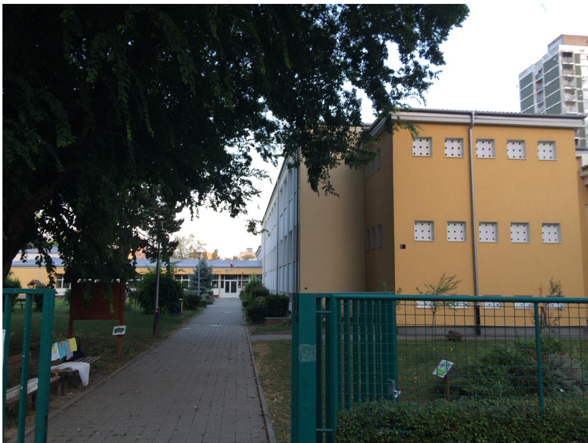
Sl. 7. OŠ Davorina Trstenjaka (fotografirano 16. 8. 2024.)

OŠ Trnjanska (sl. 8) izgrađena je 1899. godine. Zgrada je obnovljena, ali je potrebna izmjena parketa, nabava nove informatičke opreme, nabava 3 školske ploče. U školi se nalazi jedan kabinet za geografiju, povijest i prirodu. Škola raspolaže sa 25 računala, od toga 12 računala u informatičkoj učionici.