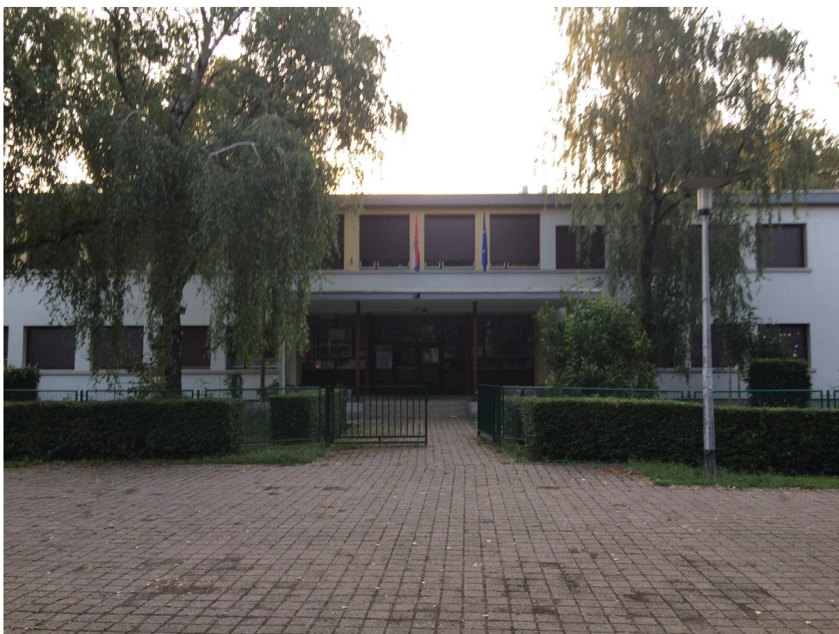
Sl. 1. OŠ Cvjetno naselje (fotografirano 16. 8. 2024.)

OŠ Cvjetno naselje (sl. 1) izgrađena je 1962. godine. Zgrada je djelomično obnovljena, ali su potrebna ulaganja u sanaciju unutarnjih zidova u prizemlju, zamjenu električnih instalacija te obnovu krovišta, fasade i školskog dvorišta. U školi se nalazi jedna specijalizirana učionica za nastavu geografije i povijesti. Škola raspolaže sa 58 stolnih računala, ali su potrebna nova računala.