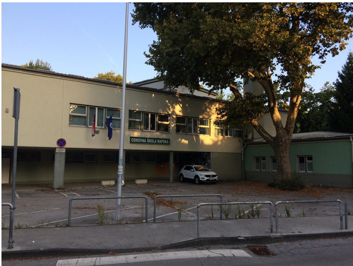
Sl. 5. OŠ Rapska (fotografirano 16. 8. 2024.)

OŠ Marina Držića (sl. 6) izgrađena je 1959. godine. U obnovljenoj zgradi planirano je postavljenje i lakiranje parketa, zamjena dotrajalih vrata, nabava stolova i stolica za učionice, nabava klima-uređaja. U školi se nalazi jedna učionica za geografiju i povijest te jedan kabinet za geografiju i povijest. Škola raspolaže sa 55 računala.