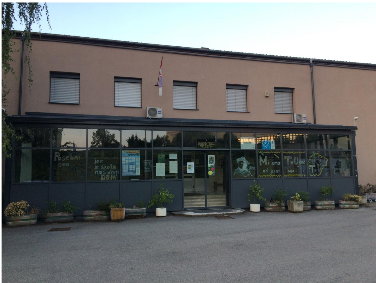
Sl. 4. OŠ Tina Ujevića (fotografirano 16. 8. 2024.)

OŠ Rapska (sl. 5) izgrađena je 1939., a 1967. godine izvršena je adaptacija i proširenje. Današnja je zgrada obnovljena (vanjski i unutarnji dio). Škola ulaže u nabavu potrebnog namještaja, potrebnih nastavnih sredstava i pomagala, kao i informatičku opremu, a planiraju se okrečiti učionice i obnoviti parketi u učionicama. U školi se nalazi jedna učionica za geografiju i povijest. Škola raspolaže sa 70 računala.