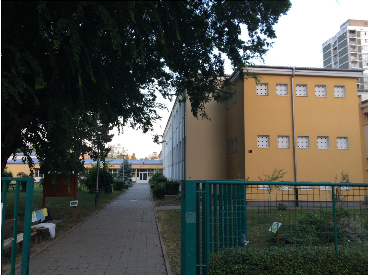
Sl. 7. OŠ Davorina Trstenjaka (fotografirano 16. 8. 2024.)

OŠ Trnjanska (sl. 8) izgrađena je 1899. godine. Zgrada je obnovljena, ali je potrebna izmjena parketa, nabava nove informatičke opreme, nabava 3 školske ploče. U školi se nalazi jedan kabinet za geografiju, povijest i prirodu. Škola raspolaže sa 25 računala, od toga 12 računala u informatičkoj učionici.