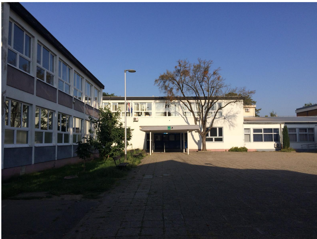
Sl. 34. OŠ Marije Jurić Zagorke (fotografirano 16. 8. 2024.)