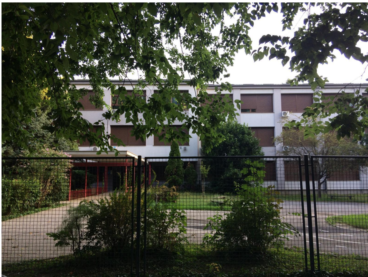
Sl. 15. OŠ Lovre pl. Matačića (fotografirano 16. 8. 2024.)

OŠ Petra Preradovića (sl. 16) izgrađena je 1967. godine, kao polu-montažna škola. Zgrada se obnavlja. Postavljeni su novi parketi i obojani su zidovi. Potrebni su radovi na izmjeni sustava grijanja te uređenje školske dvorane, školskog igrališta i svih sanitarnih čvorova. Također potrebna je ugradnja klima-uređaja. U školi se nalazi jedna učionica za geografiju i povijest. Škola raspolaže sa 51 računalom, od toga 21 računalo je novo, ostala računala su starija od 10 godina i potrebna im je zamjena. Također potrebna je zamjena 11 prijenosnih računala.