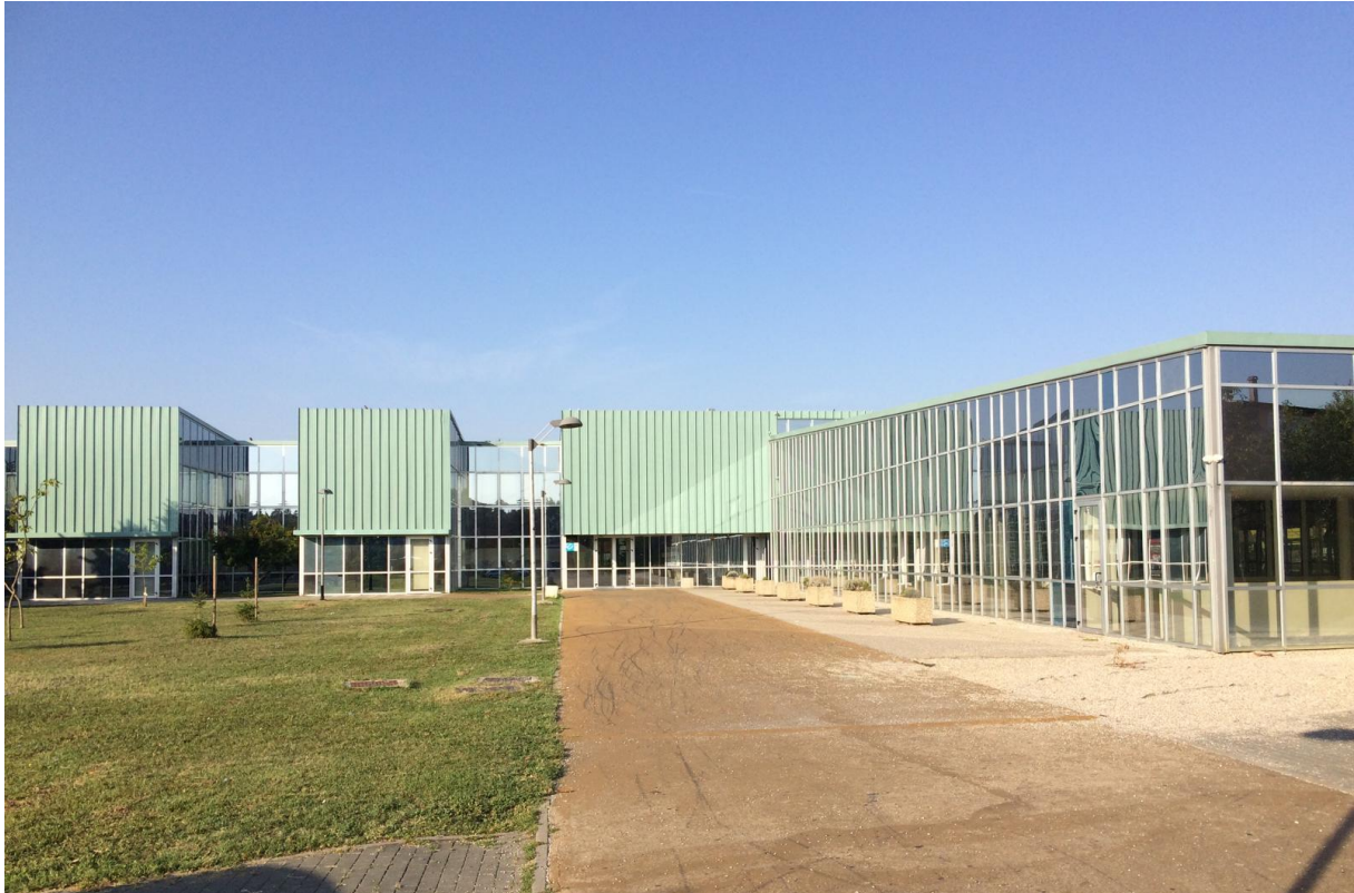
Sl. 43. OŠ Sesvetska Sopnica (fotografirano 16. 8. 2024.)

OŠ Sesvetska Sela (sl. 44) izgrađena je 2007. godine. Zgrada je obnovljena, ali iz godine u godinu sve je veća potreba za većim brojem učionica. Za 2023./2024. školsku godinu u Godišnjem planu i programu nisu navedena planirana ulaganja u školu. U školi se nalazi jedna učionica za geografiju i povijest i jedan kabinet za geografiju i povijest. Sve učionice imaju računalo. Od osnutka škole su nabavljena različita nastavna sredstva i pomagala (geografske i povijesne karte, informatička oprema i sl.) U Godišnjem planu i programu nije naveden broj računala s kojima škola raspolaže.