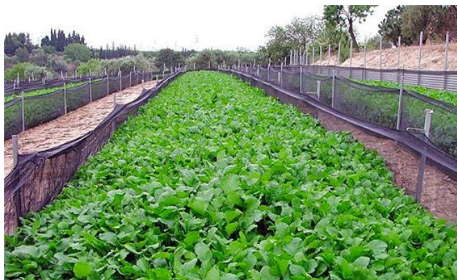
Slika 5. Gredica za uzgoj puževa

Uzgajalište je potrebno konstruirati na način da je čim jednostavnije za obradu i održavanje, da zadovoljava sve životne potrebe puževa i da ih adekvatno štiti. Oko cijele površine uzgajališta podiže se vanjska ograda. Dobar materijal za tu namjenu jesu pocinčane željezne ploče jer sprječavaju puževe da izlaze van zbog malog električnog šoka koji nastaje elektrolizom cinka s vlagom u tlu. Ograda mora biti visoka najmanje 60 - 70 centimetara iznad tla i ukopana barem 30 centimetara u tlo da spriječi ulazak predatora na područje uzgajališta. Unutar te vanjske ograde cijelo je uzgajalište podijeljeno u manje odjeljke tj. gredice (slika 5) između kojih postoje staze po kojima uzgajivači mogu hodati. Staze moraju biti očišćene od trave i široke do jednog metra, dok gredice ne bi trebale biti duže od 50 centimetara i šire od 2,5 - 4 metra. Gredice se svaka zasebno ograđuju mrežama. Gotovo sva uzgajališta u svijetu koriste patentirani talijanski proizvod, Helitex mreže. To su polietilenske mreže posebno konstruirane da štite puževe i sprječavaju njihov bijeg. Visoke su 106 centimetara, imaju dva preklopa koja otežavaju bijeg i montiraju se na plastične ili drvene stupove jer se željezni previše zagrijavaju tijekom vrućina. Nakon konstrukcije uzgajališta i pripreme tla, počinju se saditi biljke za hranu i sklonište puževima (Avagnina i Rađa 2000).