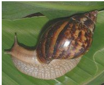
Slika 5. Achatina fulica

Achatina fulica (slika 5) može doseći duljinu tijela od 20 centimetara uz visinu kućice od 20 i promjera od 12 centimetara. Konusna kućica im je smeđe boje sa slabo vidljivim prugastim oznakama. Potječe iz istočne Afrike (Tanzanija, Kenija), u 19. stoljeću je proširen na Indiju, a u 20. stoljeću u jugoistočnu i istočnu Aziju, SAD te južnu Ameriku i danas predstavlja invazivnu vrstu. Lakši je za uzgoj od vrste Achatina achatina jer se bolje prilagođava promjenjivim uvjetima okoliša. Brzo dosiže spolnu zrelost, za manje od godinu dana, zato jer nisu ometeni u razvoju estivacijom ili hibernacijom. Razmnožavaju se unakrsno i liježu od 10 - 400 jaja.