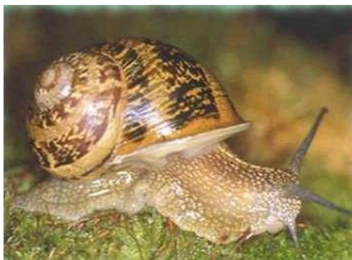
Slika 2. Cornu aspersum aspersum

Na europskom području najviše se uzgajaju vrste roda Cornu i Helix kao što su Cornu aspersum , Helix pomatia i Helix lucorum . Cornu aspersum (slika 2) je puž plućnjak rasprostranjen na području zapadne Europe i Mediterana na čije je klimatske uvjete i najbolje prilagođen, a ima ga i u južnoj Americi i Africi. Javlja se s par različitih podvrsta: Cornu aspersum elata koji živi u Africi, Cornu aspersum maxima koji označava divovsku podvrstu, Cornu aspersum major i Cornu aspersum aspersum koji živi u cijeloj Europi i najprodavanija je vrsta na tržištu. Cornu aspersum je najisplativiji puž za uzgoj jer je prilagodljiv i polaže mnogo jaja, 80 - 85 komada po gnijezdu, 3 - 4 puta godišnje. Jedina je vrsta roda Cornu koju je moguće uzgajati u zatvorenim uzgajalištima. U prirodi inače preferira vlažna staništa u grmlju, na stablima i na zidovima. Unutar vrste postoji velika varijabilnost s obzirom na boju i veličinu kućice. Tako se kućice prema boji dijele na tipične, svijetle, prugaste, pojasne, jednoboje, tamne i albino. Tipična kućica je tamne boje s četiri točkaste pruge. Prema veličini kućice se jedinke dijele na male, normalne, veće i velike (Avagnina i Rađa 2000).