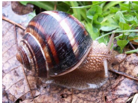
Slika 4. Helix lucorum

Helix lucorum još se naziva šumski puž (slika 4). Ima smeđu kućicu s četiri uočljive pruge, te je težine 20 - 35 grama. Najviše je prisutan u središnjoj Italiji, Albaniji, Grčkoj i Turskoj. Dobro se prilagođava različitim životnim uvjetima. Vrijednost na tržištu mu je 30 % manja nego ona puža vinogradnjaka jer ima naboranu mišićavu kožu (Avagnina i Rađa 2000).