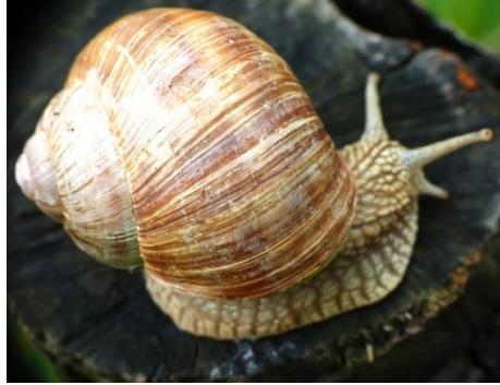
Slika 3. Helix pomatia