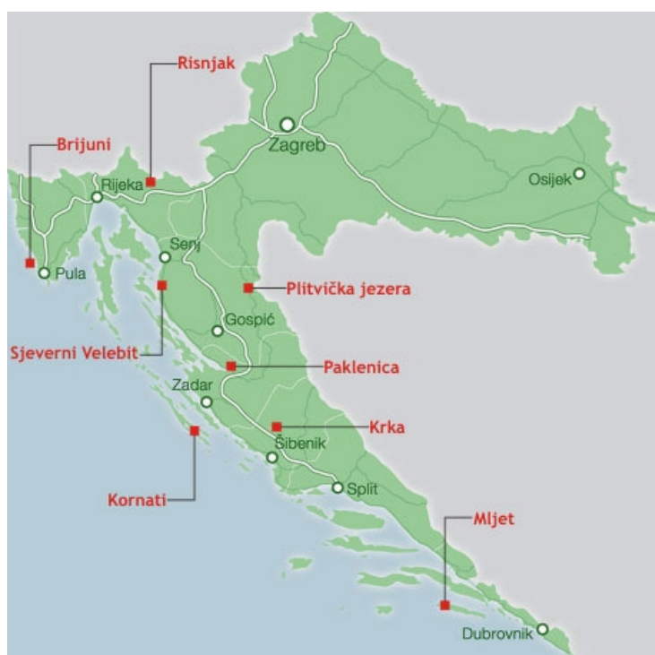
Slika 1. Geografski položaj nacionalnih parkova Hrvatske ( http://www.dzzp.hr ).

Nacionalni parkovi prvenstveno su namijenjeni očuvanju izvornih prirodnih vrijednosti (Zakon o zaštiti prirode RH, 2013), a njihova definicija isključuje svaku djelatnost koja bi mogla te vrijednosti oštetiti (npr. kamenolomi) i degradirati (npr. eksploatacija šume) prirodna svojstva i krajolik (Bralić, 2005). S druge strane, dozvoljava se tradicionalna poljoprivreda i turističko-rekreativna djelatnost.