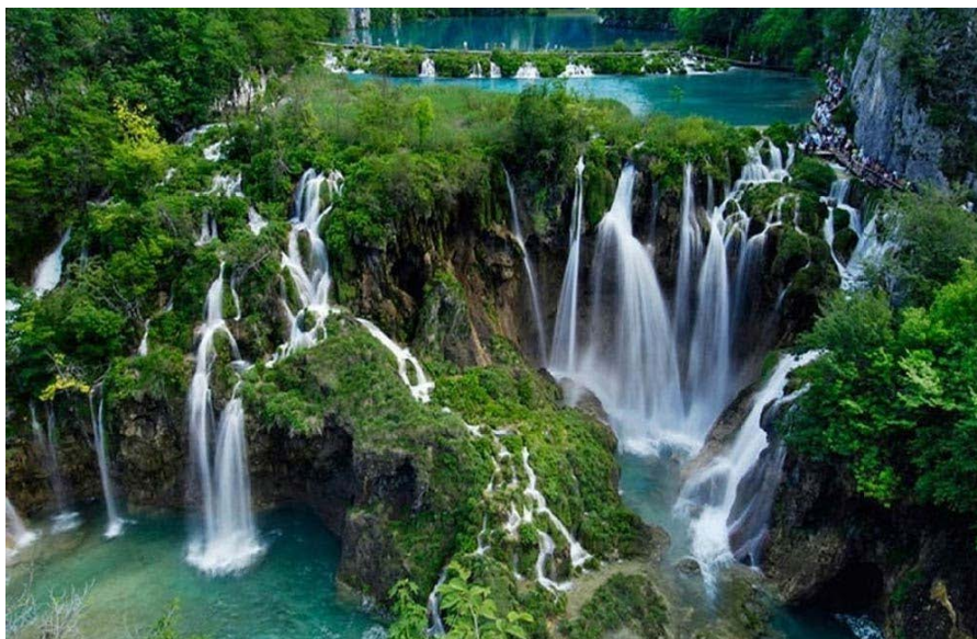
Slika 2. Sastavci, u nacionalnom parku Plitvička jezera – posljednje slapište u kaskadnom nizu.

U Parku se nalazi i poseban rezervat šumske vegetacije, Ćorkova uvala, i jedna od malobrojnih prašuma u Europi, s primjercima jela i smreka višima od 50 m (Stiperski, 2008).