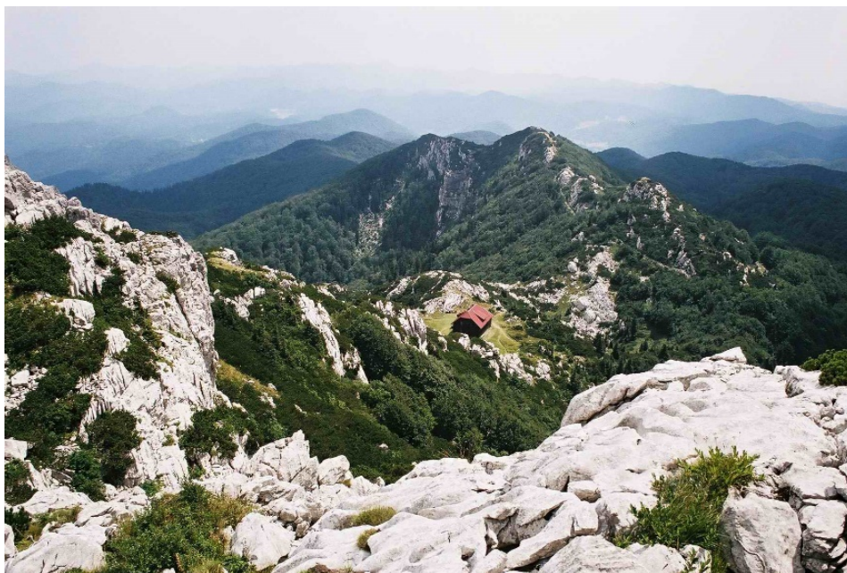
Slika 4. Pogled s vrha Risnjak na planinarski dom „Schlosserov dom“.