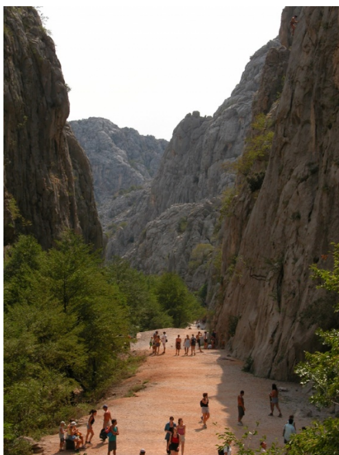
Slika 3. Kanjon Velika Paklenica.