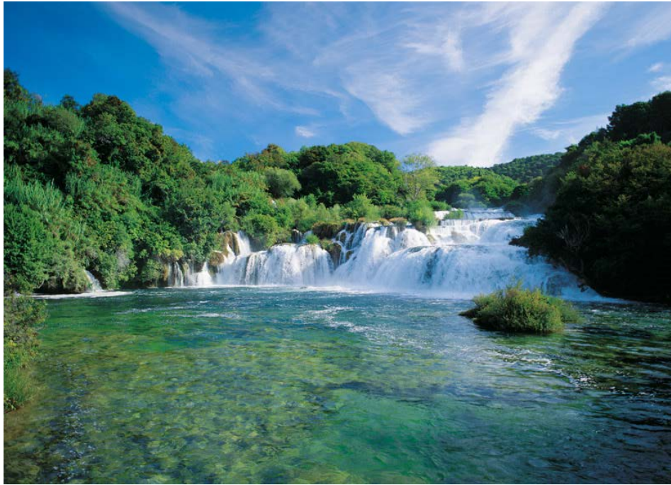
Slika 8. Sedrena barijera Skradinski buk.