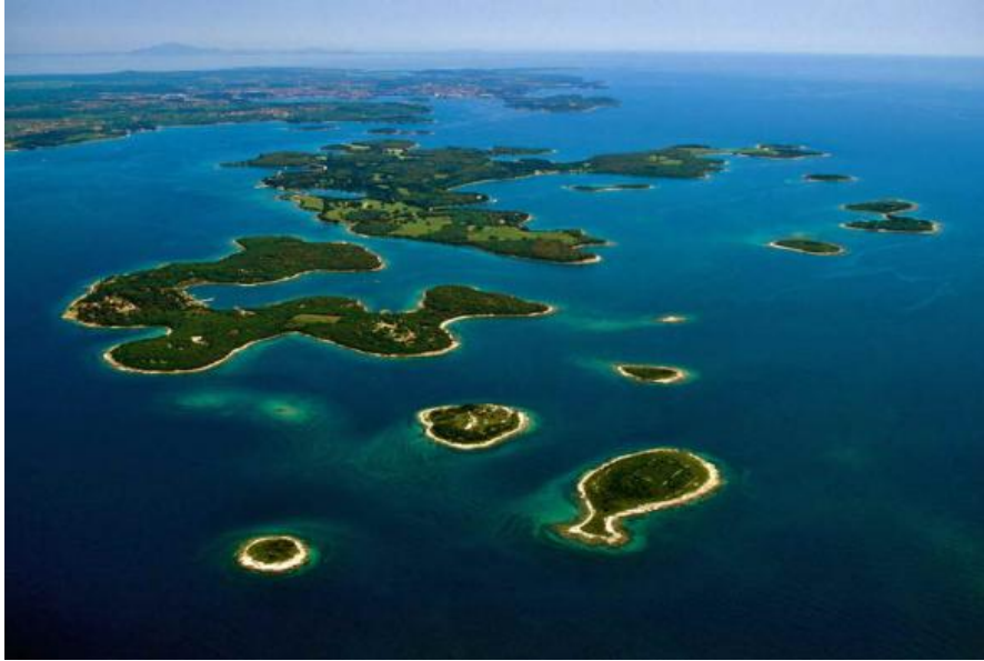
Slika 7. Pogled na brijunsko otočje.