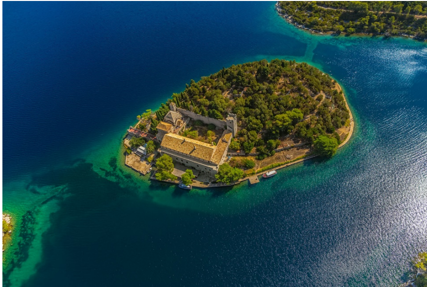
Slika 5. Otočić svete Marije u Velikom jezeru, s benediktinskim samostanom ( www.np-mljet.hr ).