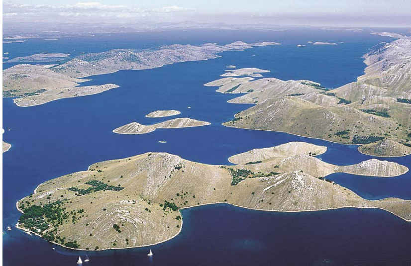
Slika 6. Pogled na otočje Kornati.