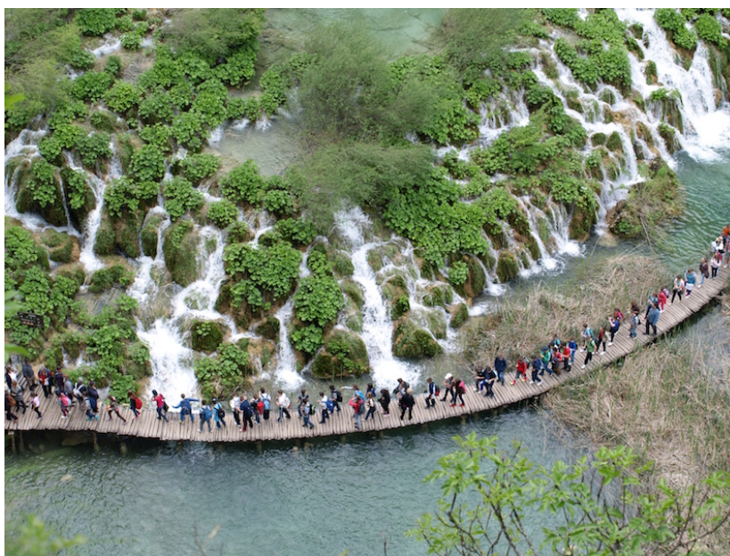
Slika 12. Prekomjeran broj posjetitelja u Nacionalnom parku Plitvička jezera

Velik broj posjetitelja (Slika 12.), koji premašuje milijun godišnje, ima izravan utjecaj na jezera i sedru – narušava se temperatura, količina vlage i fizikalno-kemijska svojstva vode, što nepovoljno utječe na nastanak sedre. Danas glavina posjetitelja dolazi direktno na jezera, na područja uz vodu i preko mnogobrojnih vodotokova, a nedovoljno primjerice na poučnu stazu Blankin put na vrhu Medviđaku, na šumovitom prostoru (Novosel, 2016). Drugi je problem prekomjerna urbanizacija i naseljavanje unutar granica Parka, što dovodi do uznemiravanja životinja i utječe na degradaciju staništa. Problem je i upravljanje vodnim resursima te njihovo korištenje – crpljenje vode za vodoopskrbu iz jezera Kozjak.