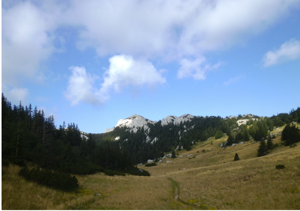
Slika 9. Velebitski Botanički vrt.