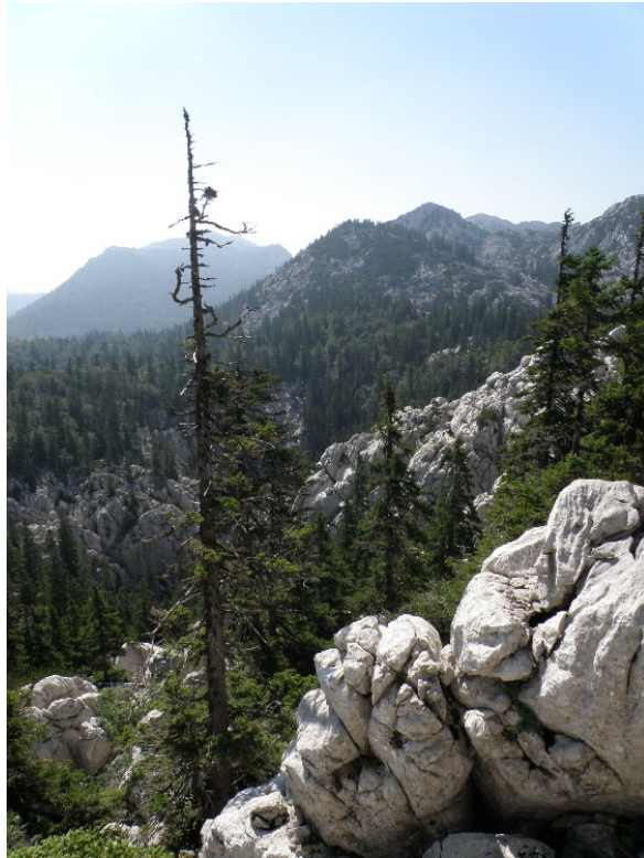
Slika 13. Utjecaj kiselih kiša na rast smreke.

problem u Parku su i kisele kiše, koje najviše utječu na šumske zajednice smreka (Slika 13.)