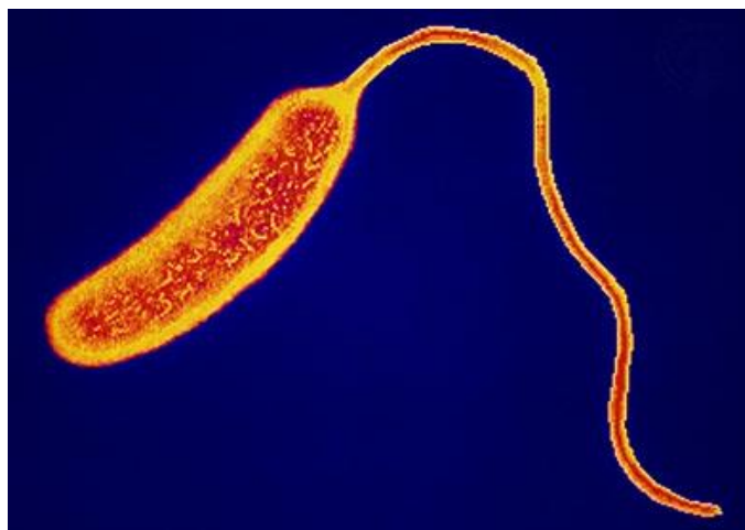
Slika 4. Vibrio cholerae

( https://microbewiki.kenyon.edu/index.php/Cholera )