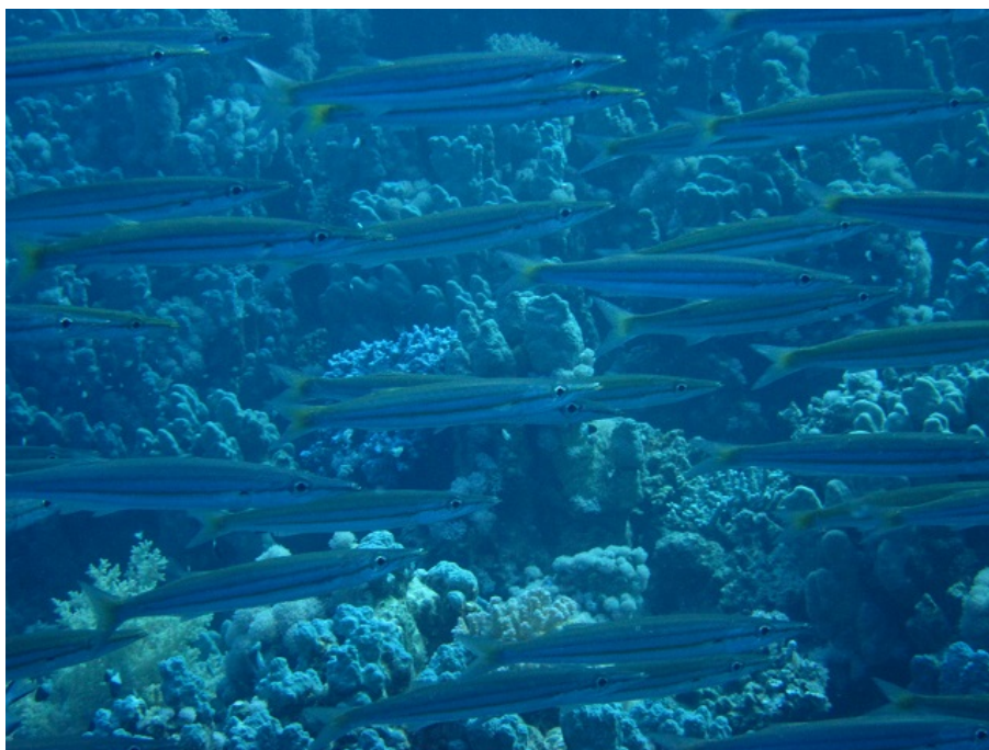
SLIKA 7. Sphyraena chrysotaenia

zube na nepcu i u čeljusti i različite su veličine. Ljuske na tijelu su joj male i cikloidne, a bočna pruga je ravna. Živi na dubinama do 50 metara, u pelagijalu, ali i u priobalju. Hrani se sitnijom ribom kao što je srdela i incun, a u prehranu ulaze i račići. Kreće se u velikim plovama, a zbog sličnosti sa škaramom, ne zna se je li vrsta brojnija u Jadranskom moru. Socio-ekonomski značaj nije stekla zbog svoje rijetkosti, ali postoji mogućnost da ako uspostavi populaciju dobije gospodarski značaj lokalnog karaktera. Lako ju se može zamijeniti sa škaramom i žutousnom barakudom. (Dulčić, J., Dragičević, B.)