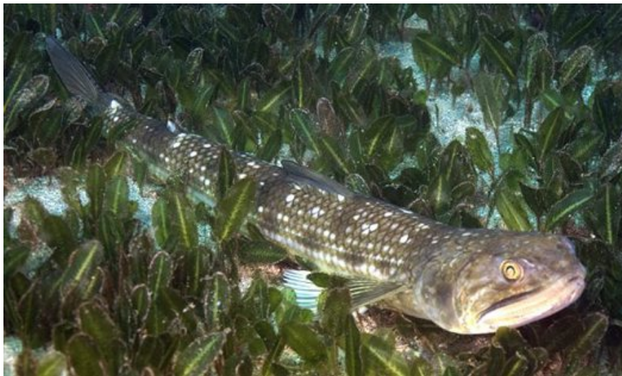
SLIKA 4. Saurida undosquamis

obalu. Ima važan gospodarski značaj u ribolovu, u Japanu se od nje pripremaju „riblji kolači“ – „kamaboko“. Moguća je zamjena ove ribe s autohtonim jadranskim vrstama barjaktarkom i gušterom zbog sličnosti. (Dulčić, J., Dragičević, B.)