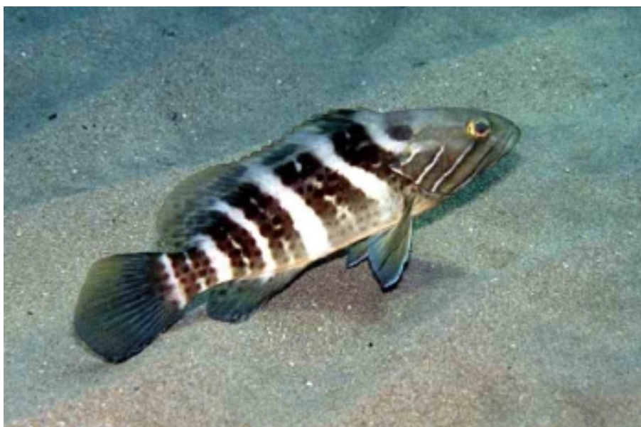
SLIKA 10. Epinephelus aeneus

Pripada porodici Serranidae. Tijelo joj je izduženo i robusno. Ima debelu kožu u koju su uklopljene sitne ljuske. Repna peraja joj je zaobljena. Zelenkastosive je boje, iako joj boja može varirati od svjetlijih bijelih nijansi do gotovo potpuno tamnih. Peraje su smeđe do ljubičaste boje i imaju svijetli rub. Mlade jedinke na bokovima imaju 5 tamnih pruga građenih od tamnih pjega. Sa strane glave imaju 2 do 3 bijele kose pruge.