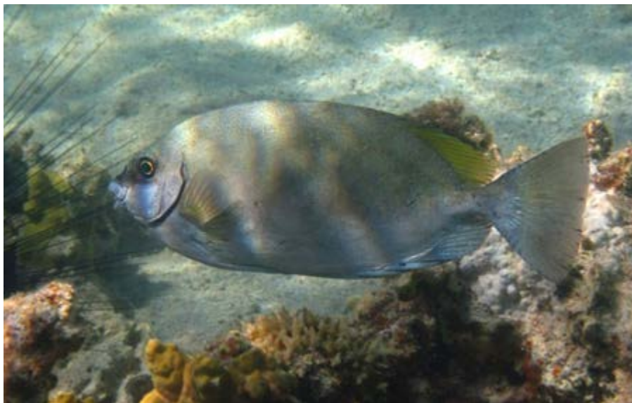
SLIKA 5. Siganus luridus

Pripada porodici Siganidae. Ova vrsta ima visoko, eliptično i bočno spljošteno tijelo. Gubica je tupa, glava pomalo konkavna u području iznad očiju, a usta su mala s izraženim usnama. Tamnosmeđe do maslinasto zelene je boje sa žućkastim tragovima na perajama. Sitne ljuske usađene su joj u kožu.