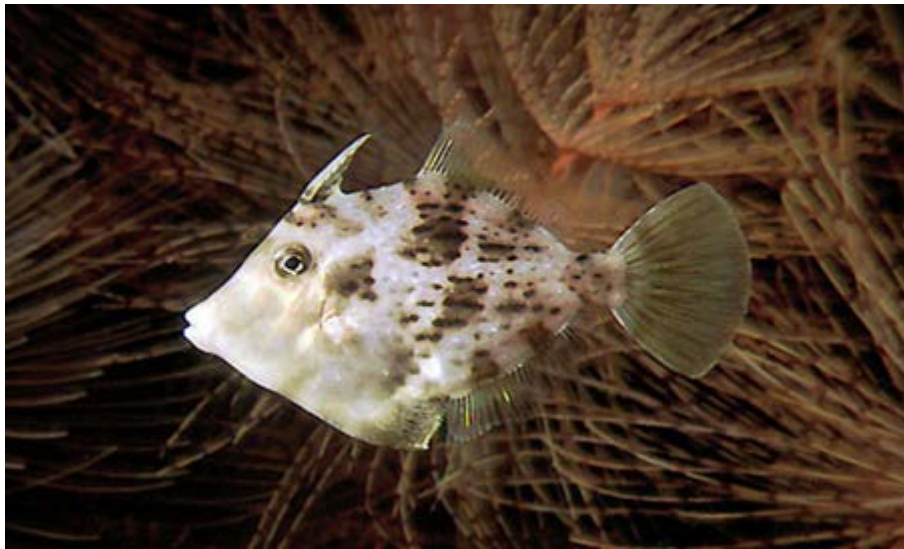
SLIKA 8. Stephanolepis diaspros

http://www.colapisci.it/tuffatore/balestra.htm