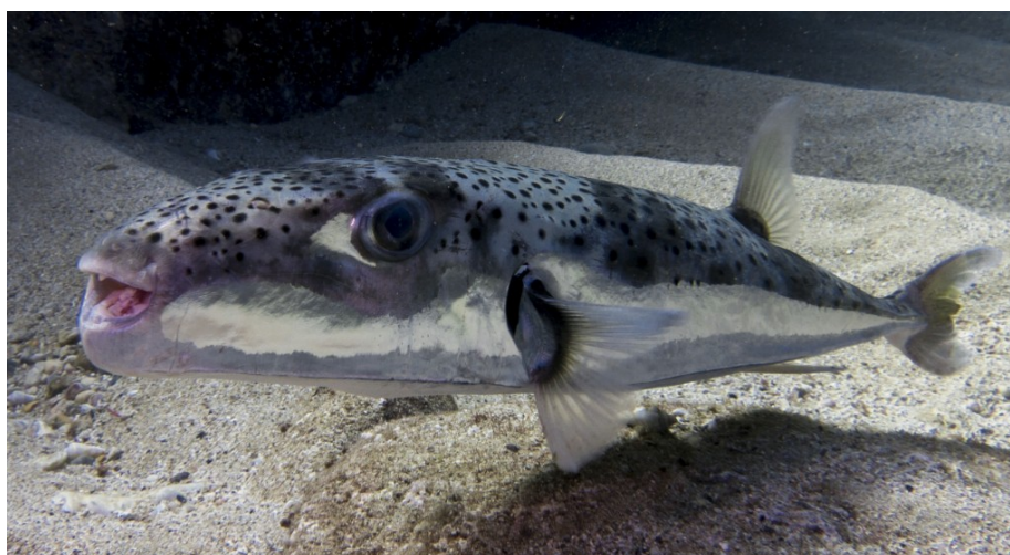
SLIKA 2. Lagocephalus sceleratus

http://www.bloomassociation.org/en/enlargement-of-the-suez-canal-the-number-of-ships-is-increasing-the-number-of-invasive-species-too/