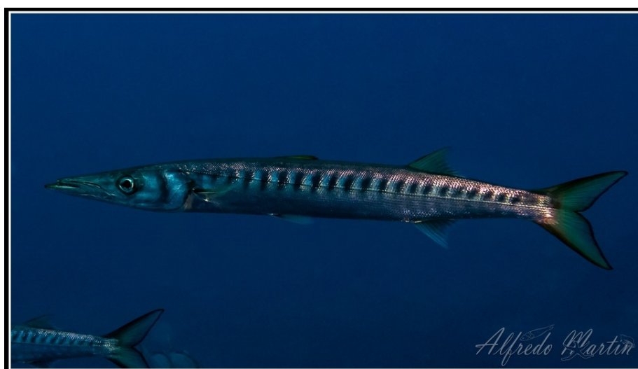
SLIKA 14. Sphyaena viridensis http://vidamarina.synology.me/?page_id=2693

Pripada porodici Sphyaenidae. Tijelo ove invazivne vrste je također izduženo, a u presjeku ovalno. Gubica joj je izdužena, donja čeljust duža od gornje, a u ustima se nalaze snažni i šiljasti zubi. Dorzalna strana tijela je tamno sive ili modre boje, a na bokovima je srebrna s tamnim prugama koje pri sredini prelaze ispod bočne pruge. Mlade jedinke su često zelenkaste do tamno žute boje. Podrepna peraja joj je sive boje.