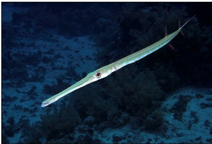
SLIKA 1. Fistularia commersonii

http://dalibor-andres.from.hr/uw/cmr_007.htm