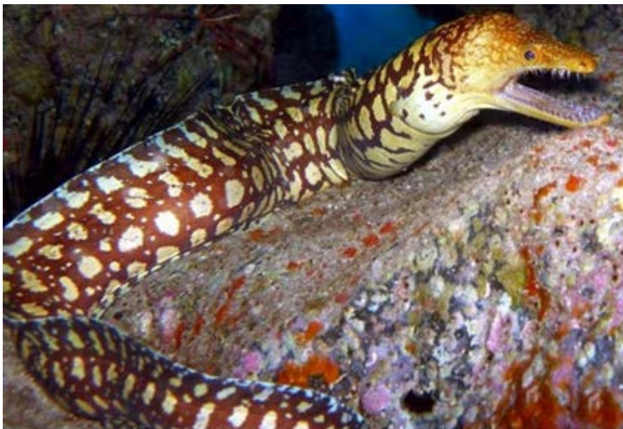
SLIKA 9. Enchelycore anatina

Pripada porodici Muraenidae. Tijelo ove invazivne ribe je izduženo i relativno visoko, a iza analnog otvora postaje bočno spljošteno. Leđna i podrepna peraja su spojene repnom perajom pa s njom čine jednu neprekinutu peraju. Prsnih i trbušnih peraja nema. Glava joj je duga s tupom gubicom, a u ustima se nalaze raznoliki zubi. Donja čeljust je izdužena i na vrhu zakrivljena prema gore.