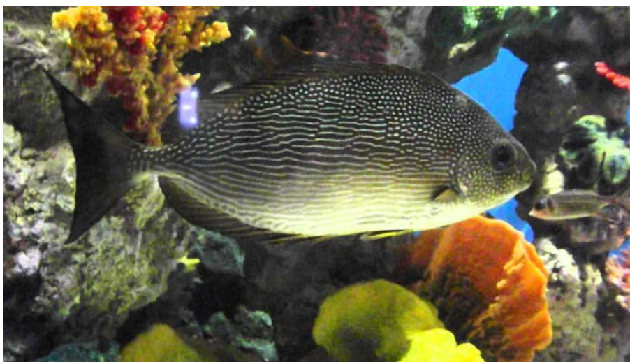
SLIKA 6. Siganus rivulatus

Pripada porodici Siganidae. Tijelo ove ribe je ovalno i bočno spljošteno. Repna peraja joj je račvasta. Gubica je tupa, gornji dio glave je blago konkavan, usta su mala s izraženim usnama, s time da gornja usna preklapa donju. Dorzalna strana joj je sivo-zelene do smeđe boje, a ventralna svijetlo smeđe do žute boje. Na bokovima se nalaze blijede žuto-smeđe linije. Živi na plićim pješčanim dnima gdje se hrani algama. Kreće se u plovama. Ima veliki gospodarski značaj. U Jadranu je rijetka pa nema neki poseban značaj. Umjetno se uzgaja u nekim zemljama Sredozemlja. Sve bodlje na tijelu su kao i kod prethodne vrste blago otrovne. (Dulčić, J., Dragičević, B.)