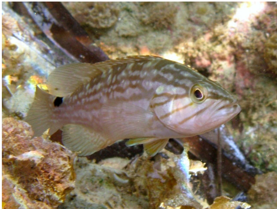
SLIKA 12. Mycteroperca rubra

metara, najčešće od 15-50 na kamenitom dnu. Manji gospodarski značaj ima u ribolovu podvodnom puškom tamo gdje je brojnija, dok je kod nas rijetka i beznačajna. (Dulčić, J., Dragičević, B.)