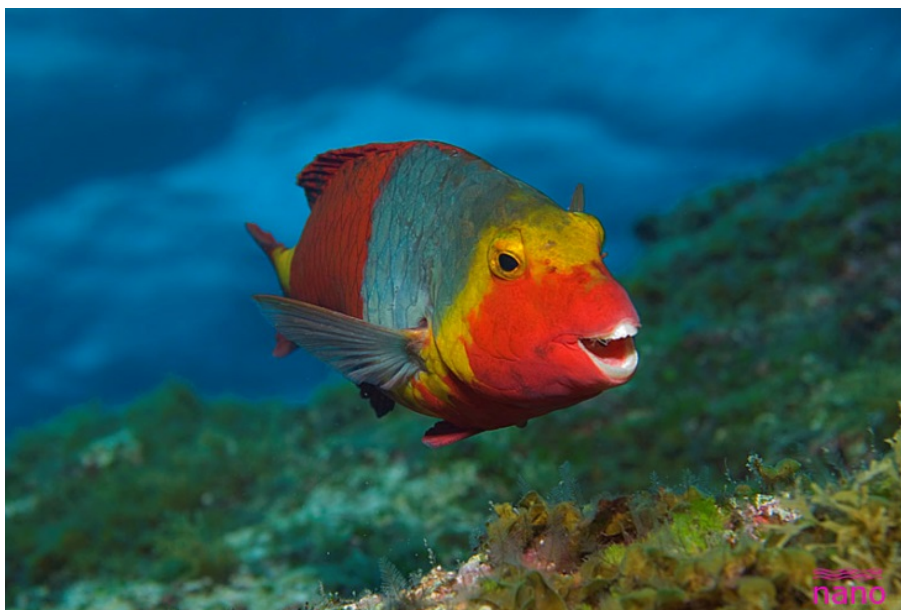
SLIKA 13. Sparisoma cretense