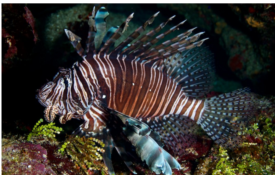
SLIKA 3. Pterois miles

( http://www.invazivnevrste.hr/?species of the month=divovski-svinjski-korov-heracleum-mantegazzianum-sommier-et-levier )