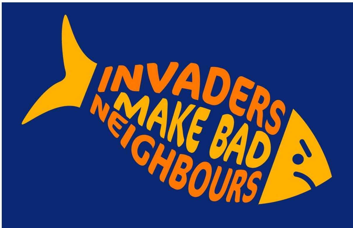
SLIKA 16. Invazivne vrste riba

https://ferrebeekeeper.wordpress.com/tag/invasive-species/