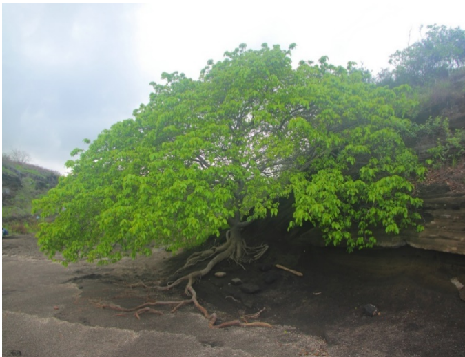
Slika 12. Hippomane mancinella L.

Čine ga tri vrste, autohtone u središnjoj Americi, Karibima, Meksiku, Floridi, Kolumbiji, Floridi i otočju Galapagos. Hippomane mancinella L. jedno je od najotrovnijih stabala na svijetu, rasprostranjeno na obalama i bočatim močvarama unutar mangrove (sl.12). Odlično štiti od vjetra, a korijenje stabilizira tlo sprječavajući eroziju. Drvo može narasti do 15 metara, sivkaste je kore, izmjeničnih listova i nosi plod sličan jabuci koji je otrovan (sl.13.). Svi dijelovi biljke sadrže toksine. Biljni sok sadrži forbolne estere koji u doticaju s kožom uzrokuju jake plikove. Nije sigurno stajati ispod krošnje, jer sok nošen vodom može dospjeti do kože. Paljenje drveta može prouzročiti tegobe ako dim dospije do očiju. Drvo sadrži toksine 12-deoksi-5-hidroksiforbol-6-gama-7-alfa-oksidi, hippomanin, mancinelin i sapogenin. Do danas nije razjašnjena potpuna fitokemija vrste ( https://web.archive.org/web/20041110134449/http://sun.ars-grin.gov:8080/npgspub/xsql/duke/plantdisp.xsql?taxon=475 ). Drvo često ima znak upozorenja ili je označeno crvenim slovom X na kori kako bi se upozorili turisti. U Floridi je stavljeno na popis ugroženih vrsta te je 2011. uvrštena u Guinnessovu knjigu rekorda u kategoriju najopasnijeg drveta. ( https://www.sciencealert.com/here-s-why-you-shouldn-t-stand-under-world-s-most-dangerous-tree )