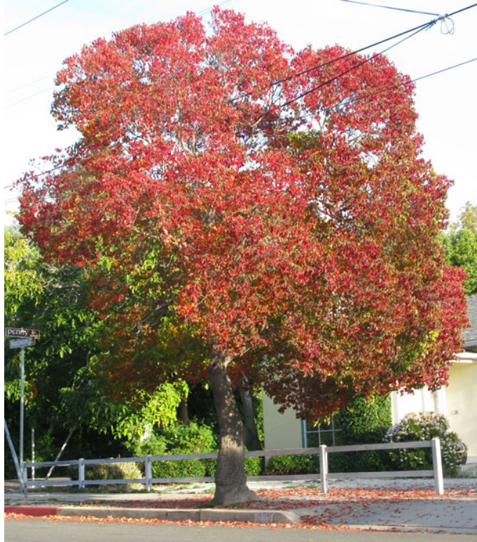
Slika 18. Triadica sebifera (L.) Small u jesen ( https://selectree.calpoly.edu/tree-detail/triadica-sebifera )