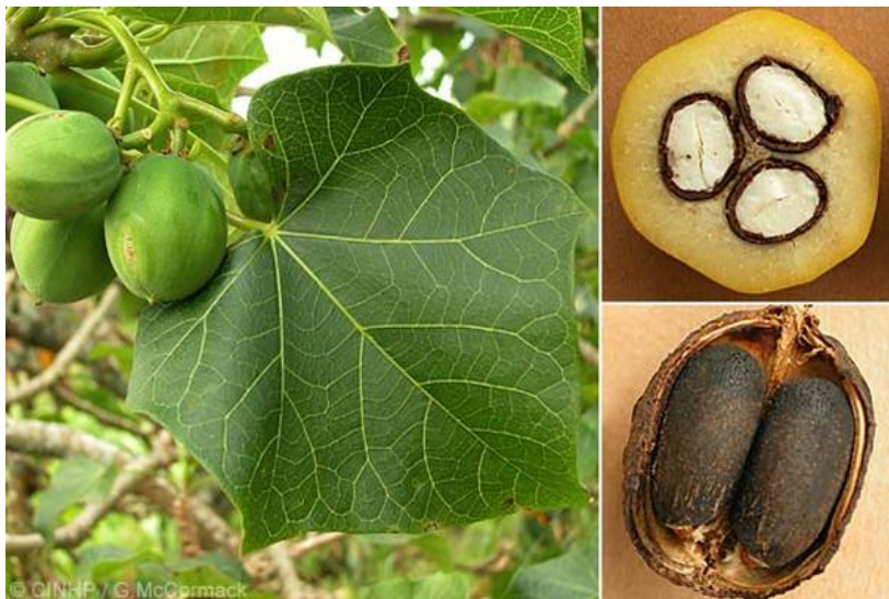
Slika 14. Jatropha curcas L.

Obuhvaća otprilike 170 vrsta sukulentnih, grmolikih i drvolikih biljaka. Većina je autohtona u Americi, a šezdesetak u zemljama Starog svijeta. Iz ovog roda najinteresantija je vrsta Jatropha curcas L. čije se ulje koristi za proizvodnju biogoriva (sl.14.). Sjemenke sadrže ulje koje može činiti do 40% ukupne mase sjemenke, razne enzime i toksine. Od toksina su prisutni lektini i karcinogeni forboli. Cijanovodik se nalazi u cvijetu, sjemenkama, korijenu i kori. Postoje varijeteti bez toksina. Osim što se koristi kao biogorivo, rabi se kao purgativ, antiparazitsko sredstvo i protuotrov ugrizu zmijske ( http://www.inchem.org/documents/pims/plant/jcurc.htm ).