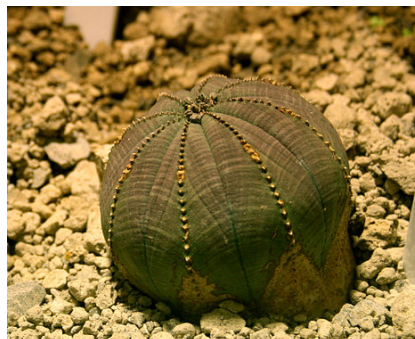
Slika 9. Euphorbia obesa Hook.

Mlječika iz južne Afrike, primjer je morfološke raznolikosti mlječika zbog kuglastog izgleda te se koristi kao ukrasna biljka. U divljini je ugrožena zbog sakupljanja jer je sporog rasta i stvara samo dvije do tri sjemenke po sezoni. Zbog toga je naširoko kultivirana i rasprostranjena u botaničkim vrtovima ( http://www.plantsrescue.com/euphorbia-obesa/ ).