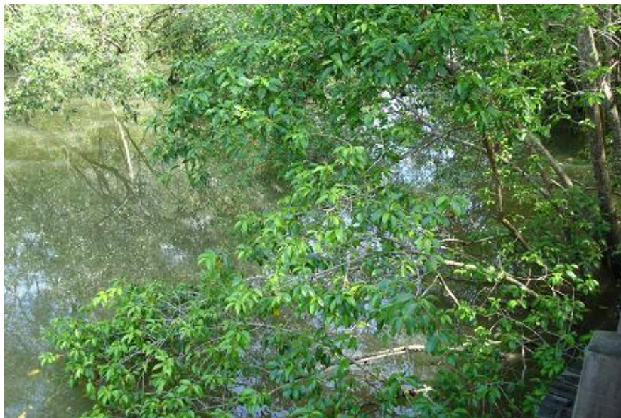
Slika 11. Excoecaria agallocha L.

Biljke karakteristične za Afriku, južnu Aziju, sjevernu Australiju i oceanske otoke. Excoecaria agallocha L. česta je u šumama mangrova od Bangladeša, Indije pa do Australije. Unutar mangrova, nalazi se dalje od vode zbog manje koncentracije soli. Među ljudima je poznata po lateksu koji je izrazito toksičan i iritabilan. Sok sadrži diterpenoide, triterpenoide, sterole i flavonoide. Uzrokuje plikove i privremen gubitak vida. Zbog svog kompleksnog fitokemijskog sastava, pokazuje antioksidativna, antimikrobna, antikancerogena, antitumorska djelovanja, te ima potencijala za daljnja istraživanja u medicinske svrhe ( https://www.ncbi.nlm.nih.gov/pmc/articles/PMC5214557/ ).