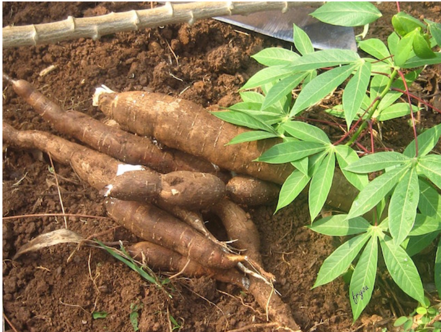
Slika 15. Manihot esculenta Crantz

Rodu pripada stotinjak grmolikih i drvenastih biljaka, autohtonih u područjima tropske Amerike te se nakon otkrića Amerike rasprostranio u Aziju i Afriku. Tipičan predstavnik roda je Manihot esculenta Crantz narodno zvana manioka, tapioka ili kasava. Grmolika biljka, intenzivno kultivirana u tropskim i suptropskim područjima zbog gomoljastog korijena bogatog škrobom. Poslije riže i kukuruza, treći je najveći izvor škroba u tropskim područjima. Bez obzira na to što imaju ekonomsku važnost, njihovoj uporabi potrebno je pristupiti s pažnjom, jer listovi i gomolj sadrže toksične cijanogene glikozide linamarin i lotaustralin. Na temelju koncentracije glikozida u biljci, manioka se klasificira u dvije kategorije, “gorka” i “slatka”. Enzim linamaraza oslobađa cijanovodik koji ako se konzumira neobrađena manioka može prouzročiti akutna ili kronična trovanja, ataksiju i pankreatitis ( https://www.hort.purdue.edu/newcrop/duke_energy/Manihot_esculenta.html ).