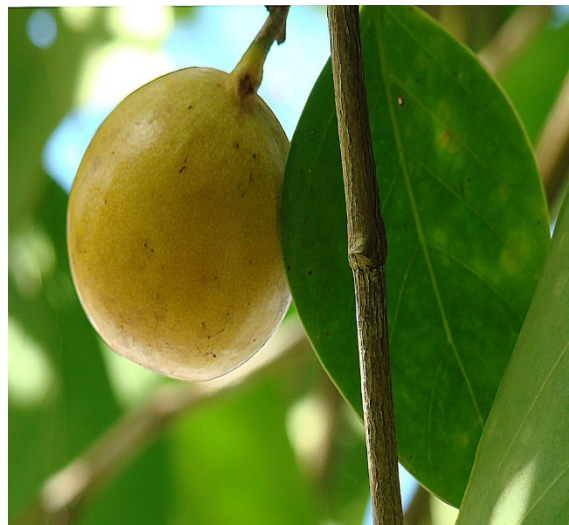
Slika 13. plod

( http://www.darwinfoundation.org/datazone/checklists/450/ )