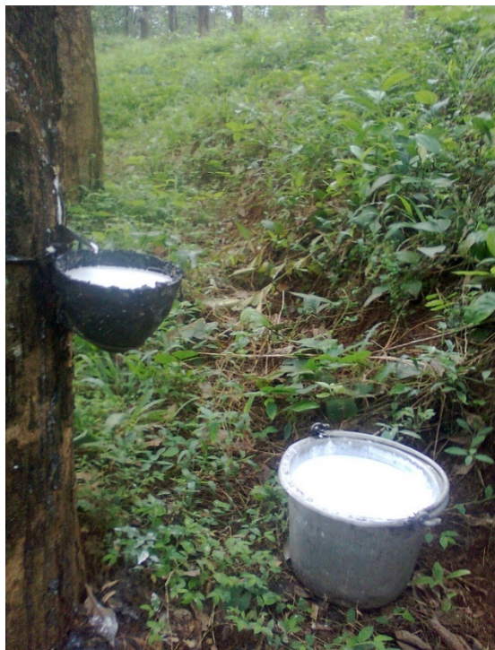
Slika 2. Lateks kaučukovca

Mlječike su poznate po svojoj raznolikoj fitokemiji, te sintetiziraju raznolike spojeve: terpene, alkaloide, glikozide, lektine, forbolne estere i dr. Ti spojevi se izlučuju prilikom ozljede, a imaju prije svega antiherbivorni učinak. Guma se pojavljuje u karakterističnom mliječnom soku – lateksu (sl. 2); po kemijskom sastavu je politerpen od 1500-15000 izopentenskih jedinica. Mliječni sok je sastavljen od terpenoidnih spojeva: eufola, tirukalola i euforbola. Komercijalno se iskorištava kaučukovac, Hevea brasiliensis L. Mlječike danas imaju bitan ekonomski, medicinski i resursni značaj. (Pevalek – Kozlina, 2003.)