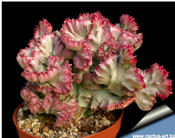
Slika 10. Euphorbia lactea Haw. "Cristata"

Kultivar neobičnog oblika, ne dostigne veličinu poput tipične divlje vrste E. lactea nego ostaje mala i kompaktna, u obliku naborane lepeze. Nastaje cijepljenjem vrste E. lactea na vrstu E. neriifolia ( http://www.scienceprofonline.com/biology-general/coral-cactus-care-grafted-euphorbia-lactea-cristata.html ).