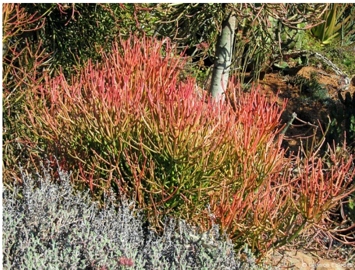
Slika 6. Euphorbia tirucalli L.

Biljka koja ne zahtjeva pretjeranu brigu i malo vode. Dobila ime zbog mase cilindričnih tankih ogranaka nalik na olovke. Lateks se može pretvoriti u tekućinu sličnu gorivu ulju te je slavni kemičar Melvin Calvin predložio njezinu sadnju za proizvodnju ulja iz razloga što raste gdje druge biljke uglavnom ne rastu ( http://www.iucnredlist.org/details/44452/0 ).