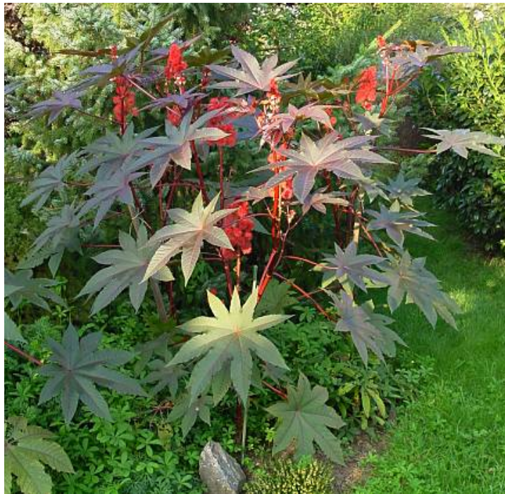
Slika 16. Ricinus communis L.

Ricinus communis L. (sl.16.) jedina vrsta roda Ricinus , ime dobila zbog izgleda sjemenke koja podsjeća na krpelja. Rasprostranjena u jugoistočnoj Europi, istočnoj Africi i Indiji. Svi dijelovi biljke su otrovni ( http://www.plantea.com.hr/ricinus/ ). Sjemenka (sl.17.) sadrži ribosom-inaktivirajući protein ricin sastavljen od dva lanca. Ricin, vezujući se na ribosome prekida sintezu aminokiselina, time uzrokujući narušavanje staničnog metabolizma. Ingestijom sjemenki pojavljuju se simptomi poput grčeva, dehidracije, dijareje, niskog krvnog tlaka, te ako se ništa ne poduzme, može biti pogubna. Današnja industrija razvila je tehnike kojima se ekstrahira otrovni ricin iz sjemenki, te tako dobiveno ulje ima raznoliku upotrebu. Uzagaja se i kao ukrasna biljka ( http://poisonousplants.ansci.cornell.edu/toxicagents/ricin.html ).