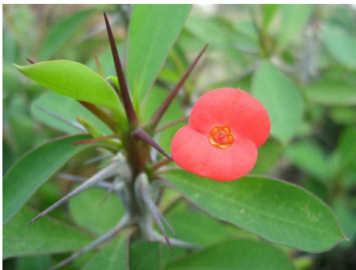
Slika 7. Euphorbia milii Des Moul.

Mlječika grmolika rasta, izdanaka gusto prekrivenih trnovima koja potječe s Madagaskara. Mali cijatiji okruženi s dvije upadljivo obojene brakteje, najčešće crvene, ružičaste ili bijele boje. Vrsti je ime dano u čast francuskom guverneru P. B. Miliusu koji je 1821. unosi u Francusku ( http://www.plantea.com.hr/kristov-trn/ )