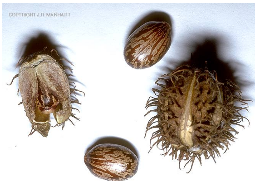
Slika 17. Plod i sjemenke