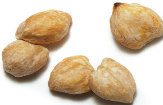
Slika 3. Aleurites moluccanus (L.) Willd. – sjemenke

Mali rod visokih drvenastih mlječiki prisutan u Aziji, Pacifiku i Karibima. Plod je mesnatog egzokarpa i drvenastog endokarpa, unutar kojeg je toksična sjemenka bogata uljima (sl.3). Predstavnik roda je Aleurites moluccanus (L.) Willd. koji se brzo proširio zahvaljujući utjecaju čovjeka. Sjemenke su umjereno toksične, sadrže saponine i forbolne estere. Danas se kukui masovno kultivira na Havajskom otočju gdje je 1959. proglašen službenim drvetom savezne države Havaji. Razlog kultiviranja je kukui ulje, koje nije toksično ili iritirajuće, a popularno je u izradi kozmetičkih preparata ( http://tropical.theferns.info/viewtropical.php?id=Aleurites+moluccanus ).