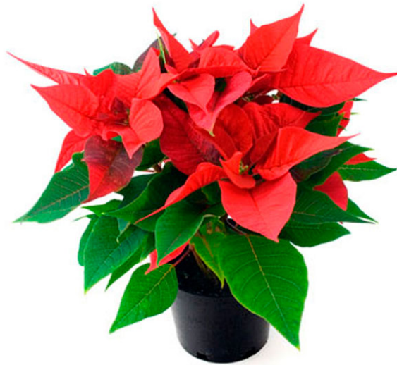
Slika 8. Euphorbia pulcherrima Willd. ex Klotzsch

( http://www.po.flowerscanadagrowers.com/our-products/1606/euphorbia/pulcherrima )