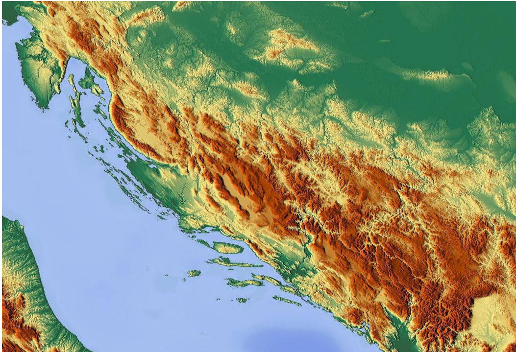
Slika 1: Prikaz pružanja Dinarida.

Drina, Sutjeska, Vrbas, Ugar, Piva, Tara, Komarnica, Morača, Lim, i Drim. Broj izvora i rijeka raste u dinarinskom rasponu, a kvaliteta vode iznimno je visoka.