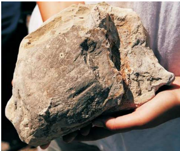
Slika 2: Klast s glacijalnim strijama i nekoliko brazdi u dijamiktu s muljnom potporom. Veliko Rujno. Preuzeto iz prezentacija profesora Tihomira Marjanca.