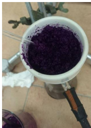
Slika 3. Priprema kobalt-etildiamintetraoctene kiseline (Co-EDTA).

Co-EDTA (Slika 3) može se pripremiti kao litijeva ili natrijeva sol Co(III)-EDTA. Stanične stijenke mogu se pripremiti tako što se biljni materijal prvo tretira s detrdžentom (po potrebi i s amilazom, ako je u biljci veći udio škroba) kako bi se uklonili topivi materijali koji bi mogli reagirati s metalima. Nakon dobrog ispiranja, pripremljena biljna vlakna se mogu obilježi kromom (Uden i sur., 1980). Markere se zatim može dati životinjama u komadiću hrane (npr. jabuke), a nakon što ih životinje unesu u organizam, slijedi skupljanje fecesa u određenim periodima. Za detekciju markera u fecesu mogu poslužiti metode poput plamene apsorpcijske spektroskopije. Brzina probave se zatim iz dobivenih rezultata računa statistički (Pei i sur., 2001).